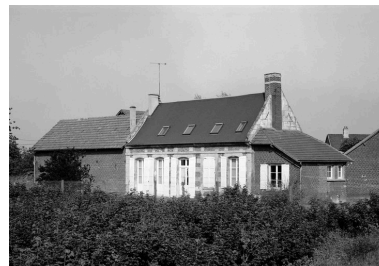
Logis. Elévation postérieure.