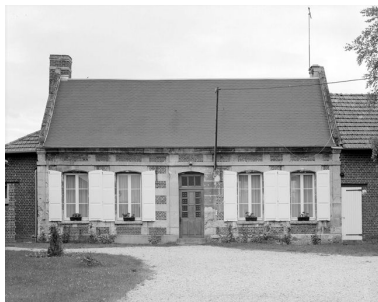
Logis. Elévation antérieure. IVR22_19856000992V