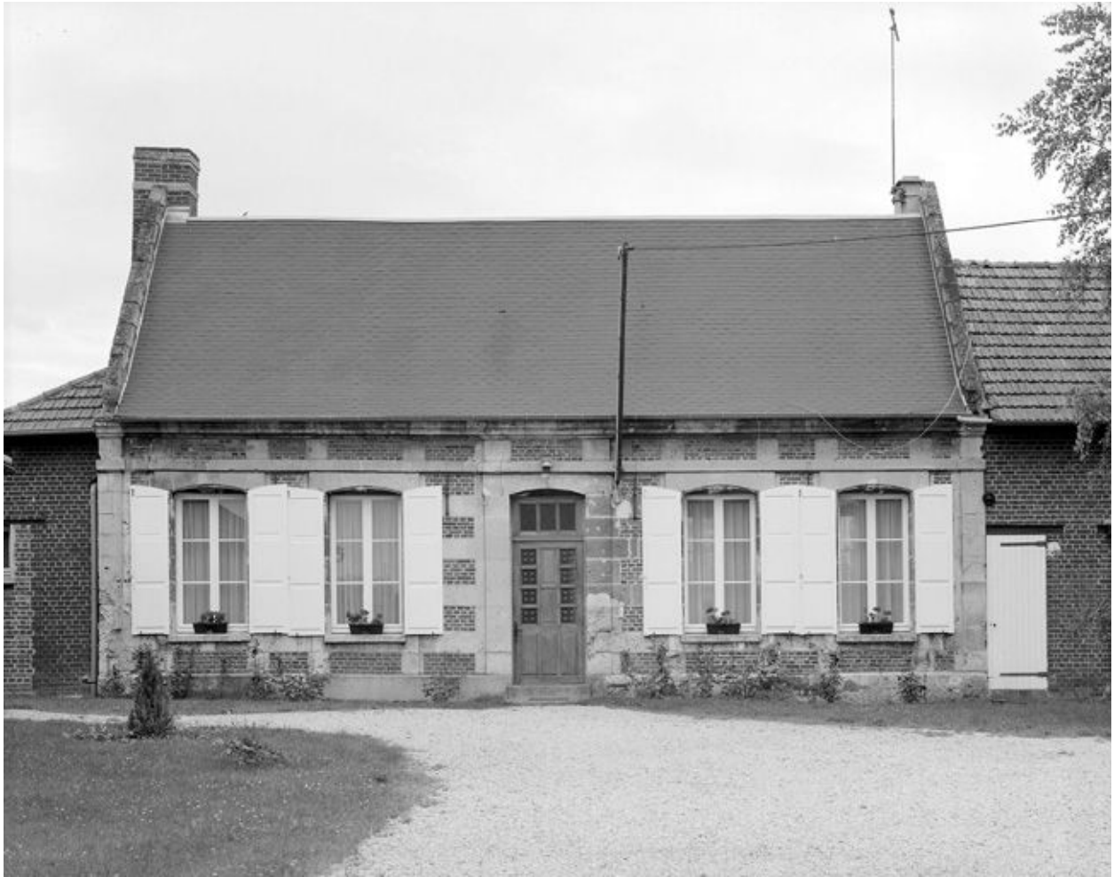
Logis. Elévation antérieure.