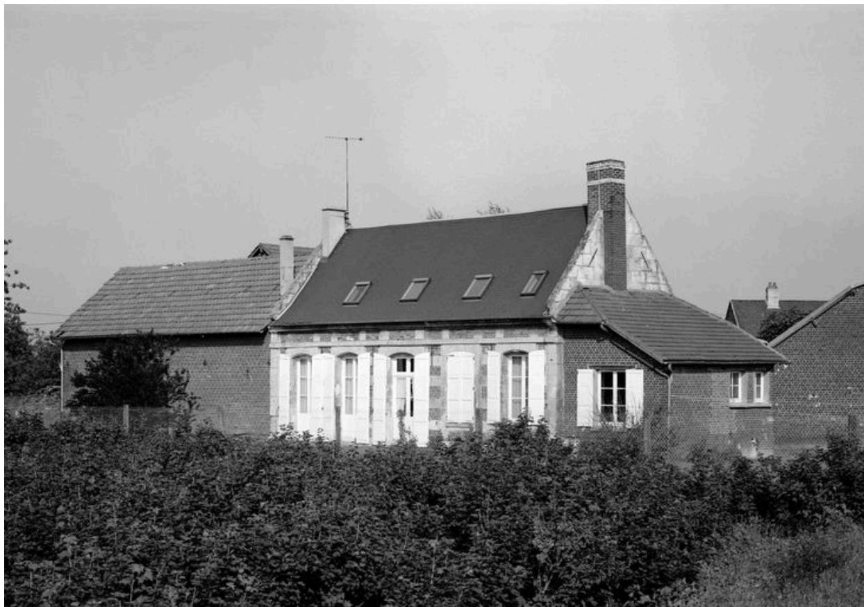
Logis. Elévation postérieure.