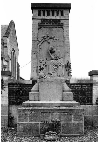
Vue générale. IVR22_19856000008X