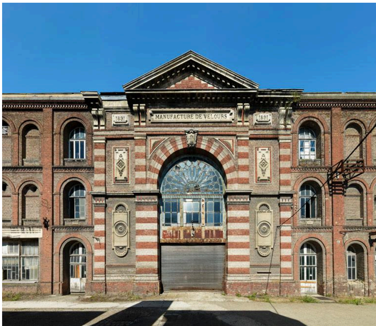
AMIENS. Ancien tissage de toiles et de velours, dit manufacture de velours Cosserat - Façade de la salle des machines.