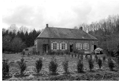
Vue générale. IVR22_19980200824Z