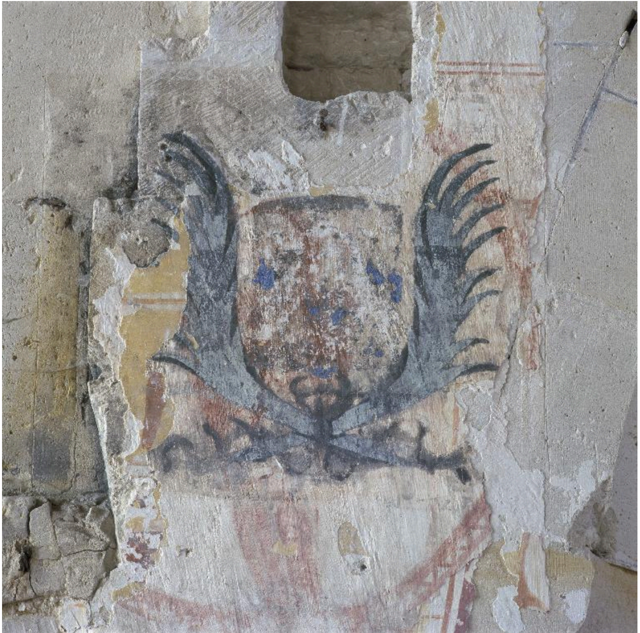
Détail de l'écu armorié.