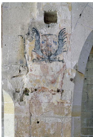
Vue de l'ensemble du décor peint subsistant. IVR22_20020200392XA