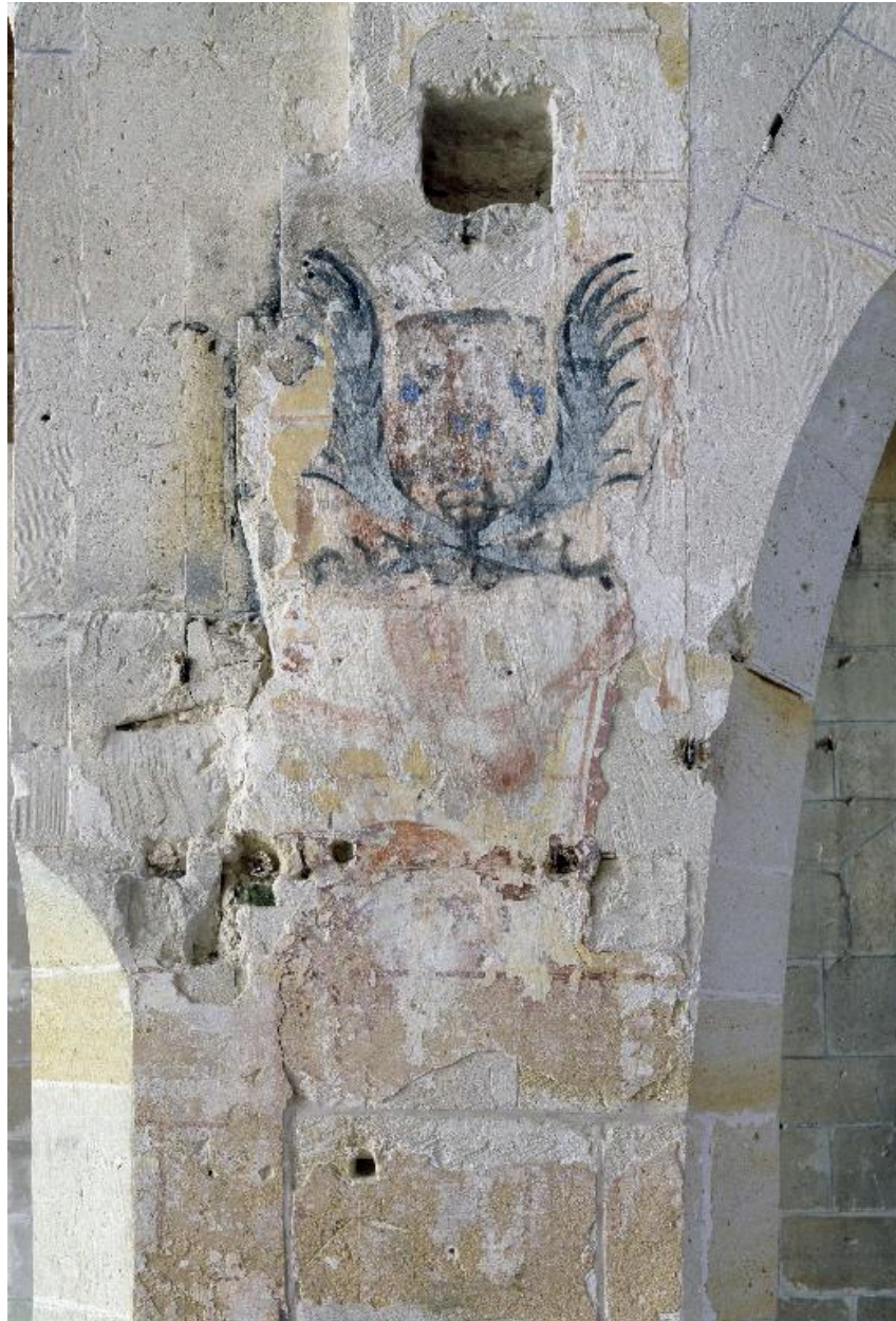
Vue de l'ensemble du décor peint subsistant.