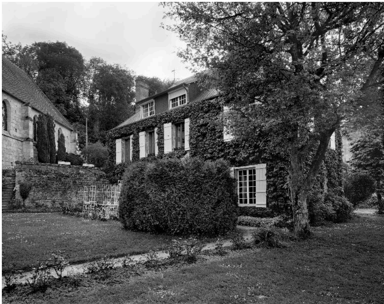
Vue de l'ancien presbytère, depuis l'est.