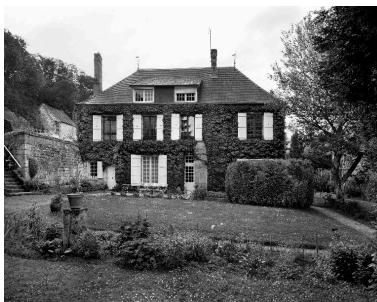
Vue de l'élévation sud-est. IVR22_19900200860V