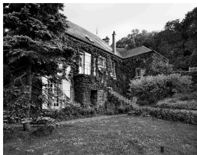
Vue générale nord. IVR22_19900200859V