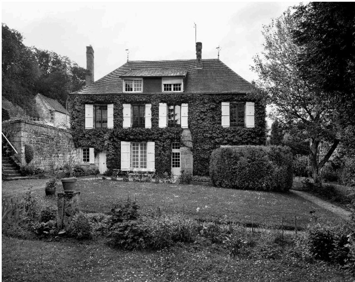
Vue de l'élévation sud-est.