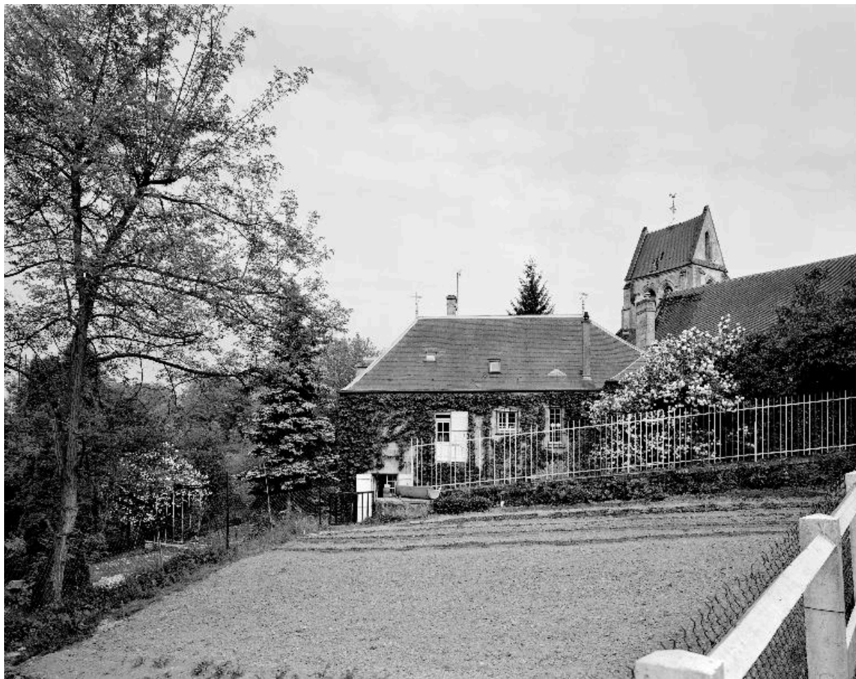
Vue nord-ouest de l'ancien presbytère, dans son environnement.