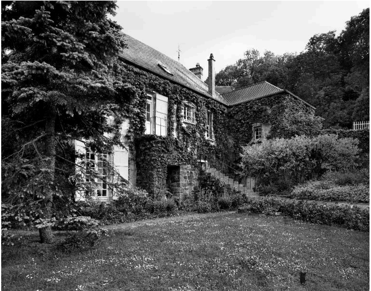
Vue générale nord.