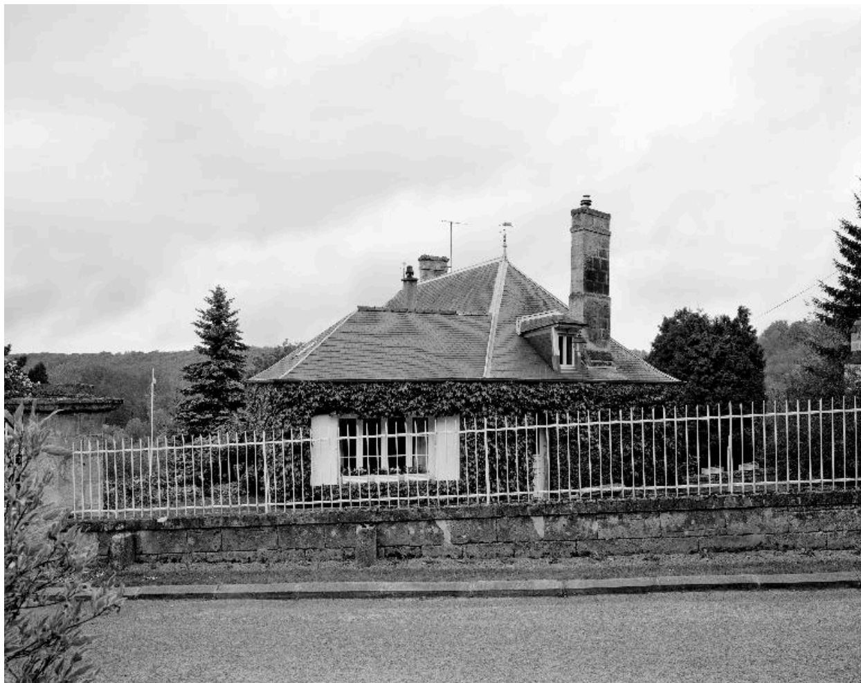
Vue de l'ancien presbytère, depuis la rue de l'Église à l'ouest.