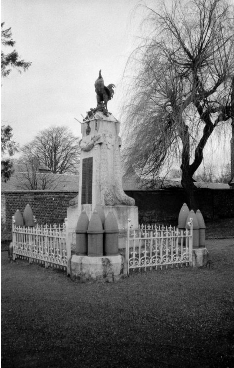
Vue de trois-quarts.