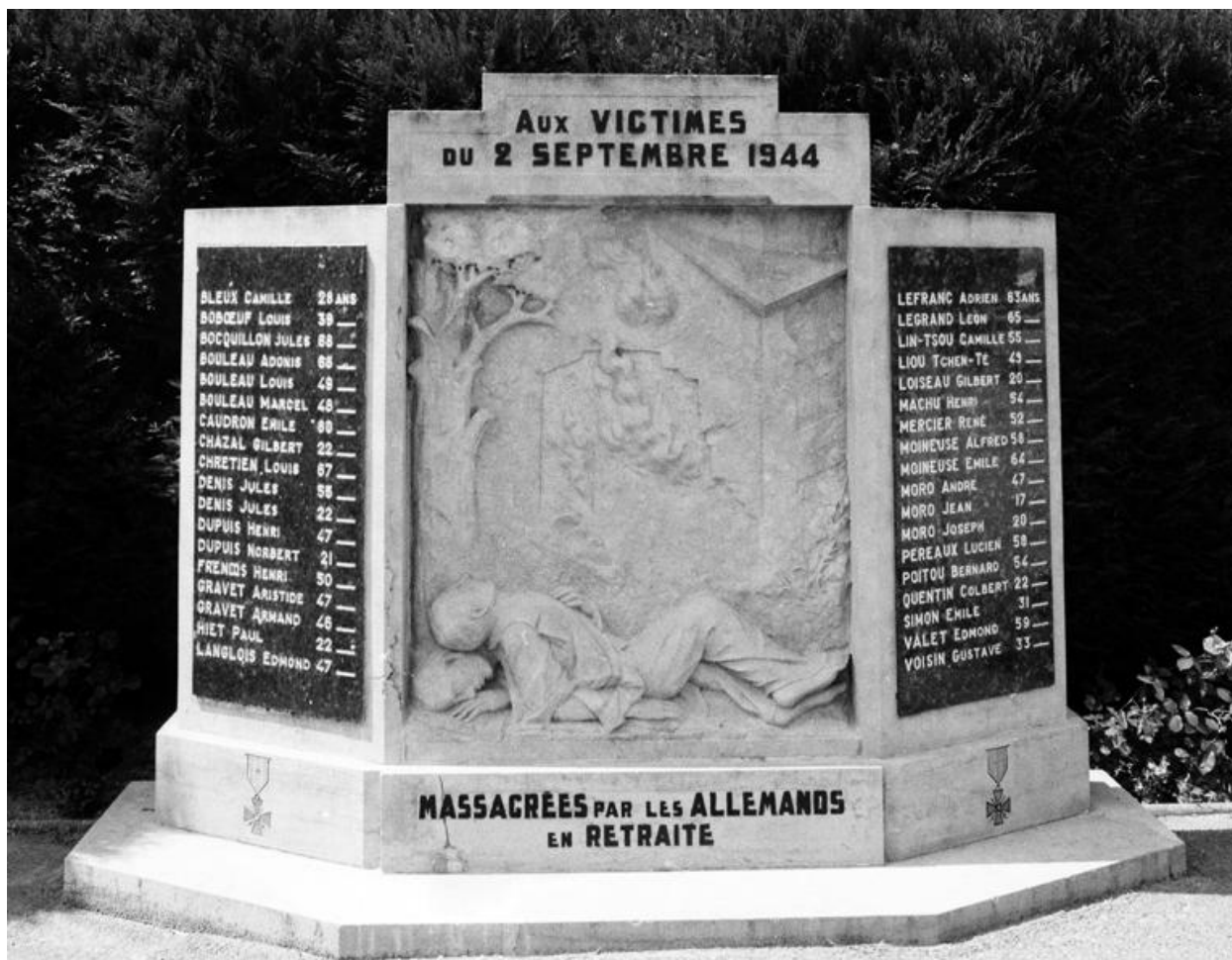
Vue d'ensemble du monument.