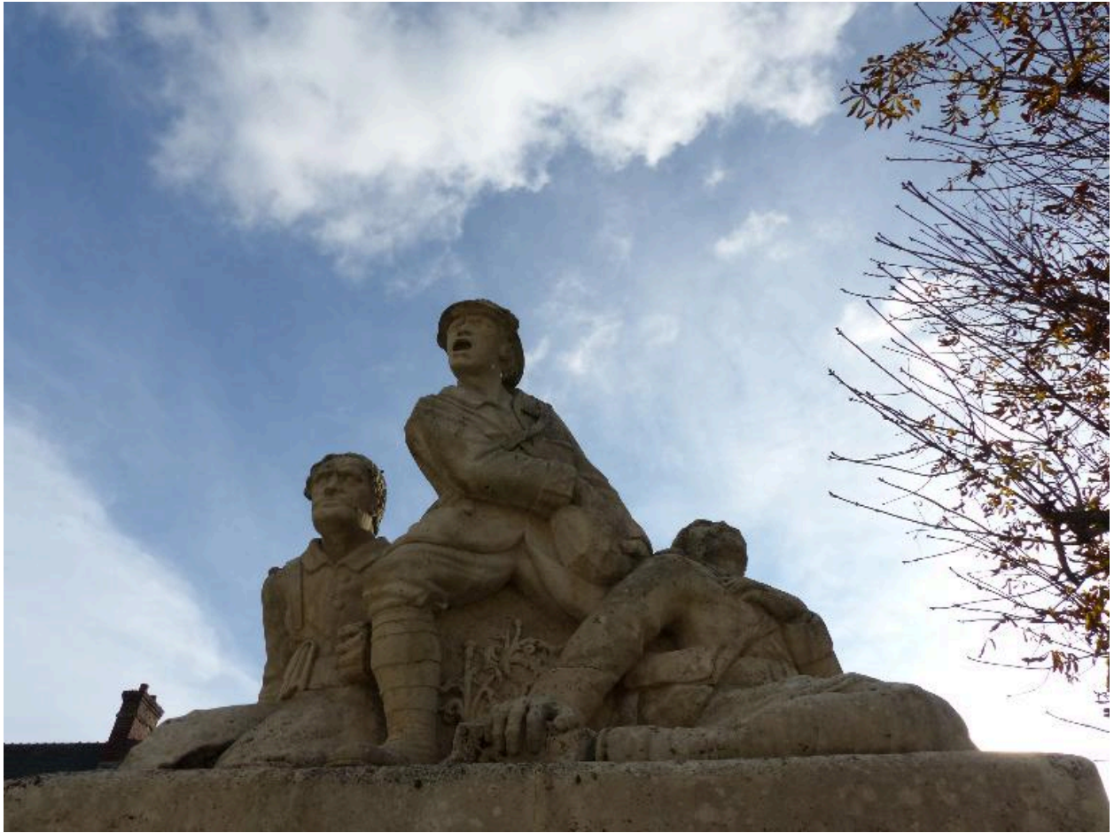
Vue du groupe sculpté.