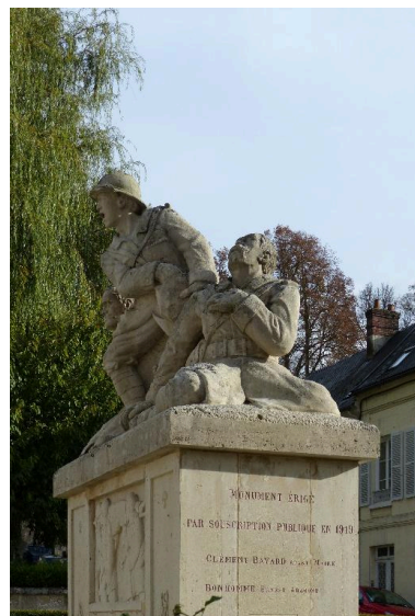
Vue du groupe sculpté, depuis l'ouest. IVR32_20166005011NUCA