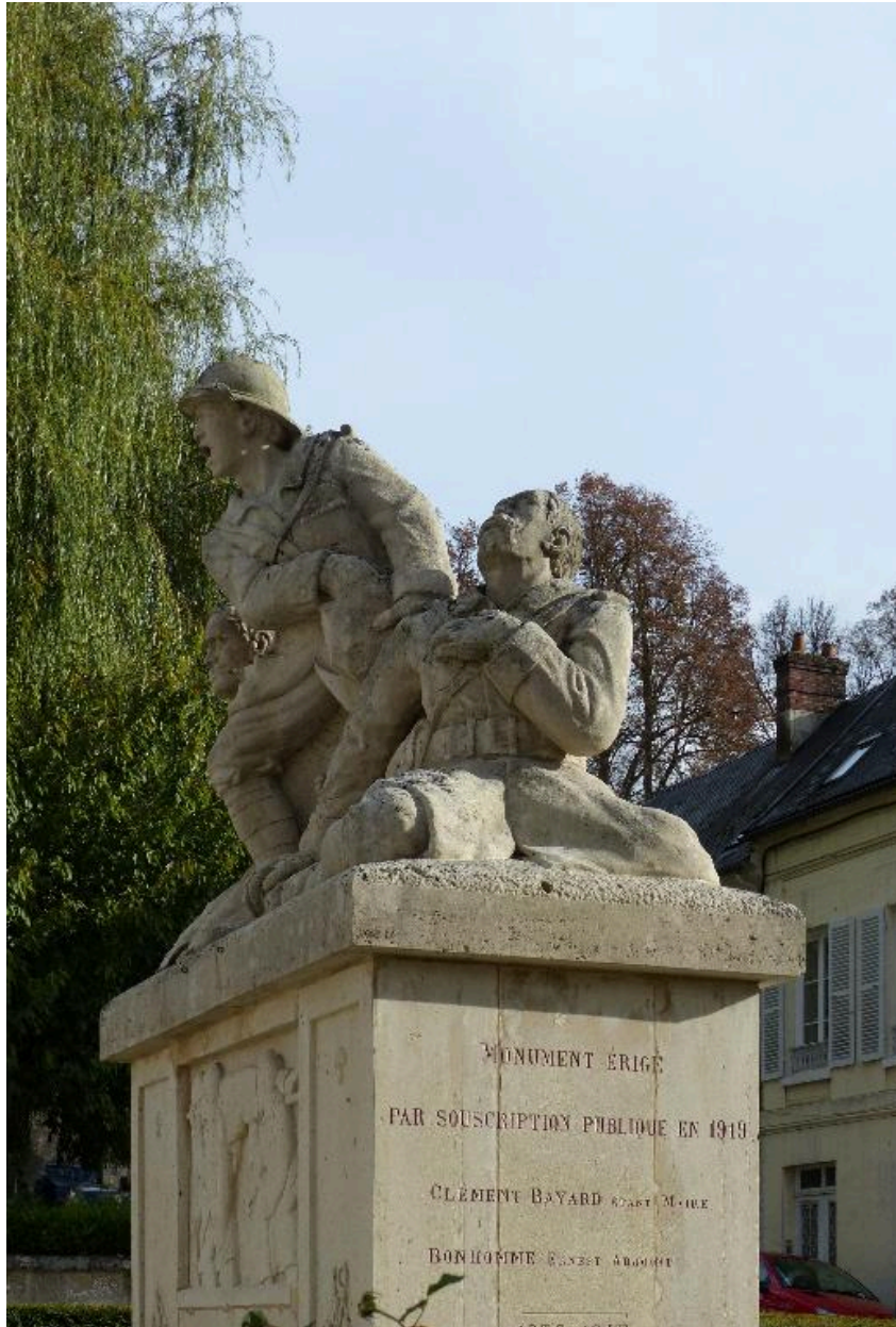
Vue du groupe sculpté, depuis l'ouest.