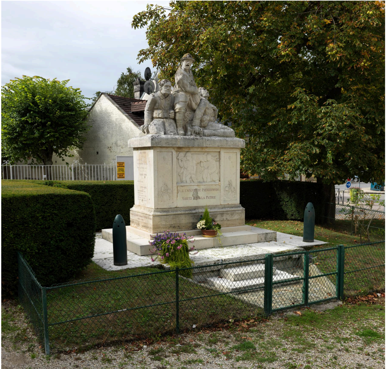
Vue depuis l'est.