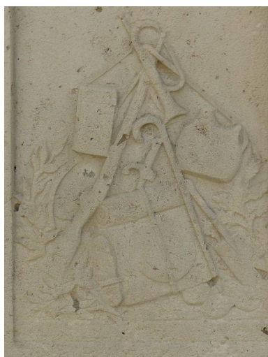
Bas-relief.