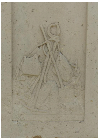
Bas-relief. IVR32_20166005017NUCA