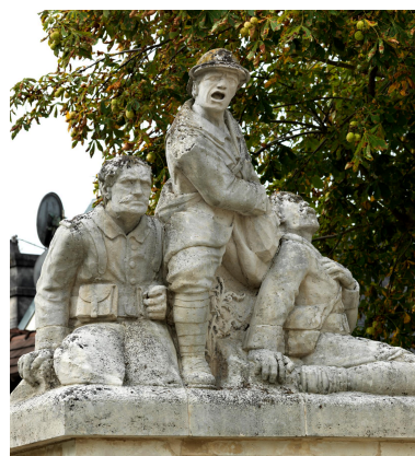
Statue aux trois poilus. IVR32_20206000097NUC2A