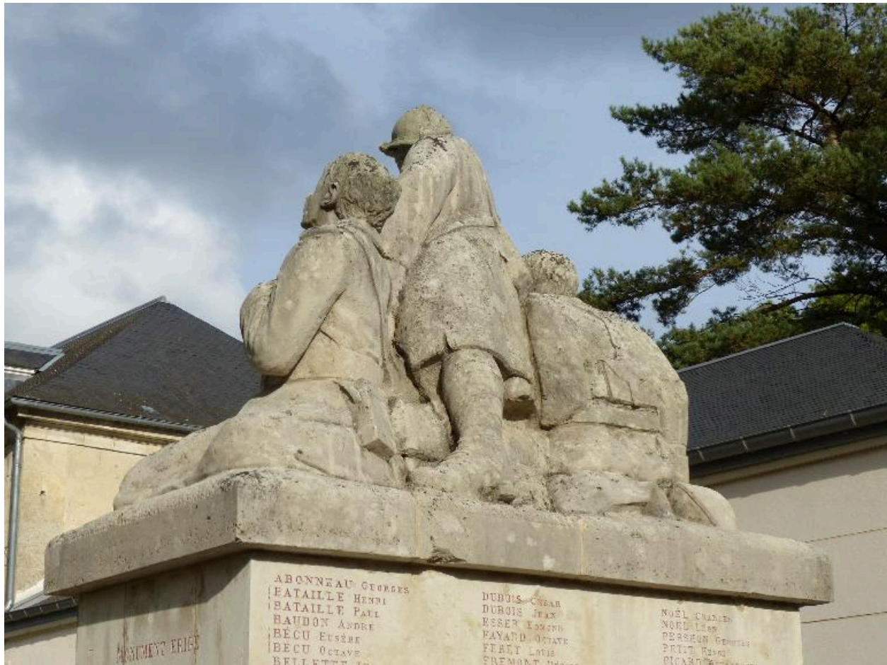
Vue du groupe sculpté, depuis le sud-ouest.