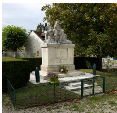
Vue depuis l'est. IVR32_20206000095NUC2A