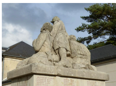
Vue du groupe sculpté, depuis le sud-ouest. IVR32_20166005013NUCA