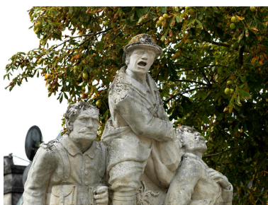
Détail du poilu criant.