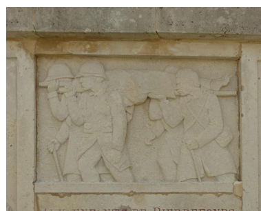
Vue de détail sur le bas-relief de la face antérieure du piédestal.