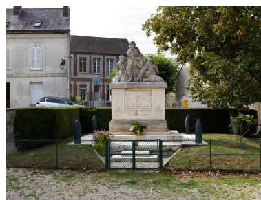
Vue depuis le square.