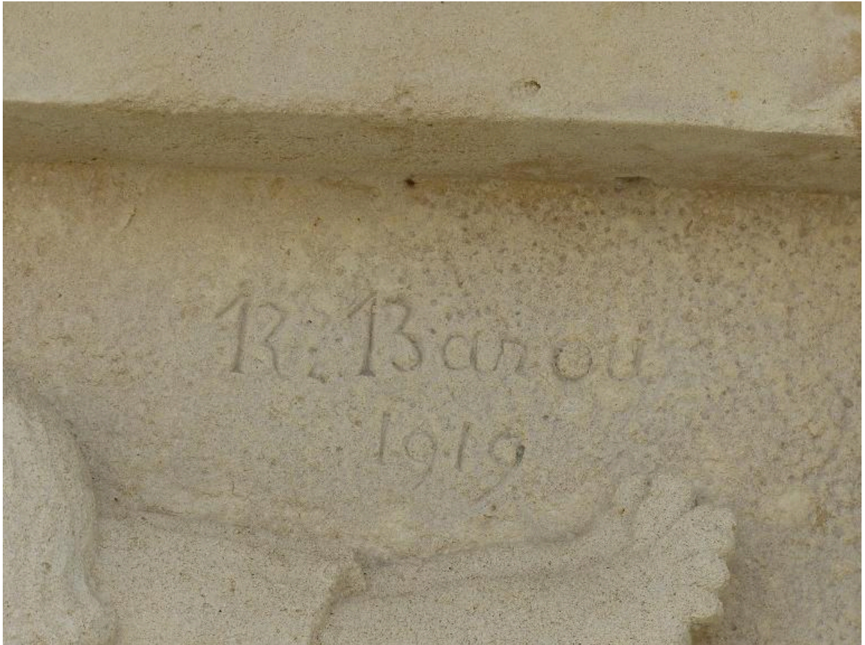
Vue de détail sur la signature et la date.