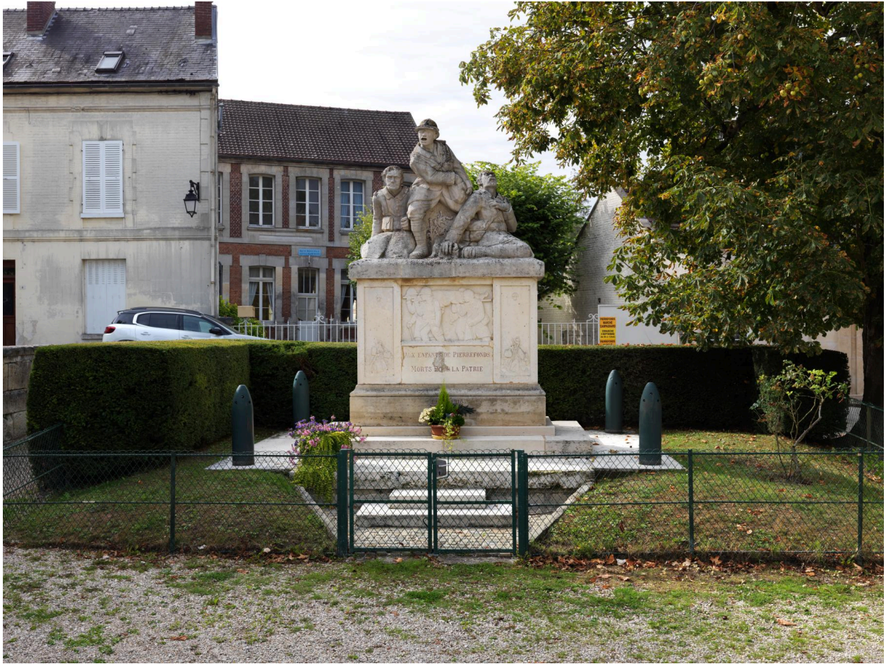
Vue depuis le square.