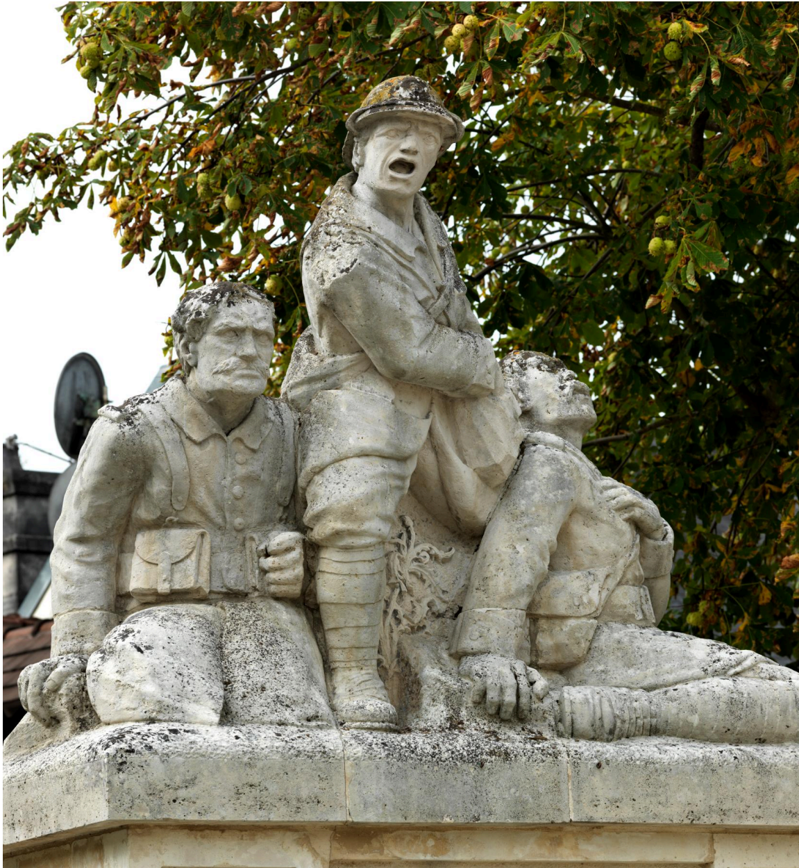
Statue aux trois poilus.