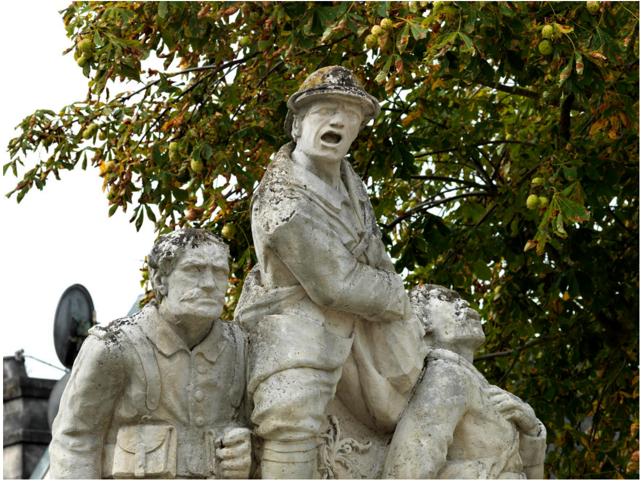
Détail du poilu criant.