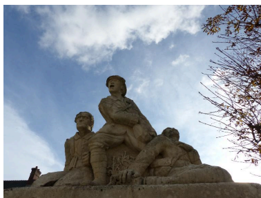
Vue du groupe sculpté.