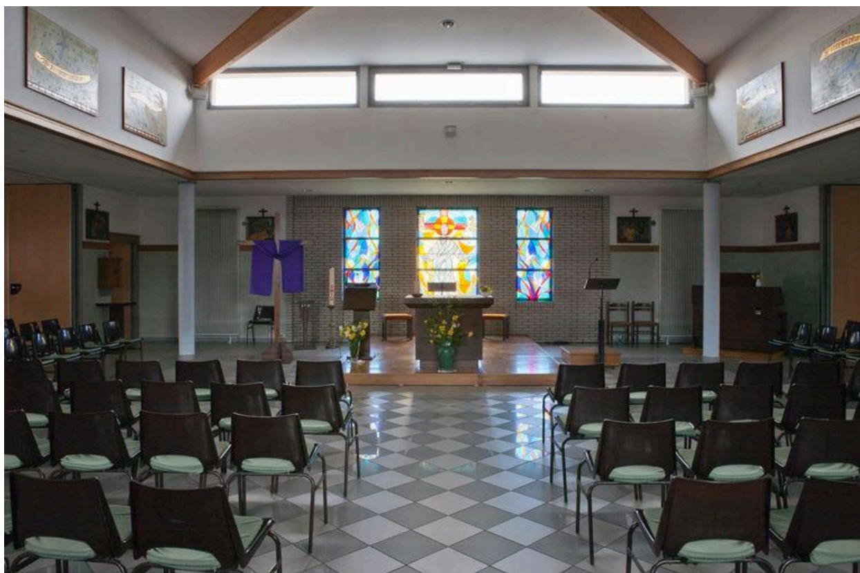
Vue générale vers le chœur.