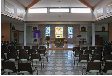
Vue générale vers le chœur.