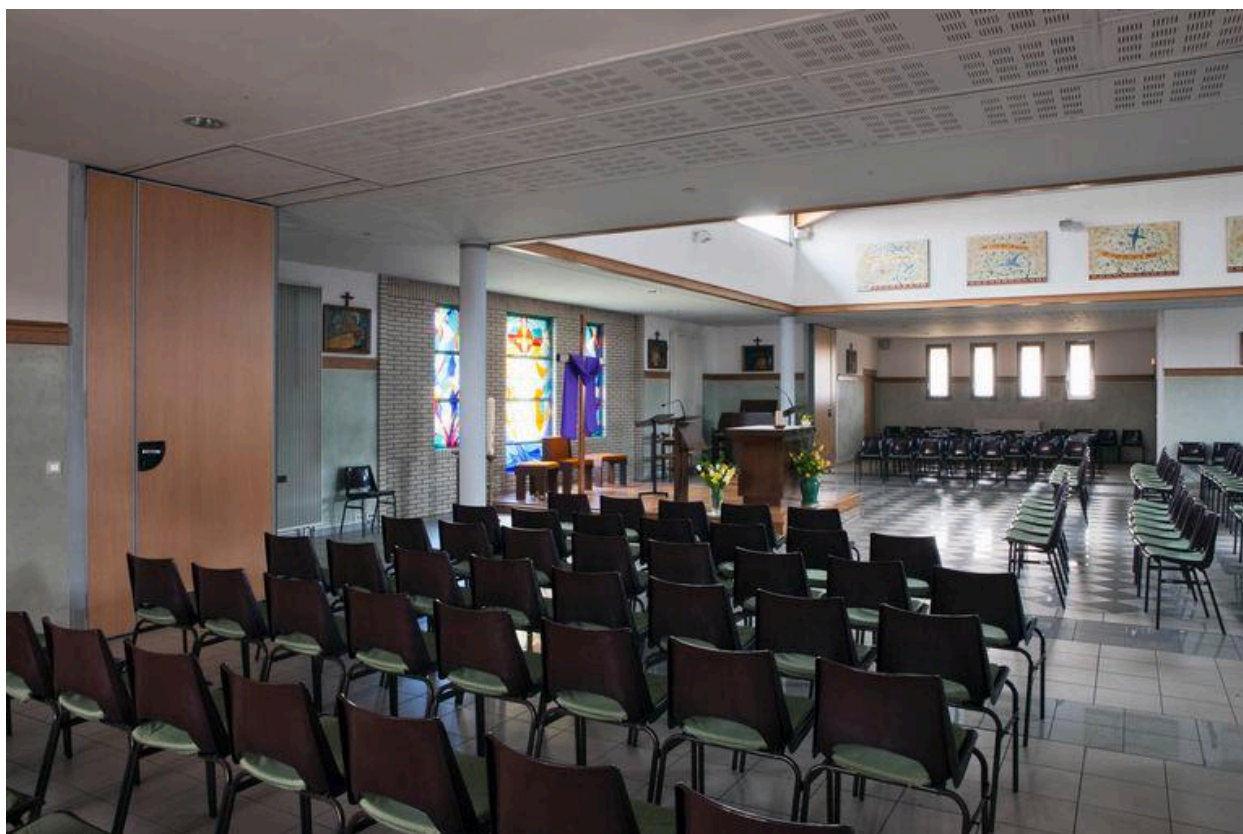
Vue de trois quart vers le chœur.