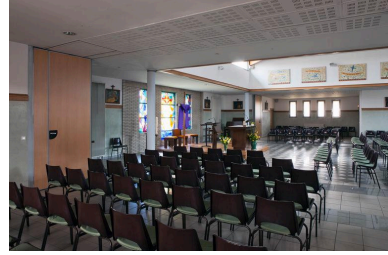
Vue de trois quart vers le chœur. IVR31_20145903144NUCA