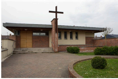
Vue générale. IVR31_20145903142NUCA