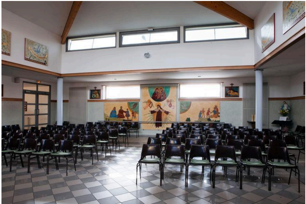
Vue générale depuis le chœur.