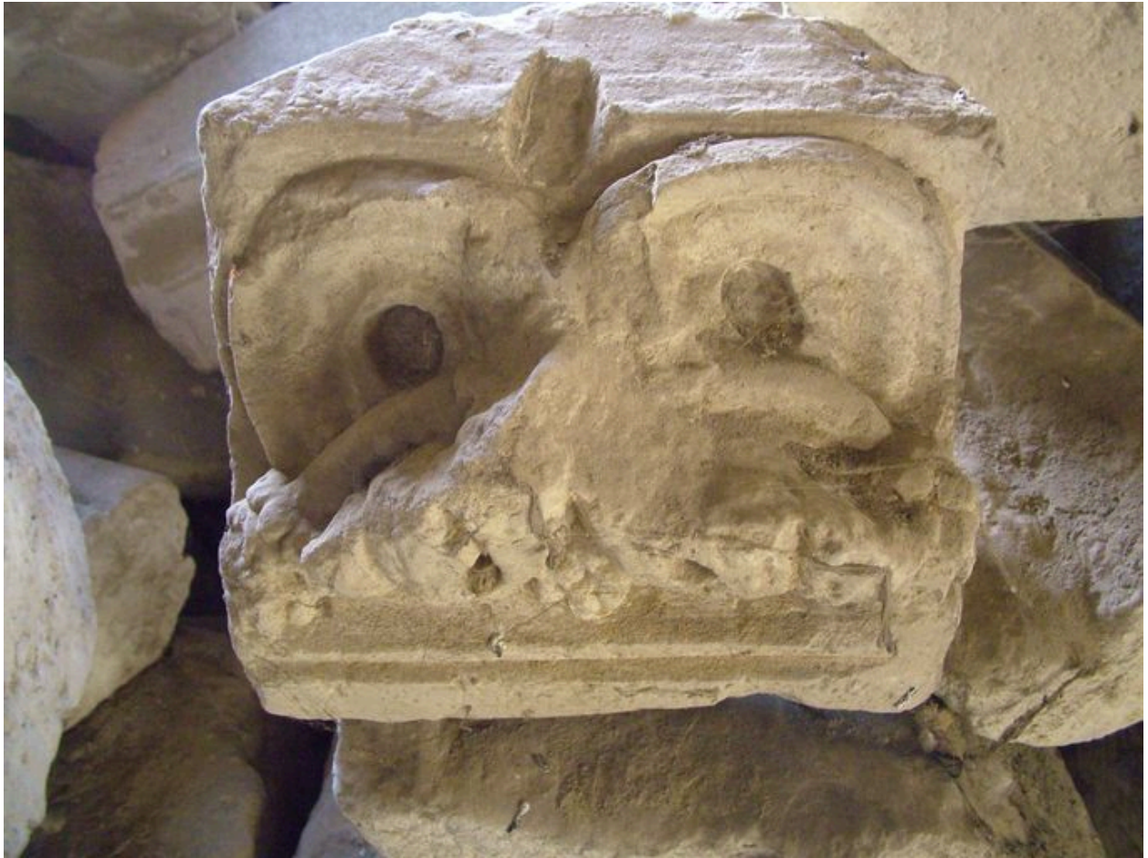
Elément du dépôt lapidaire.