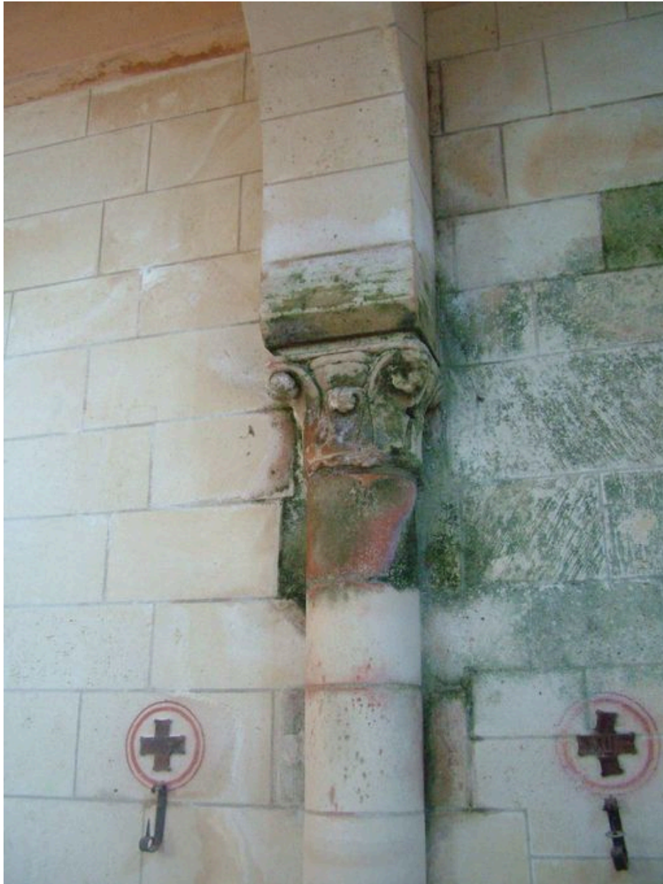
Vue d'un chapiteau du 13e siècle.