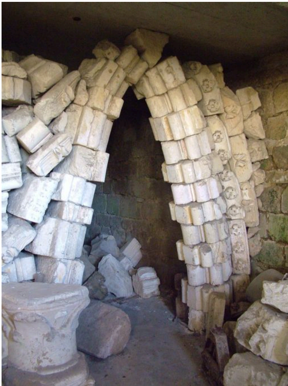
Vue d'une partie du dépôt lapidaire présent dans la crypte.