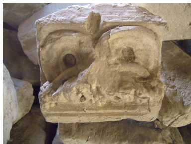
Élément du dépôt lapidaire.