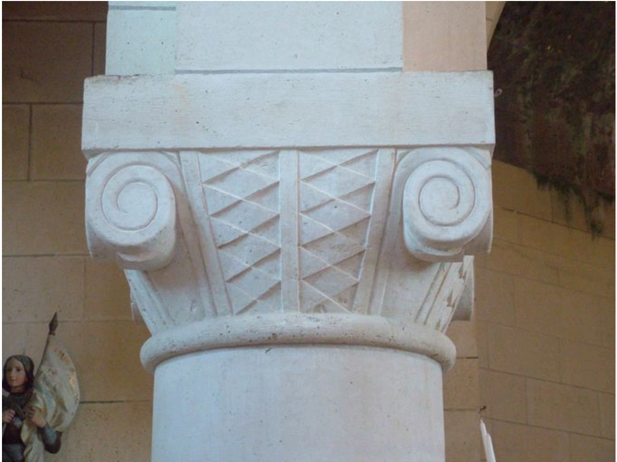
Vue d'un chapiteau de la nef.