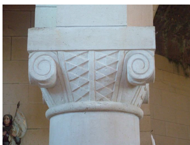
Vue d'un chapiteau de la nef.