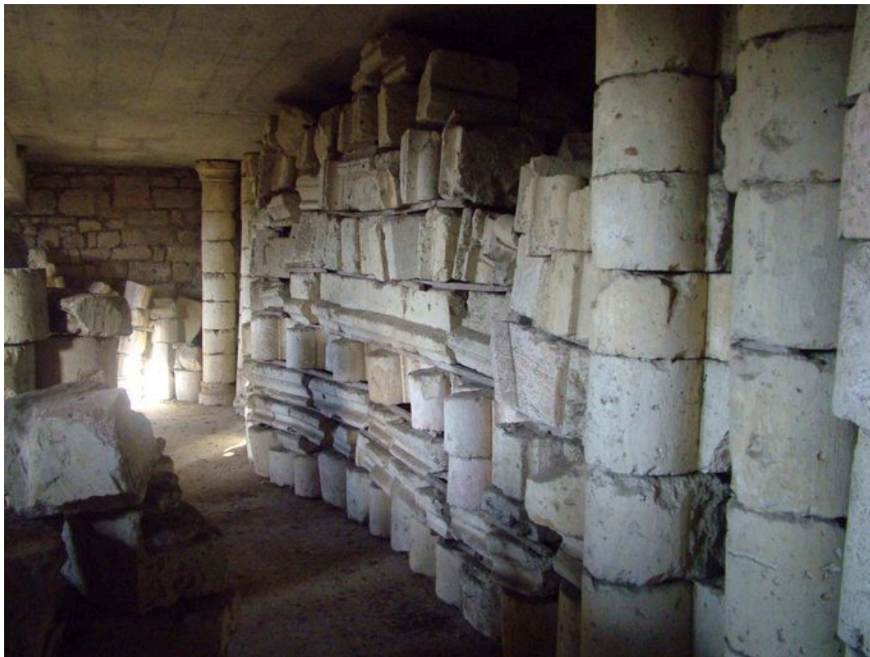
Vue d'une partie du dépôt lapidaire.