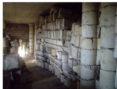
Vue d'une partie du dépôt lapidaire. IVR22_20050200342NUCA