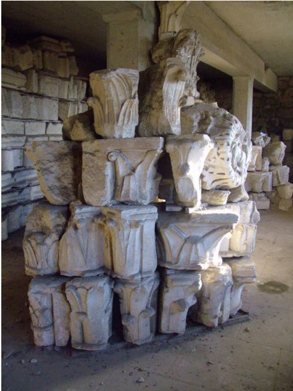
Vue d'une partie du dépôt lapidaire.