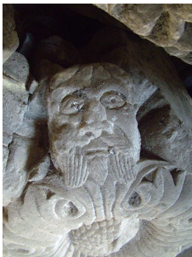
Vue d'un cul de lampe dans le dépôt lapidaire.