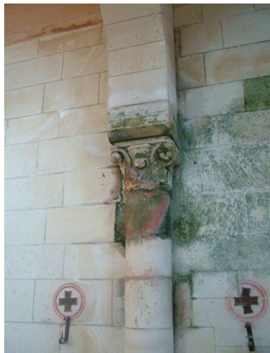
Vue d'un chapiteau du 13e siècle.