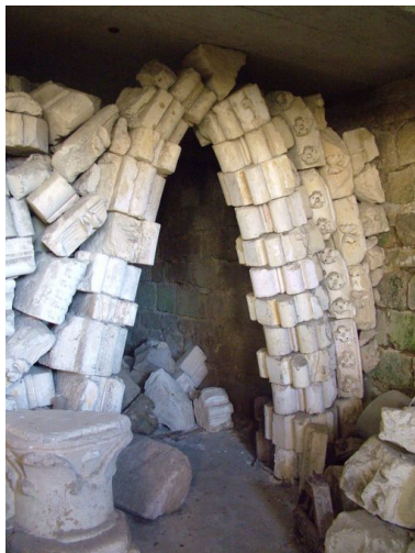
Vue d'une partie du dépôt lapidaire présent dans la crypte.