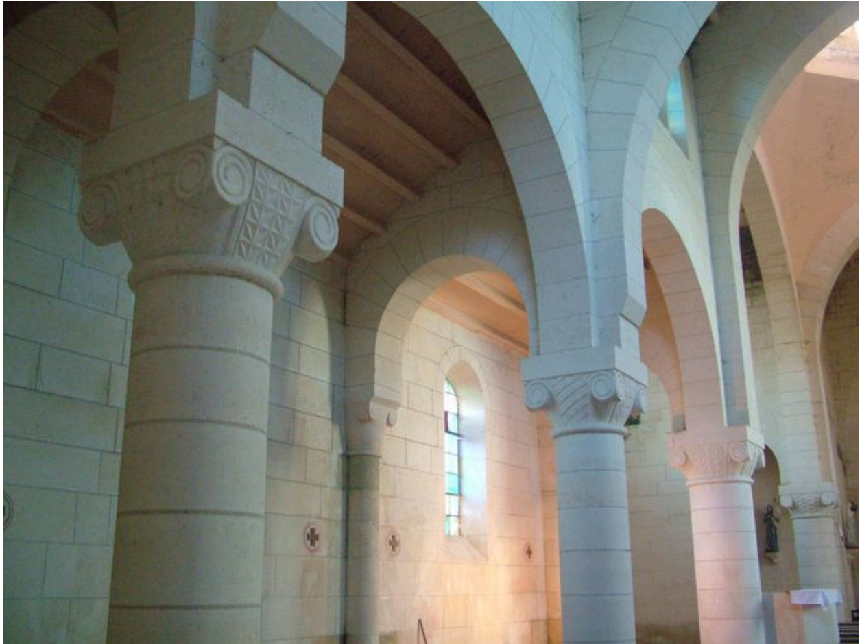
Vue des chapiteaux de la nef.