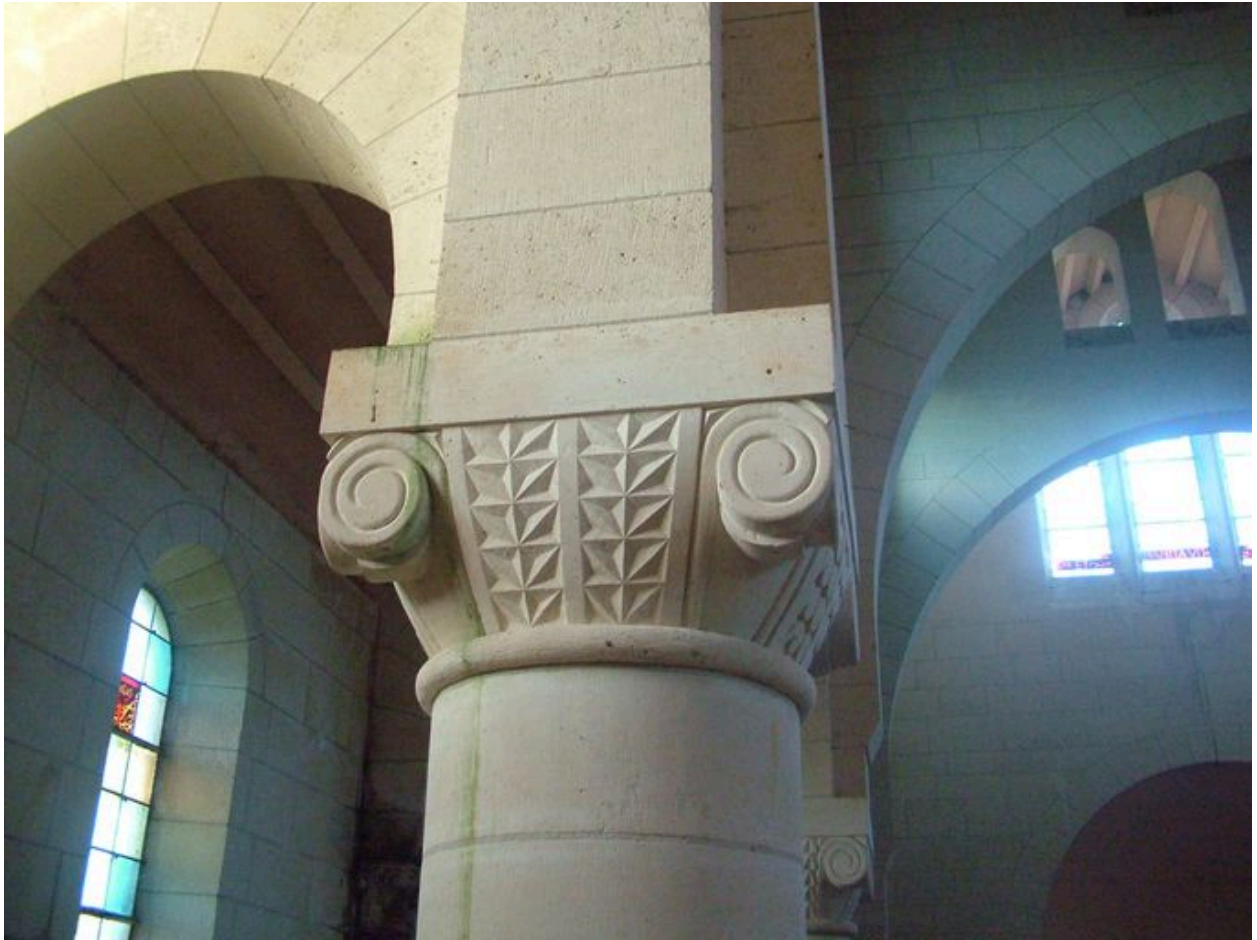
Vue d'un chapiteau de la nef.