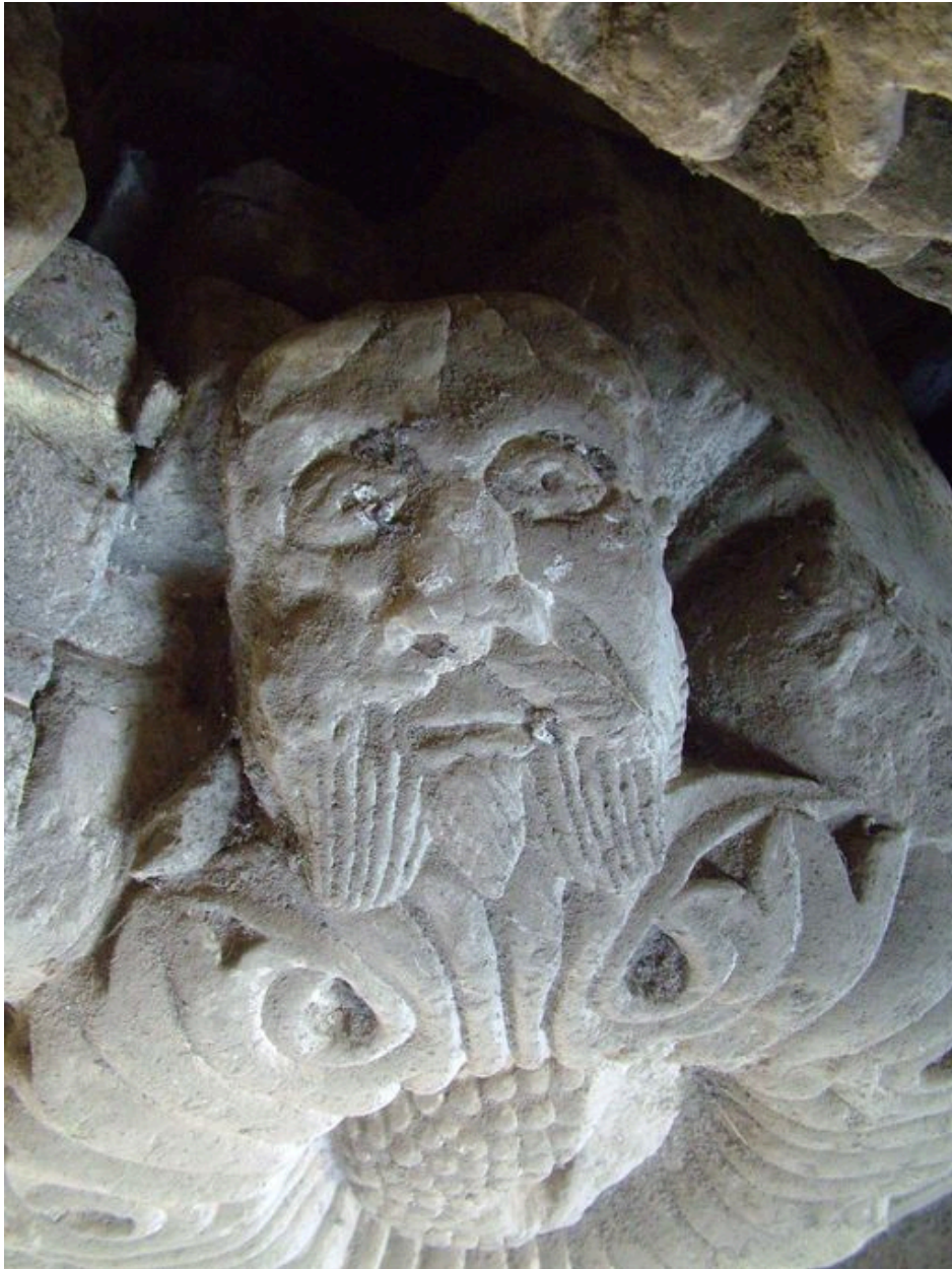
Vue d'un cul de lampe dans le dépôt lapidaire.