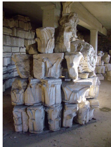
Vue d'une partie du dépôt lapidaire. IVR22_20050200343NUCA