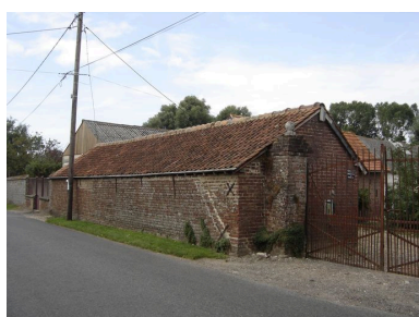
Vue des étables sur rue.