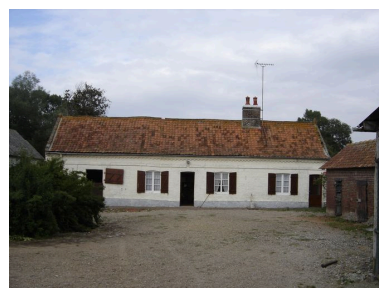
Vue du logis. IVR22_20068005074NUCA