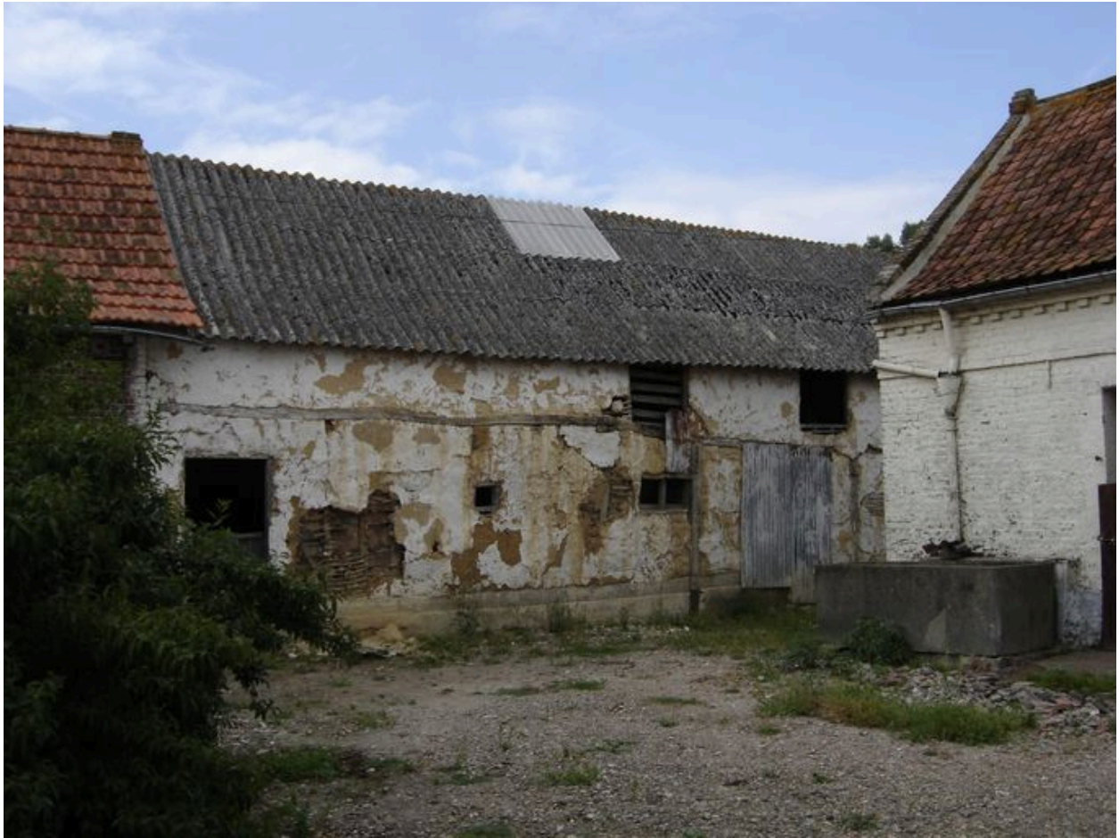
Vue de la grange.