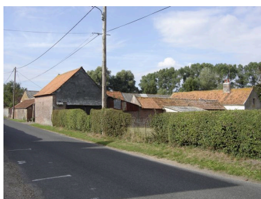
Vue générale. IVR22_20068005073NUCA

IVR22_20068005941XAB