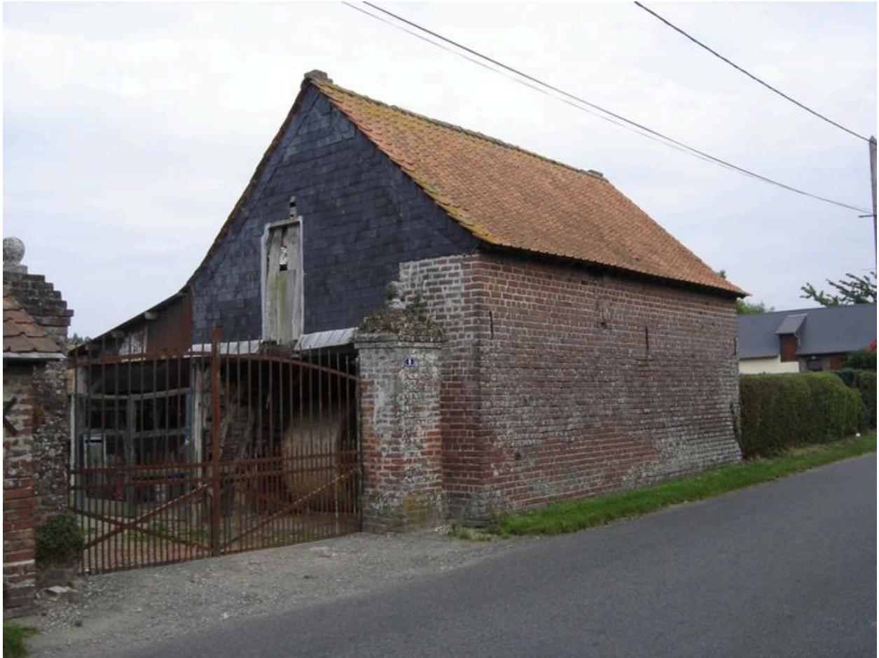
Vue de la charreterie sur rue.