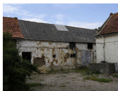
Vue de la grange.