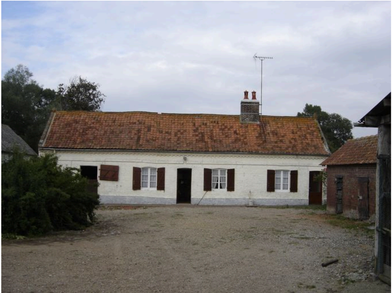
Vue du logis.