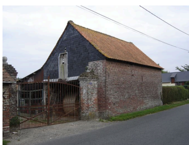
Vue de la charreterie sur rue. IVR22_20068005076NUCA