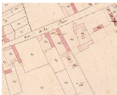
Extrait du cadastre napoléonien présentant le plan de la ferme en 1832.

IVR22_20068005941XAB