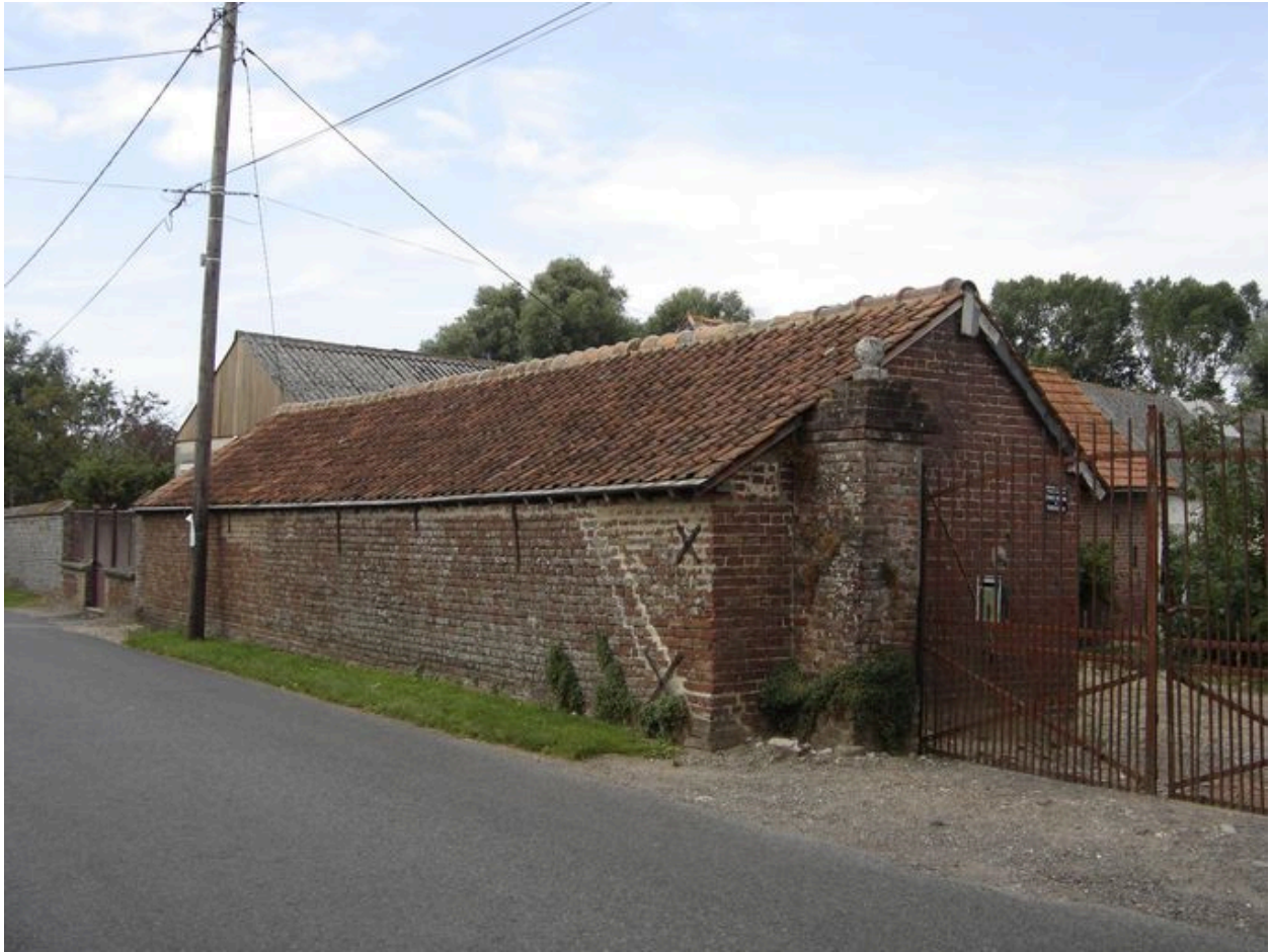
Vue des étables sur rue.