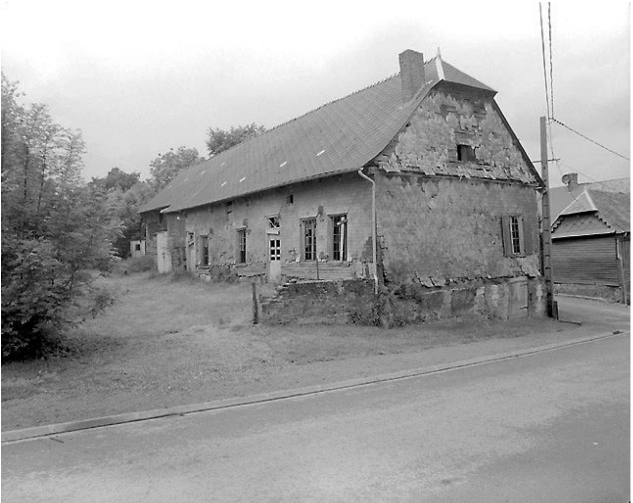
Vue du logis depuis la rue.