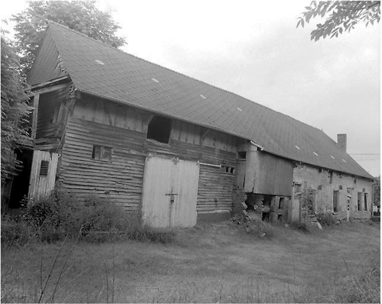
Vue de l'étable à vaches attenante au logis.