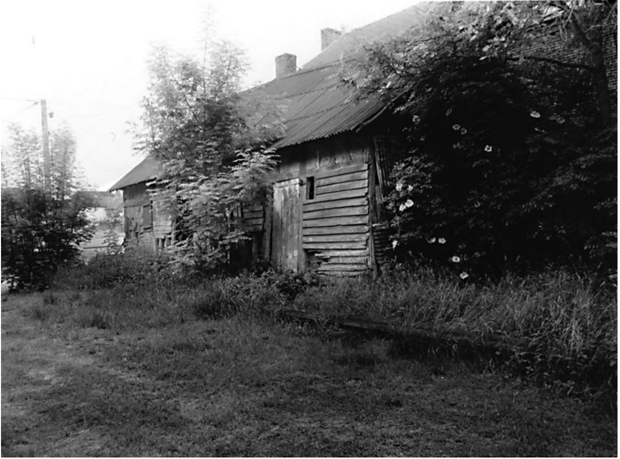
Vue de l'étable et de la forge.