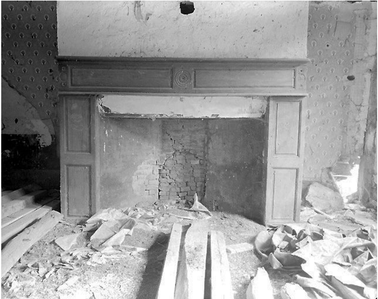
Vue de la cheminée de la pièce principale du logis portant la date 1820.