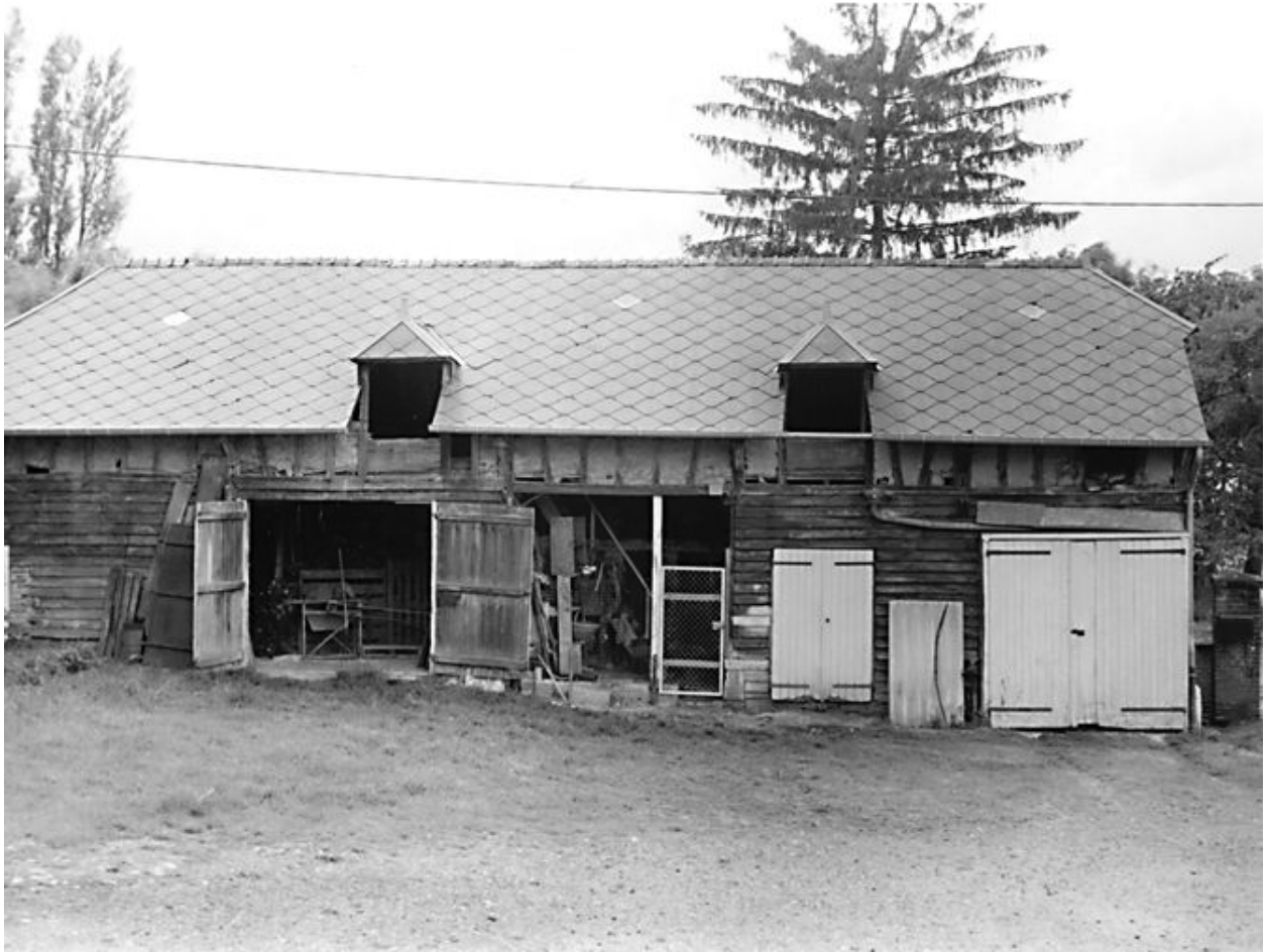
Vue de l'étable et de la forge.