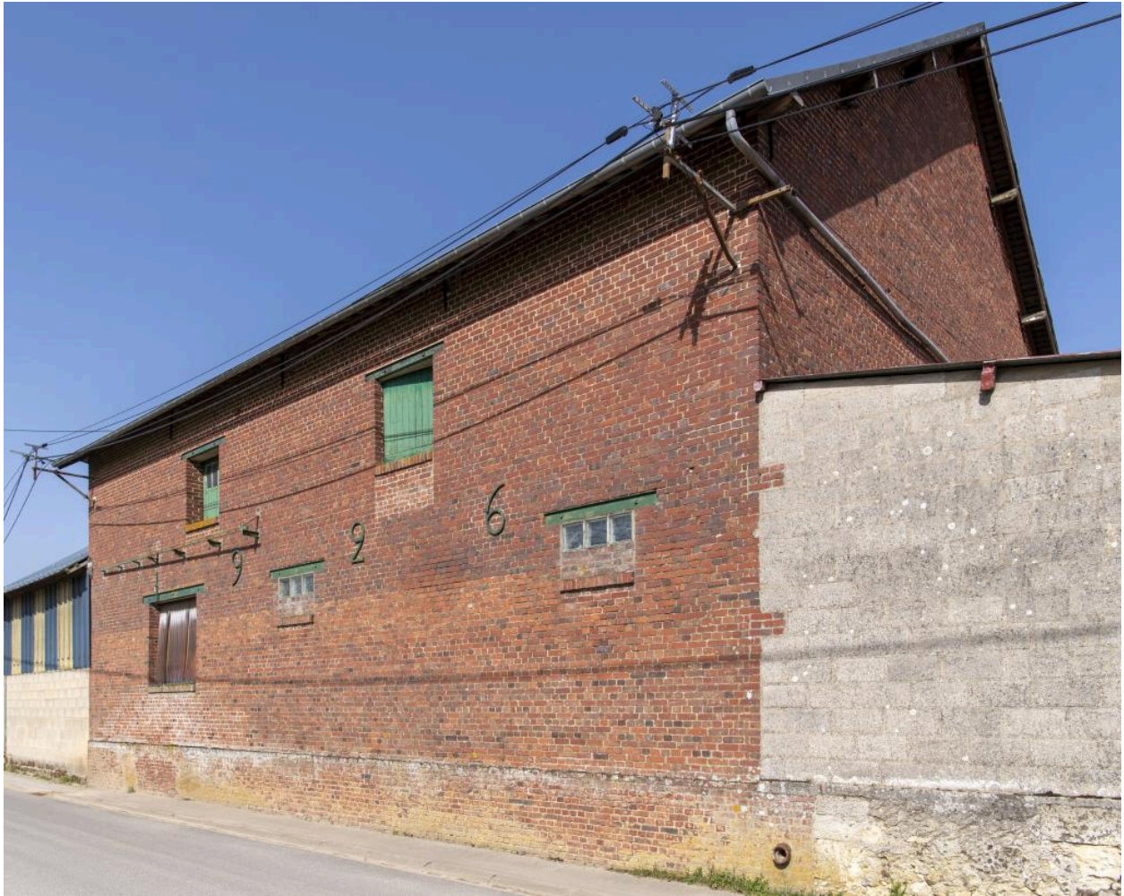
Anciennes étables avec fenil reconstruites en 1926, ferme au n°8 rue du Chauffour, vue depuis le sud-ouest.