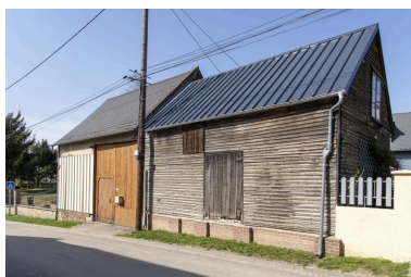
Granges alignées sur la rue des n°3 et 5 rue de Saint-Pierre, vue depuis le sud.