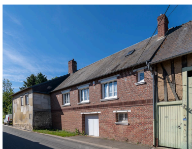
Maison datée de 1955 (date portée sur la façade), n°28 rue des Fresnes, vue depuis l'est.