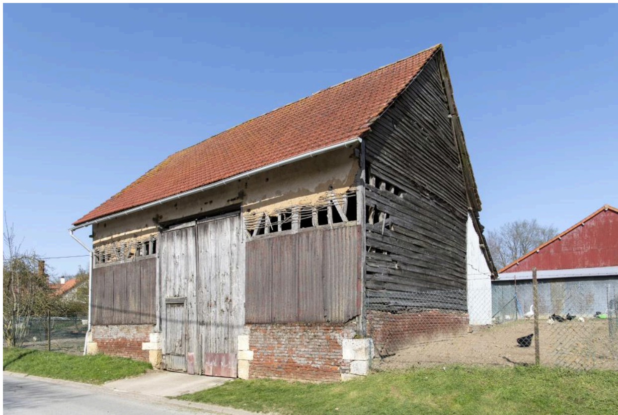
Ancienne grange sur rue, n°10 rue du Chauffour, vue depuis le sud-ouest.