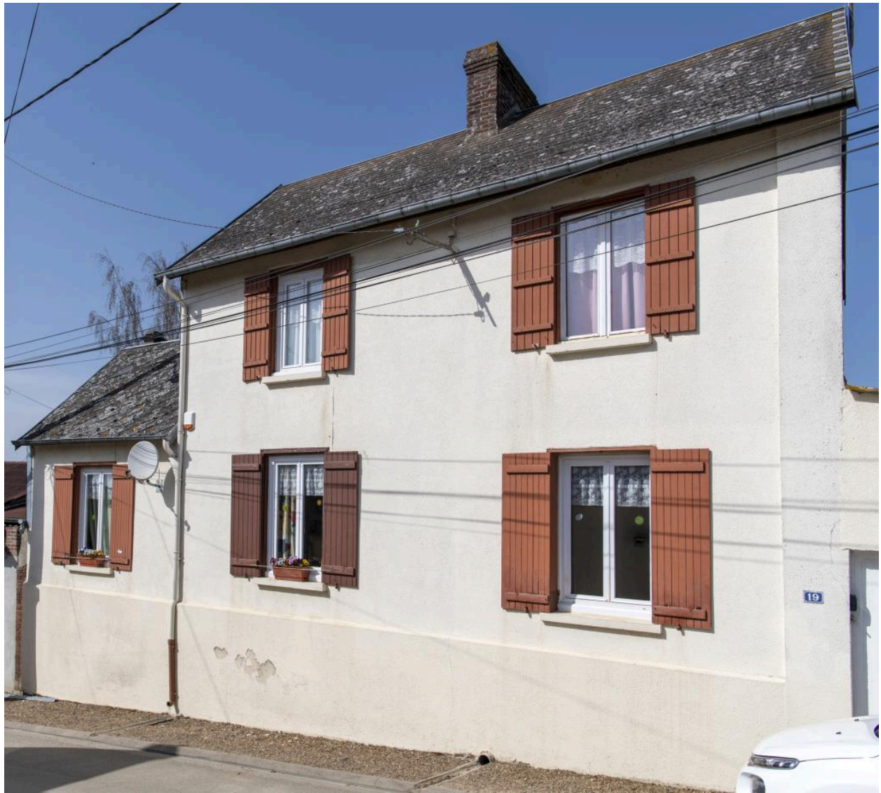
Ancien commerce (?) n°19 rue de Saint-Pierre, vue depuis le sud.