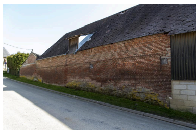
Bâtiments agricoles alignés sur la rue de la ferme au n°2 rue Saint-Pierre, vue depuis le nord. IVR32_20216000133NUCA