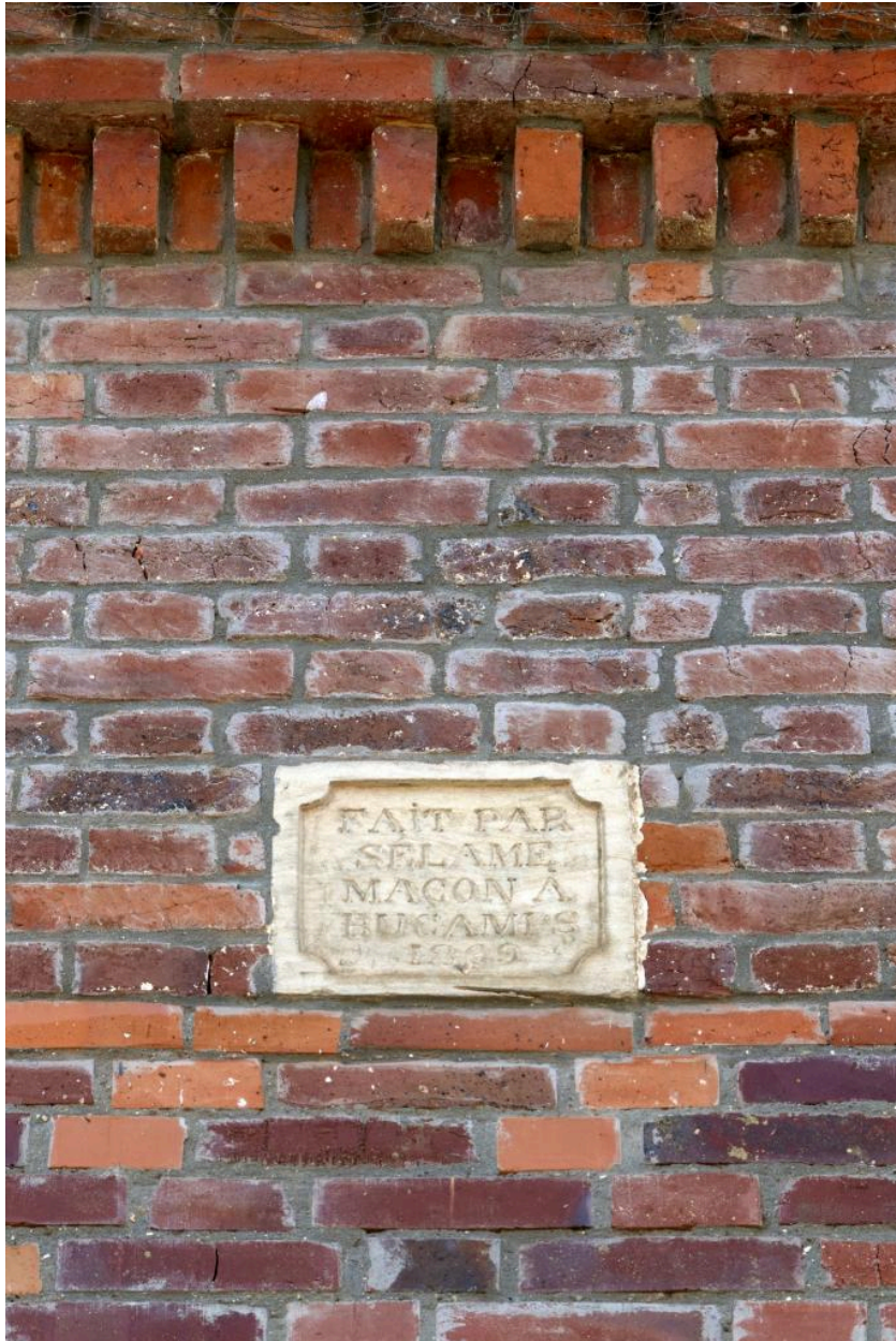
Détail de la signature du maçon, M. Sélame à Bucamps, pignon est du n°19 rue du Chauffour.