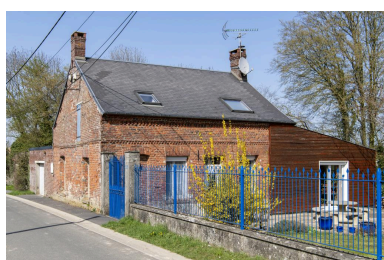
Maison, n°29 rue des Fresnes, vue depuis le sud. IVR32_20216000145NUCA