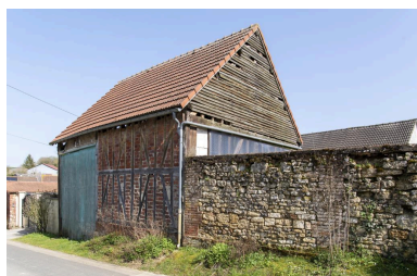
Ancienne grange alignée sur la rue, n°7 rue des Fresnes, vue depuis le nord-ouest. IVR32_20216000138NUCA