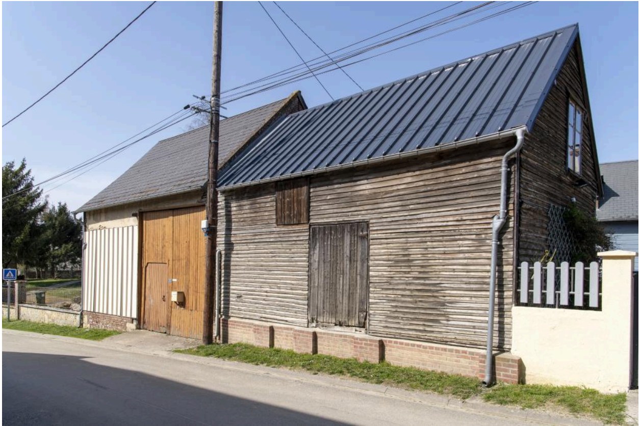
Granges alignées sur la rue des n°3 et 5 rue de Saint-Pierre, vue depuis le sud.