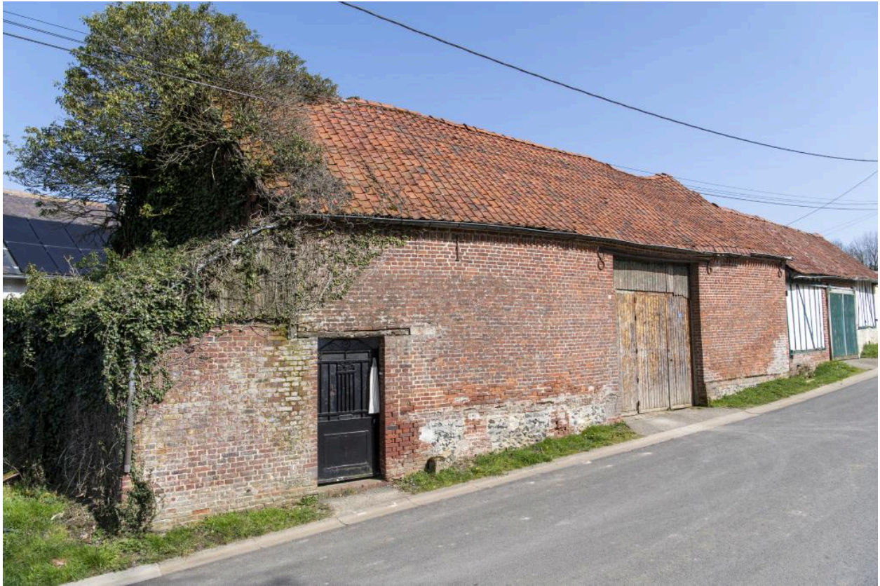
Ancienne grange sur rue reconstruite en 1868, n°13 rue des Fresnes, vue depuis le nord-ouest.