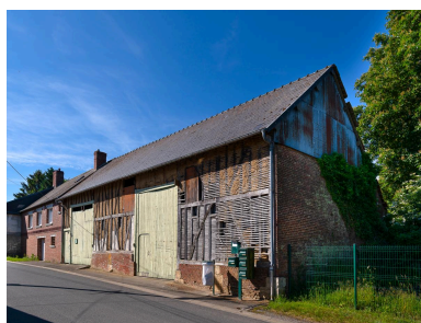
Ancienne grange sur rue, n°28 rue des Fresnes, vue depuis l'est. IVR32_20226000452NUCA