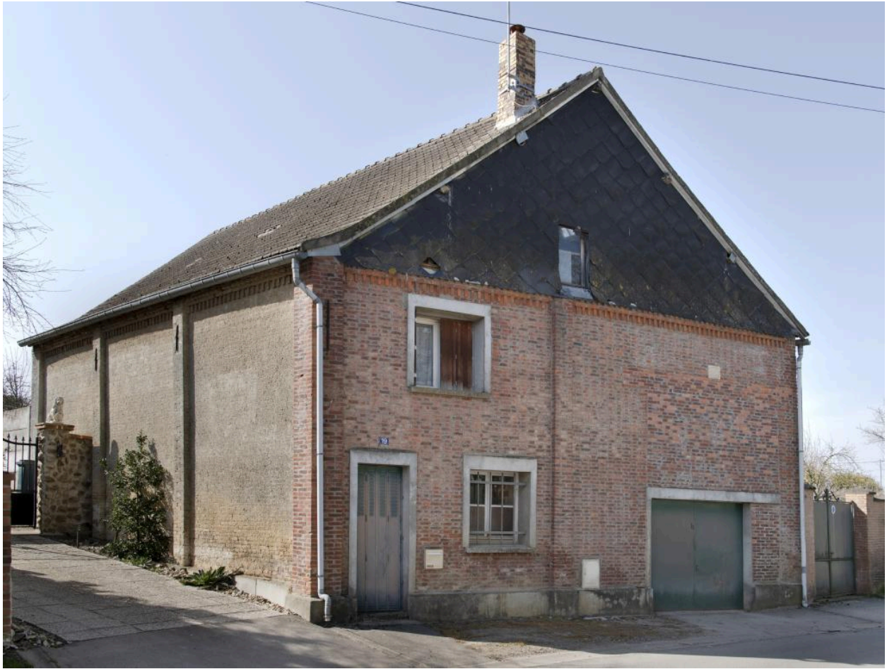
Ancienne grange aménagée en maison, construite en 1869, n°19 rue du Chauffour, vue depuis le sud-est.