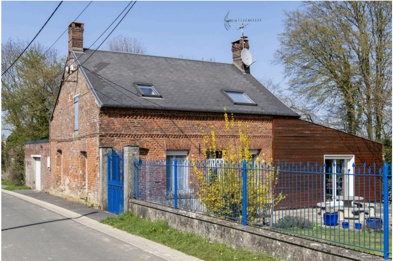
Maison, n°29 rue des Fresnes, vue depuis le sud.