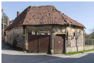
Anciennes entrée charretière et porte piétonne, n°12 rue du Chauffour, vue depuis le nord-ouest. IVR32_20216000153NUCA