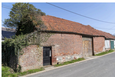
Ancienne grange sur rue reconstruite en 1868, n°13 rue des Fresnes, vue depuis le nord-ouest. IVR32_20216000140NUCA