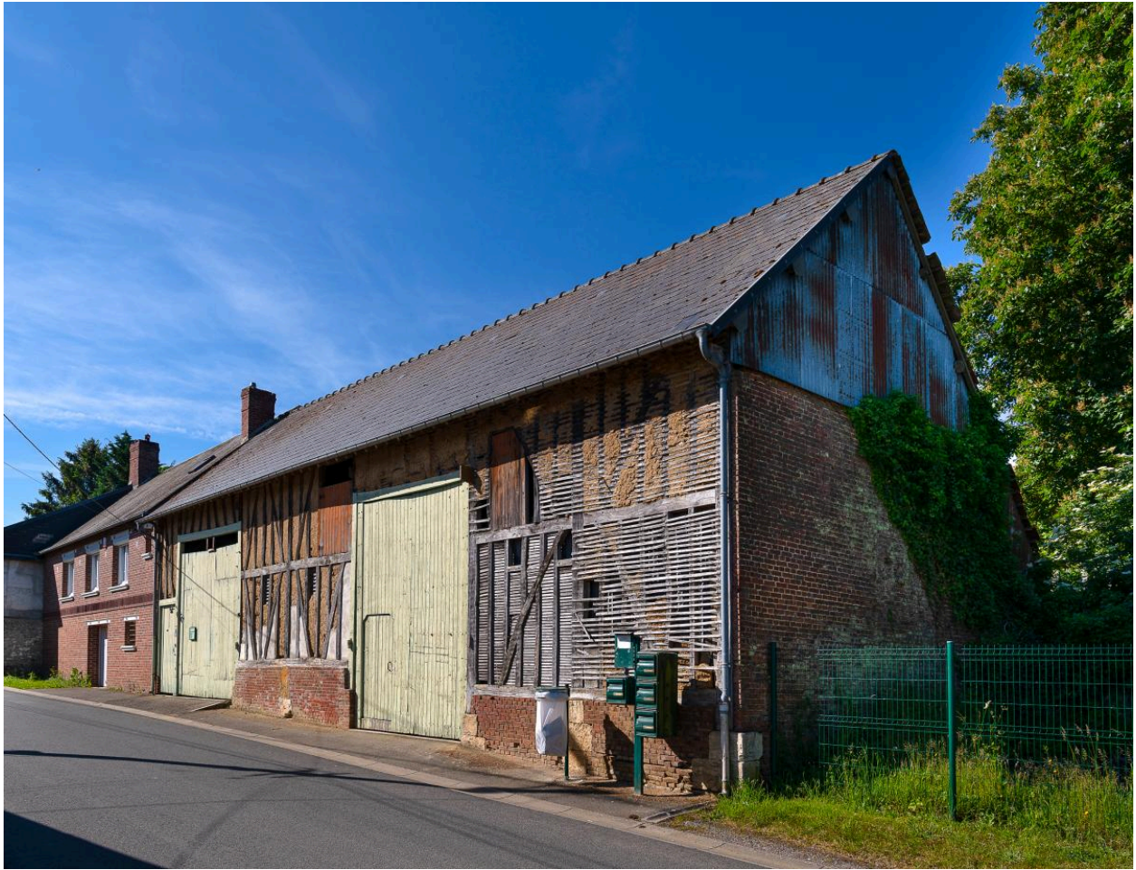
Ancienne grange sur rue, n°28 rue des Fresnes, vue depuis l'est.