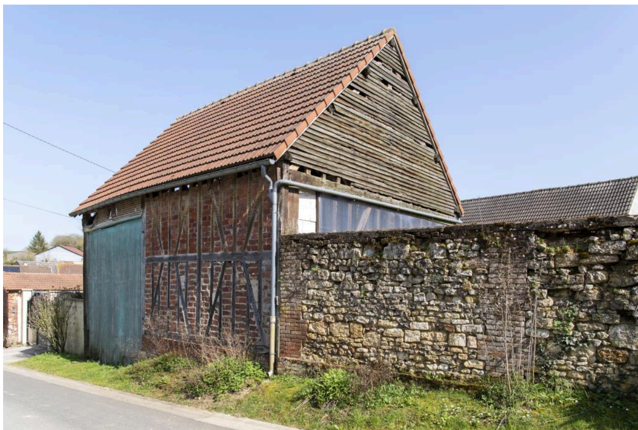
Ancienne grange alignée sur la rue, n°7 rue des Fresnes, vue depuis le nord-ouest.