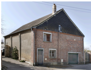
Ancienne grange aménagée en maison, construite en 1869, n°19 rue du Chauffour, vue depuis le sud-est. IVR32_20216000154NUCA