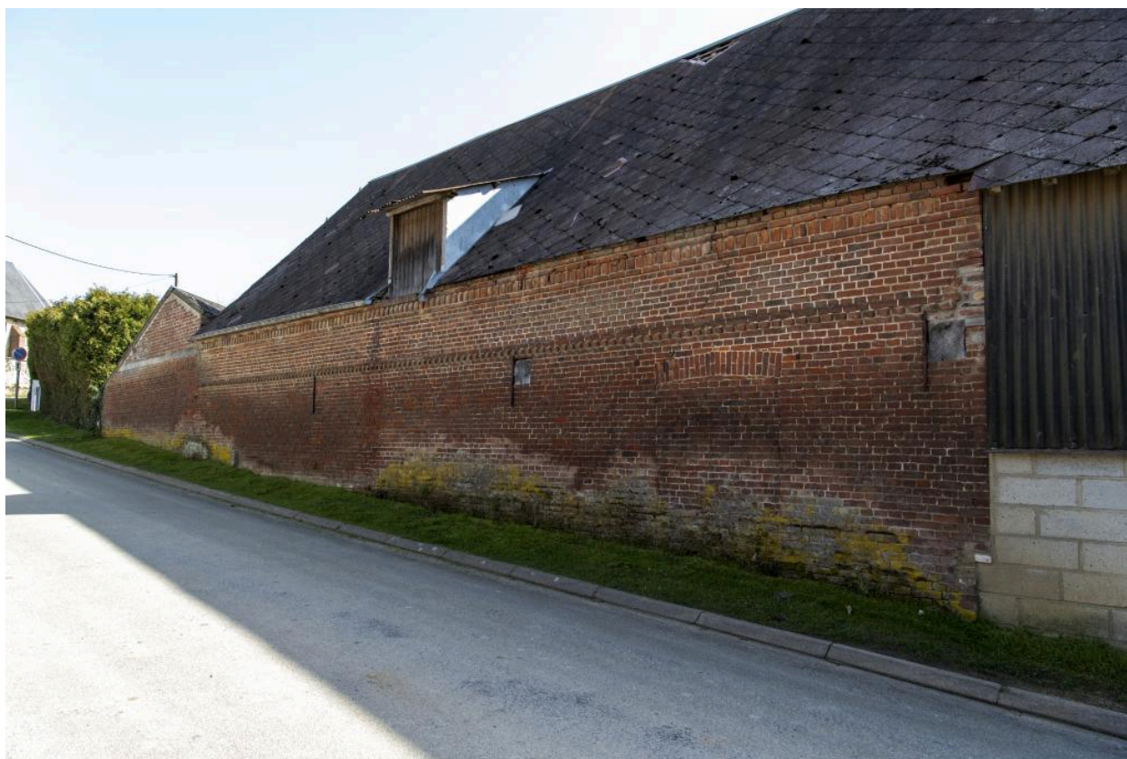
Bâtiments agricoles alignés sur la rue de la ferme au n°2 rue Saint-Pierre, vue depuis le nord.