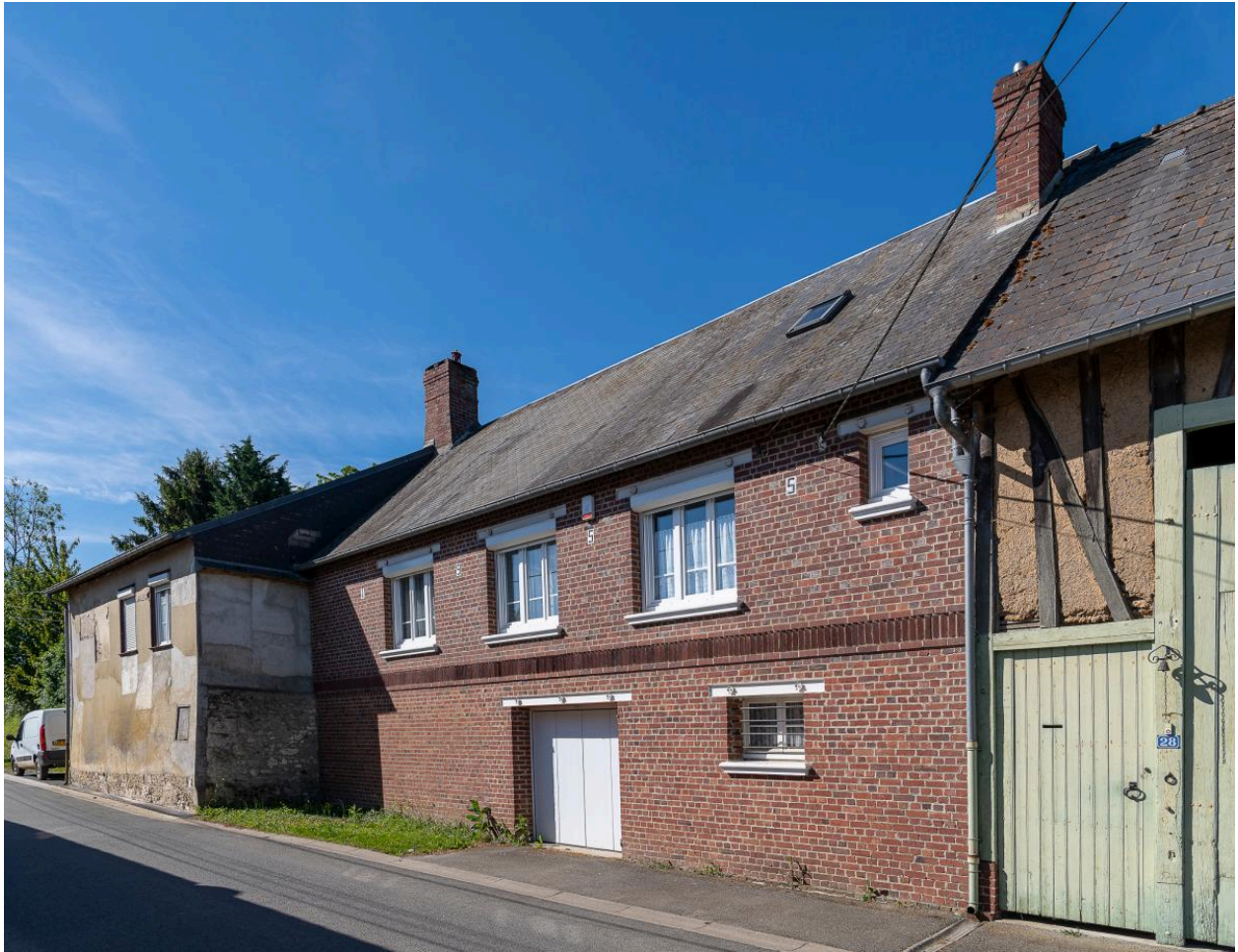
Maison datée de 1955 (date portée sur la façade), n°28 rue des Fresnes, vue depuis l'est.