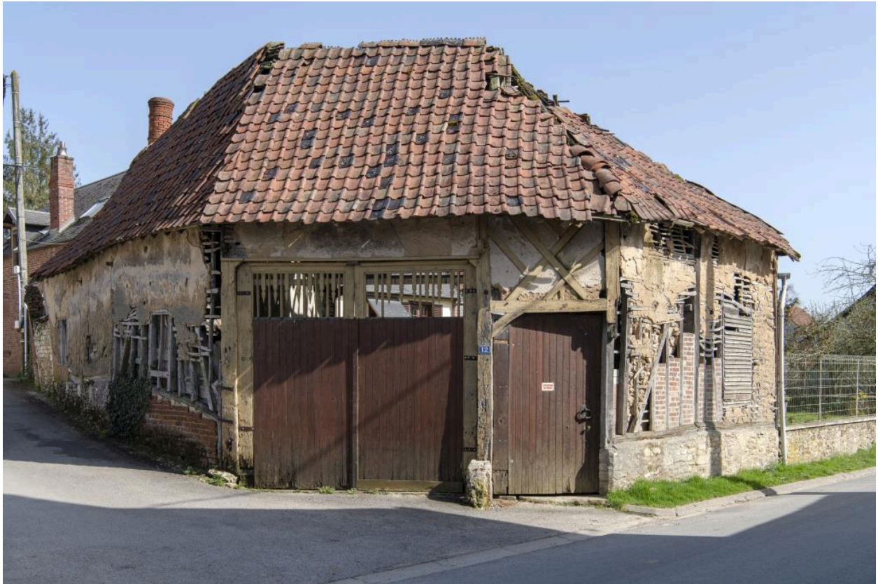
Anciennes entrée charretière et porte piétonne, n°12 rue du Chauffour, vue depuis le nord-ouest.