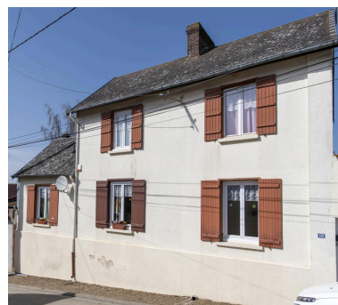
Ancien commerce (?) n°19 rue de Saint-Pierre, vue depuis le sud. IVR32_20216000132NUCA