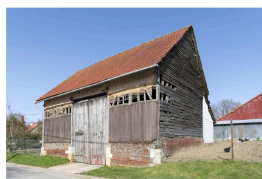
Ancienne grange sur rue, n°10 rue du Chauffour, vue depuis le sud-ouest. IVR32_20216000150NUCA