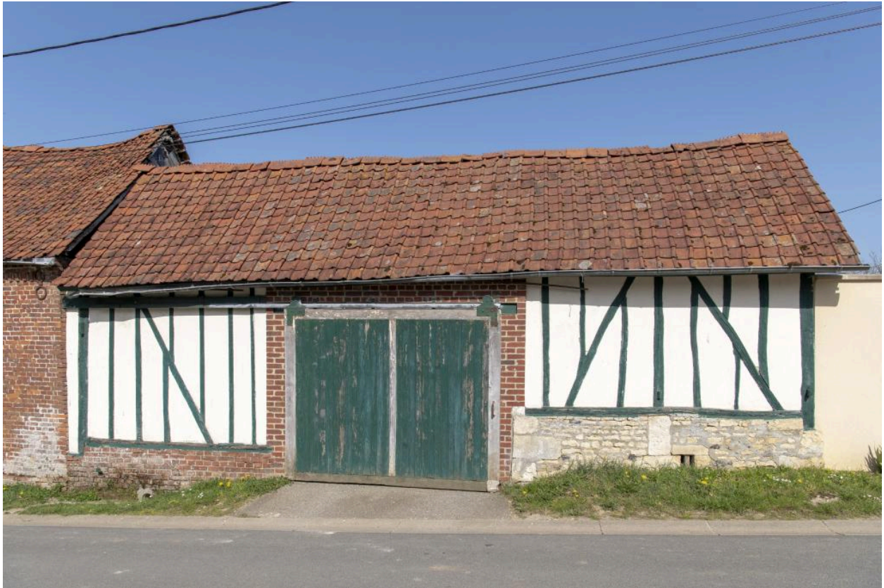
Ancienne grange sur rue remaniée, n°15 rue des Fresnes, vue depuis le sud-ouest.