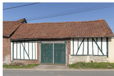
Ancienne grange sur rue remaniée, n°15 rue des Fresnes, vue depuis le sud-ouest.