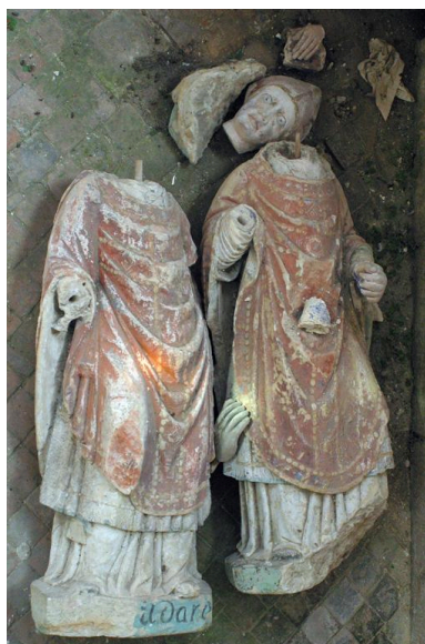
Vue d'ensemble des statues.