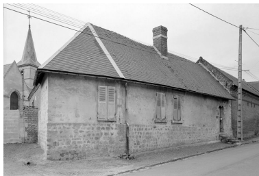
Vue générale depuis la rue.