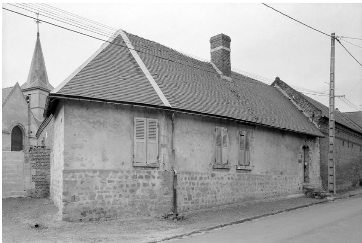
Vue générale depuis la rue.