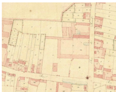
La ferme sur le plan cadastral de 1836 (AD Somme ; 3P 1943/5).

Phot. Archives départementales de la Somme IVR32_20188005020NUC2A