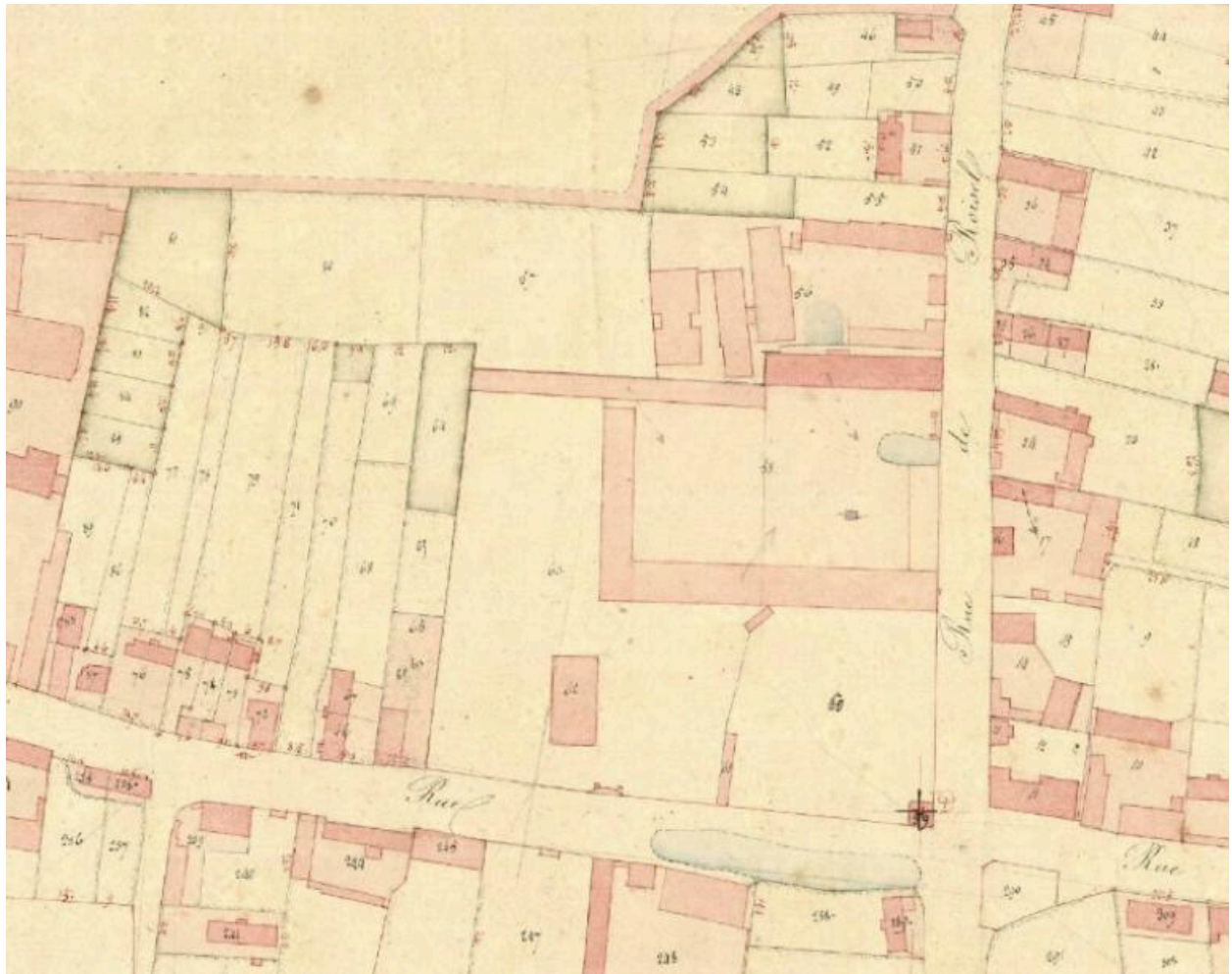
La ferme sur le plan cadastral de 1836 (AD Somme ; 3P 1943/5).