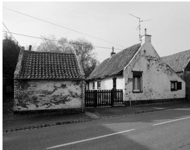
Vue générale. IVR31_20045900676X