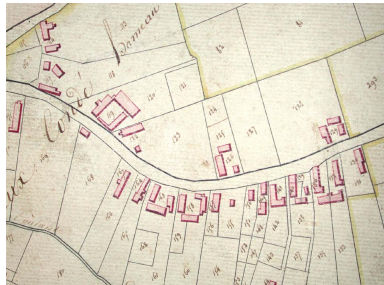
Plan de situation. Cadastre de 1818 (AD Nord. Série P31/169).