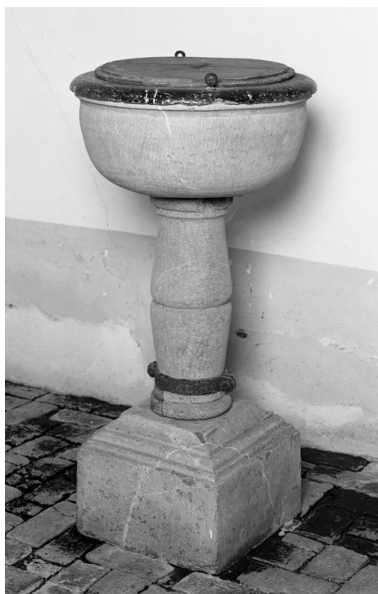
Les fonts baptismaux. IVR22_19930200764X