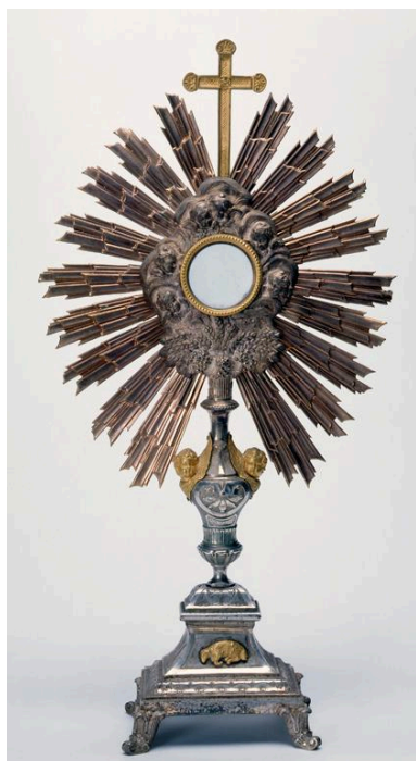
Ostensoir.

Statue en terre cuite (grandeur nature) : Saint Raphaël.