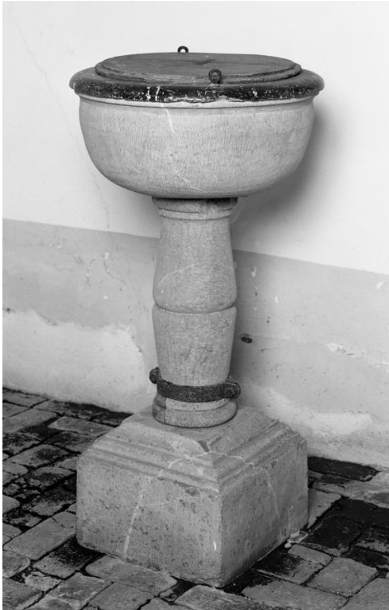
Les fonts baptismaux.