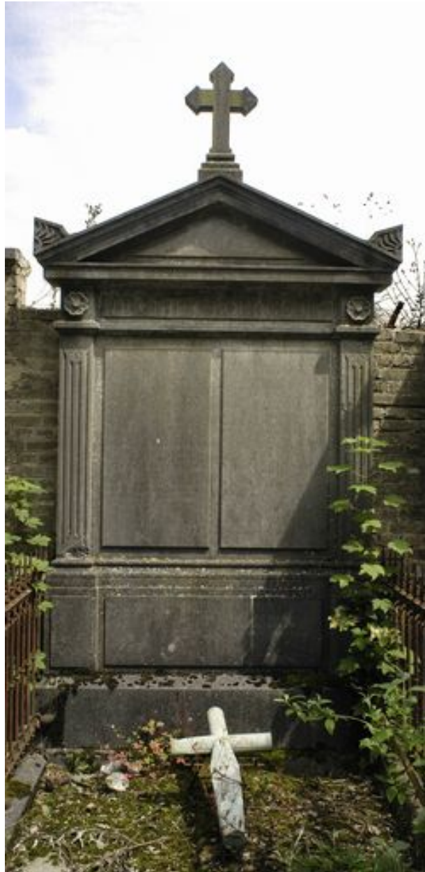
Vue de la stèle.