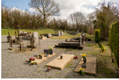
Vue générale de la partie sud-est. IVR32_20266000014NUCA