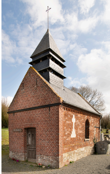
Chapelle du cimetière. IVR32_20266000013NUCA