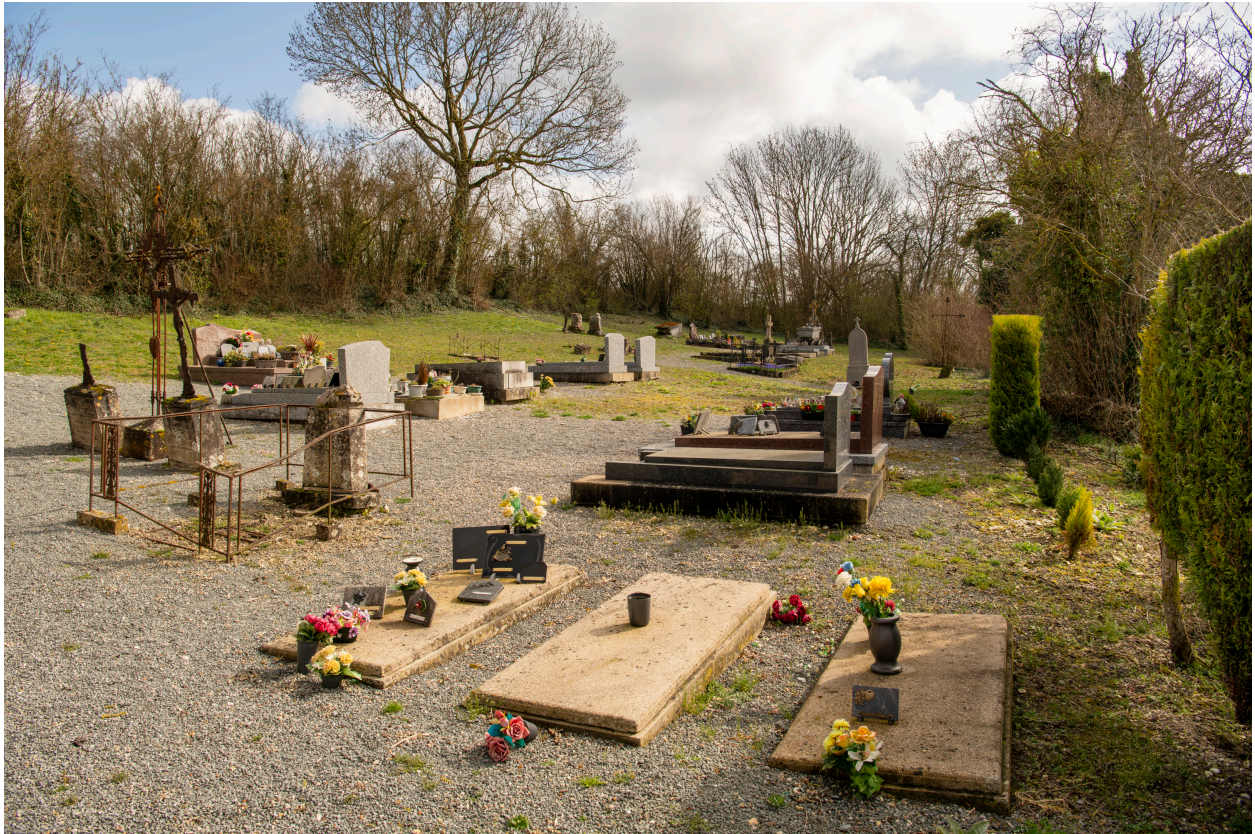
Vue générale de la partie sud-est.