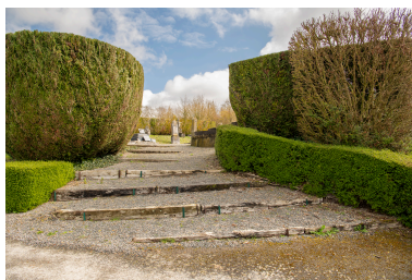
Accès au cimetière : escalier à pas d'âne.