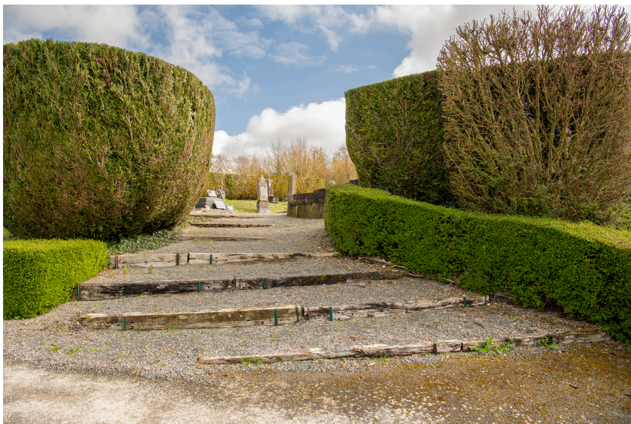
Accès au cimetière : escalier à pas d'âne.