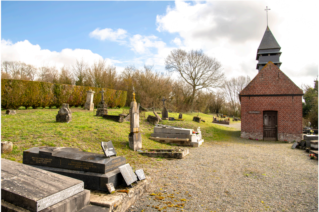
Vue générale vers le sud-est depuis l'entrée du cimetière.