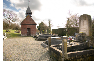
Vue générale vers le sud-ouest depuis l'entrée. IVR32_20266000011NUCA