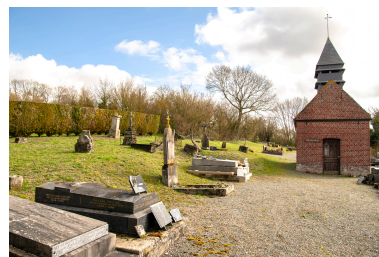
Vue générale vers le sud-est depuis l'entrée du cimetière.