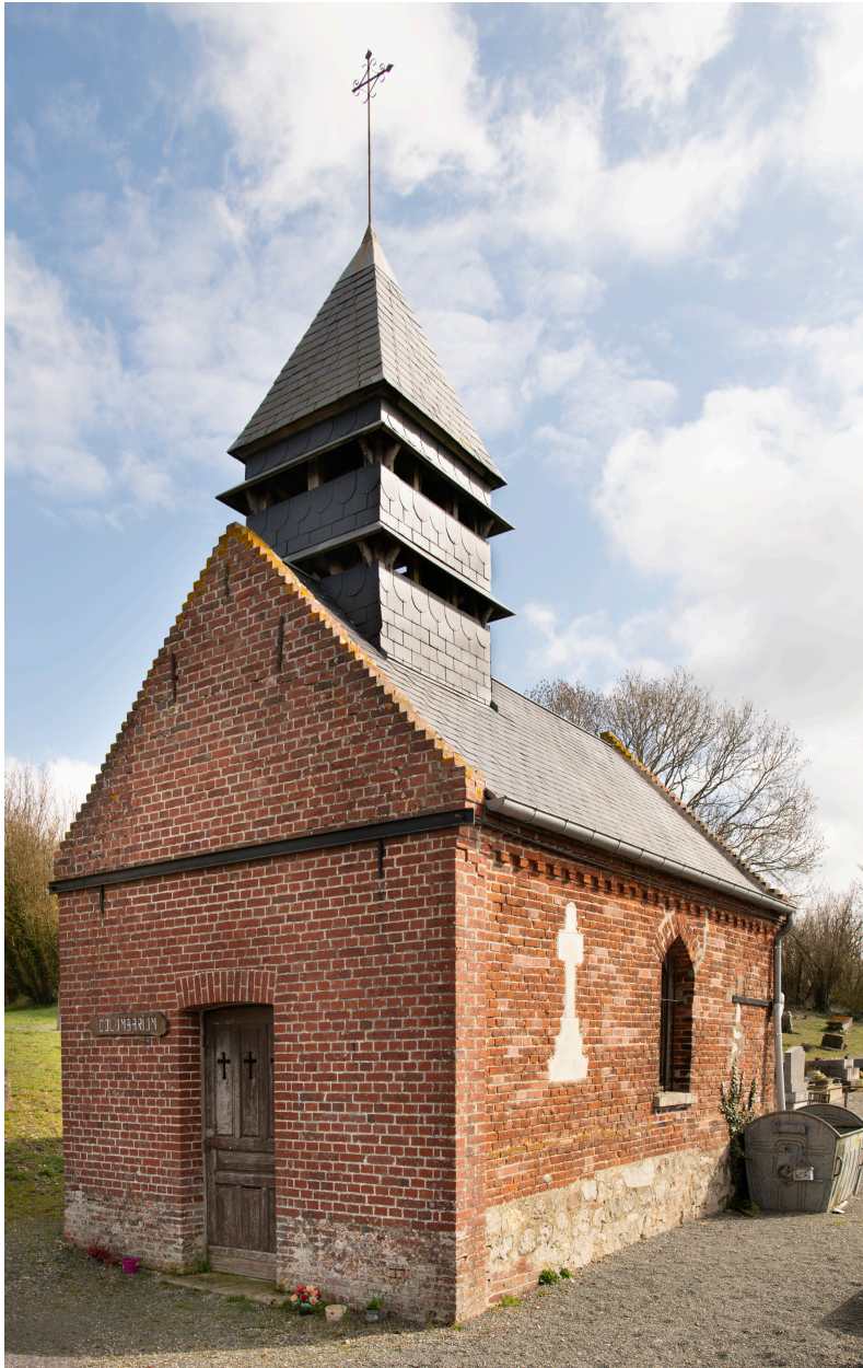
Chapelle du cimetière.