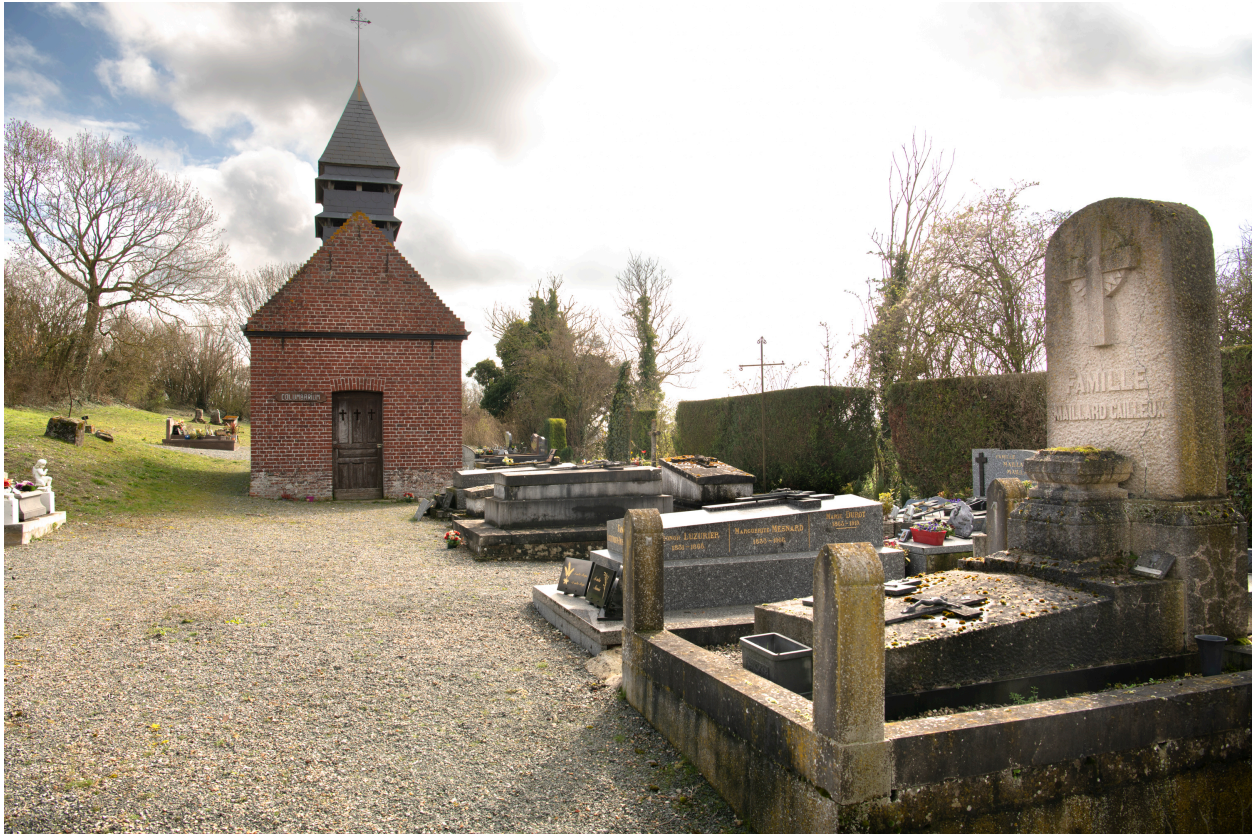
Vue générale vers le sud-ouest depuis l'entrée.