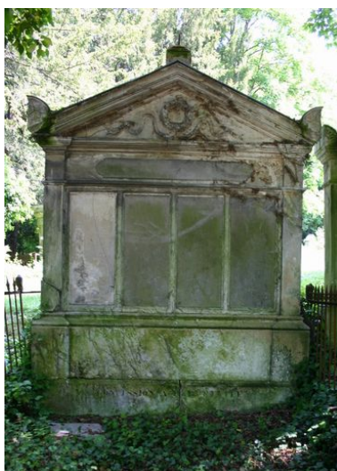
Stèle à entablement et fronton.