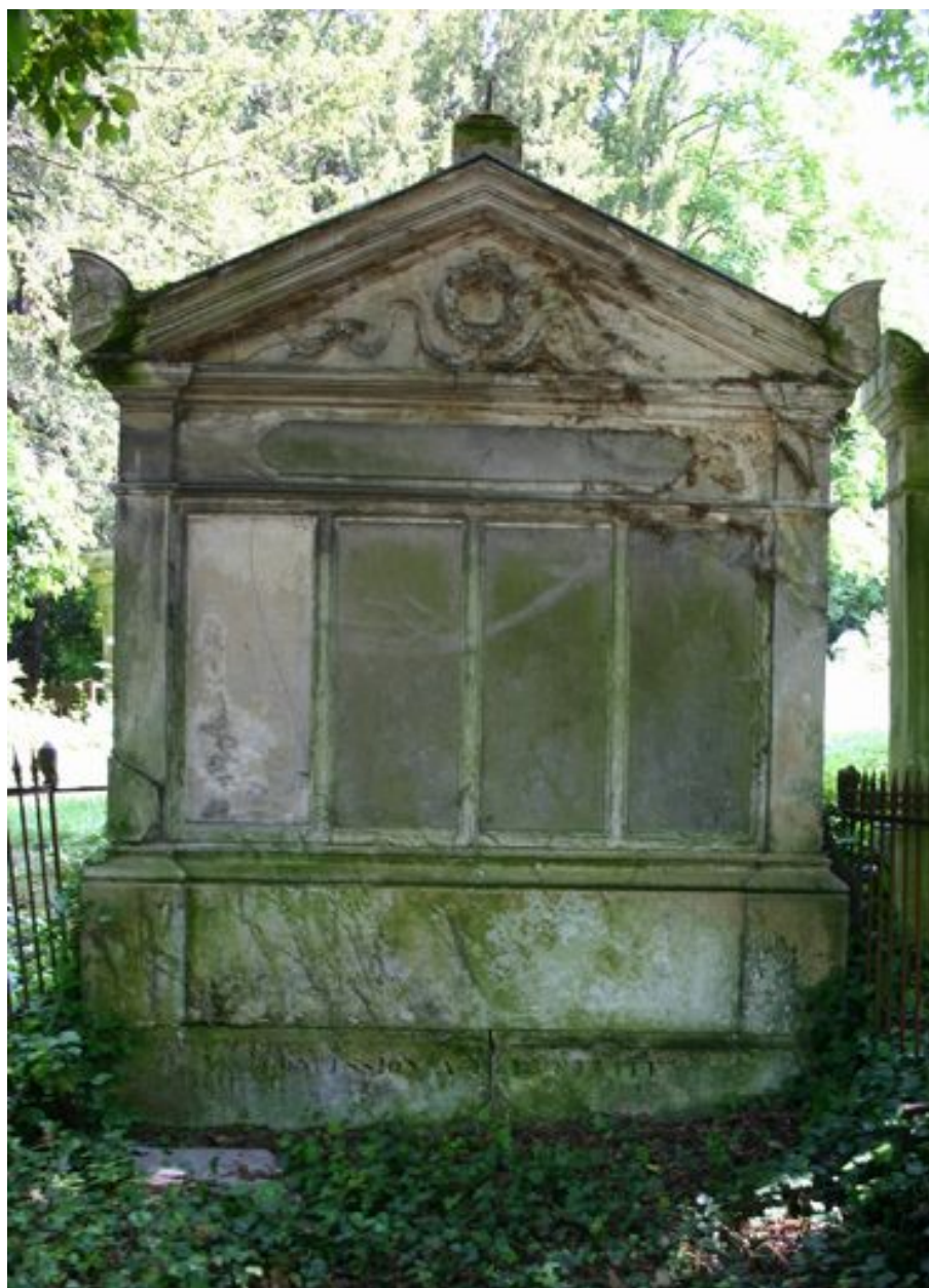
Stèle à entablement et fronton.