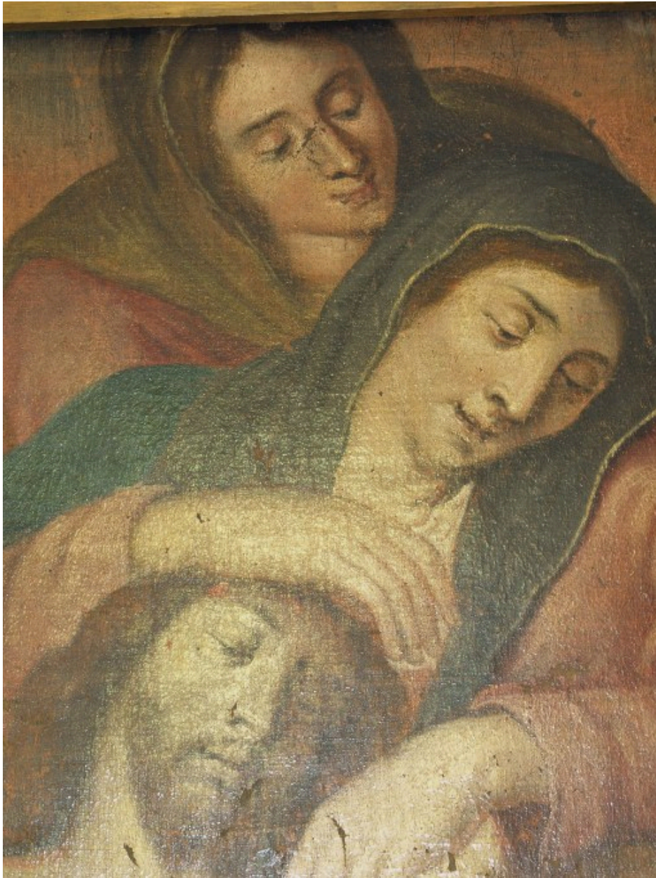
Vue de détail : Le Christ et la Vierge