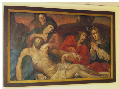
Vue générale. IVR31_20106202295NUCA