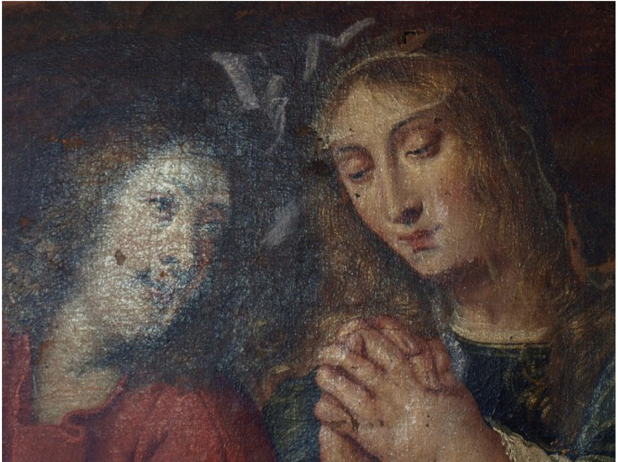
Vue de détail : Marie-Madeleine