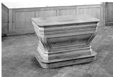
Vue générale. IVR22_20020200462X