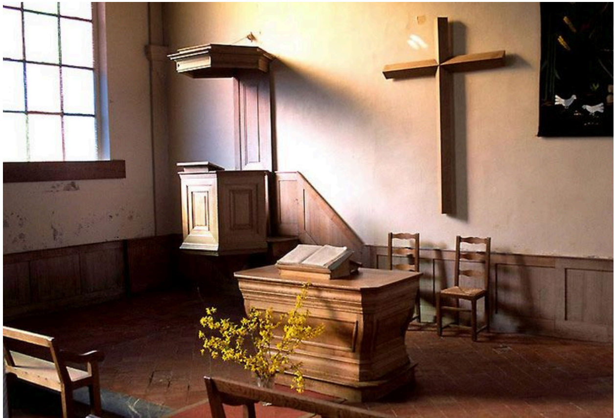
Vue générale du chœur.