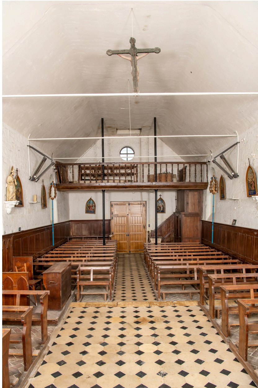
Vue intérieure vers la nef.