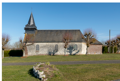
Vue générale de l'élévation sud. IVR32_20256000059NUCA