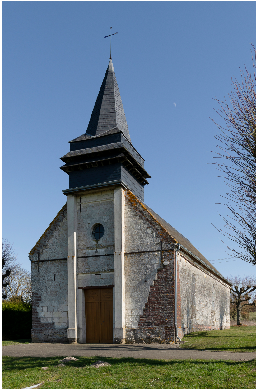
Vue générale de trois quarts depuis l'ouest.