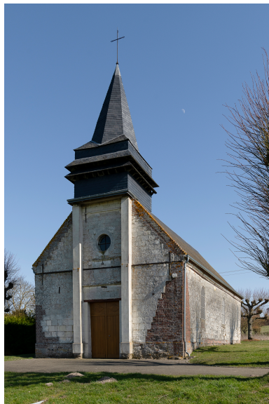
Vue générale de trois quarts depuis l'ouest. IVR32_20256000073NUCA