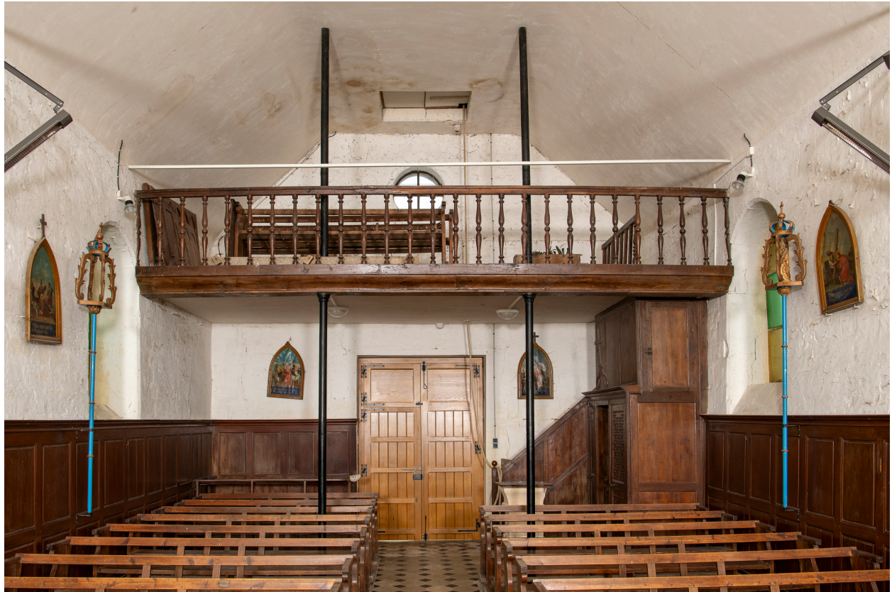
Vue intérieure de l'entrée et de la tribune.