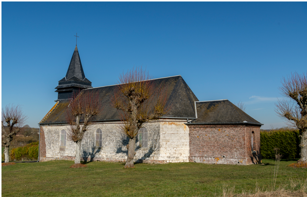
Vue générale depuis le sud-est.