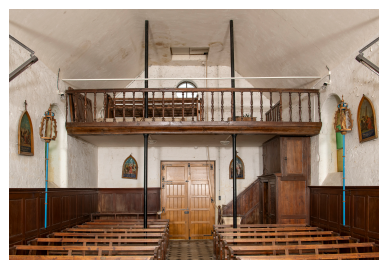
Vue intérieure de l'entrée et de la tribune.