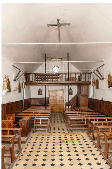
Vue intérieure vers la nef. IVR32_20256000047NUCA