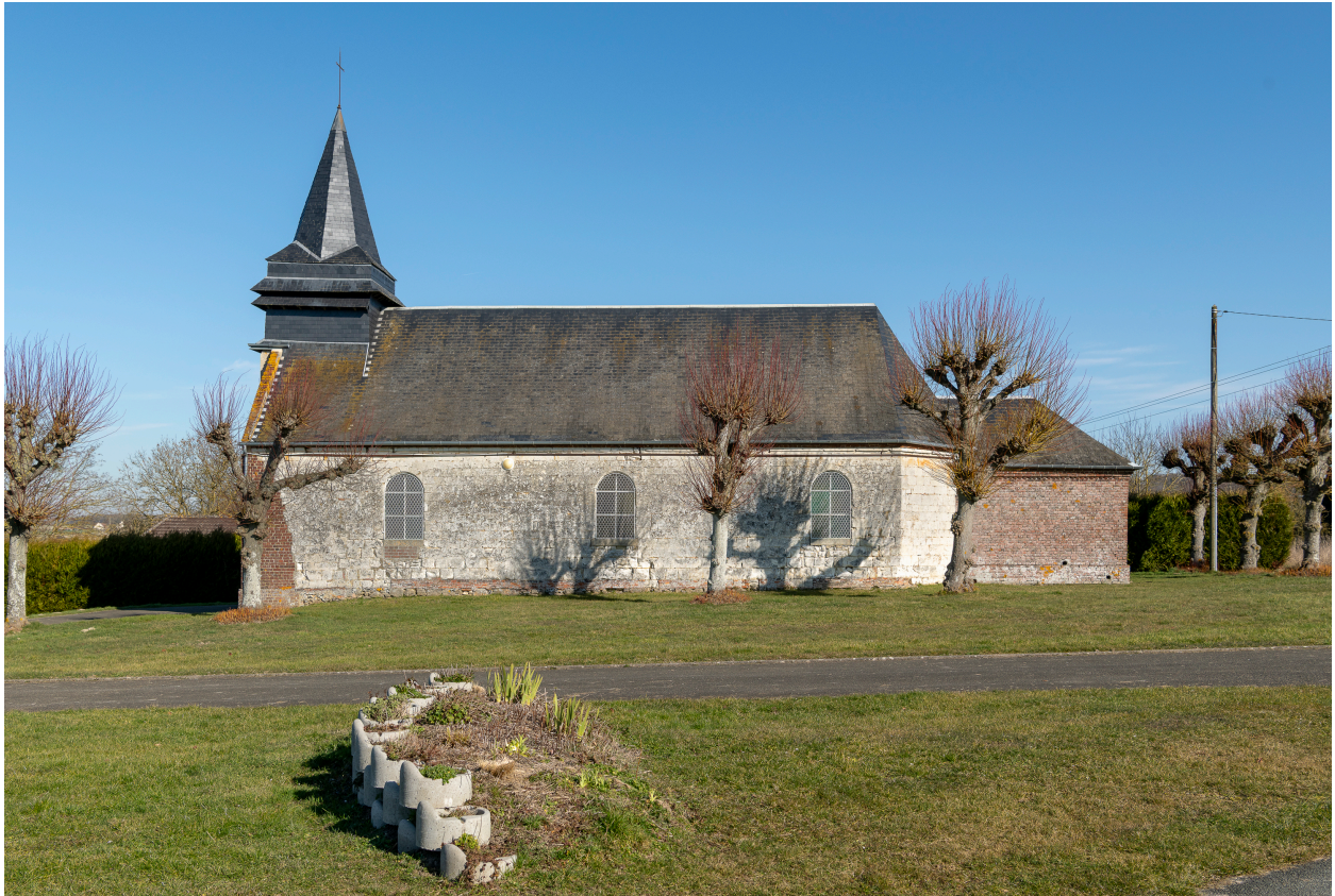
Vue générale de l'élévation sud.