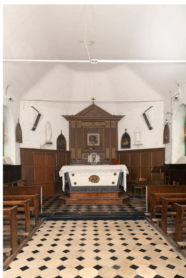
Vue intérieure du chœur.