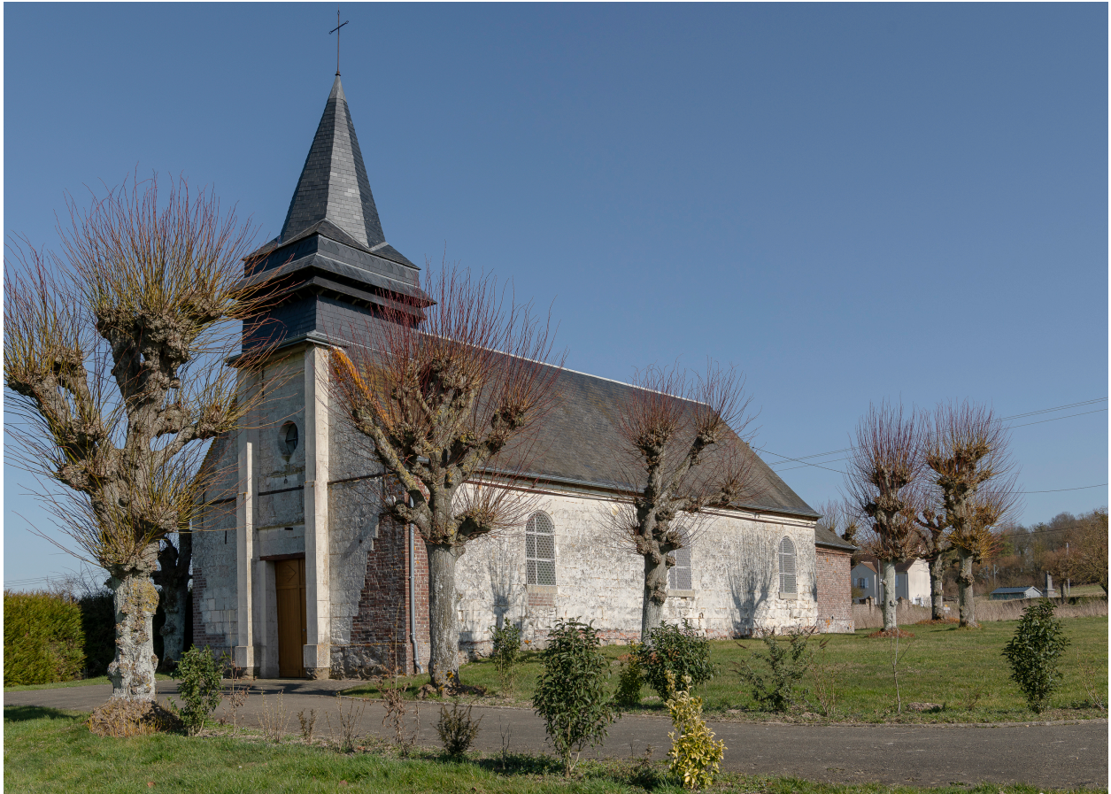
Vue générale de l'église depuis le sud-ouest.