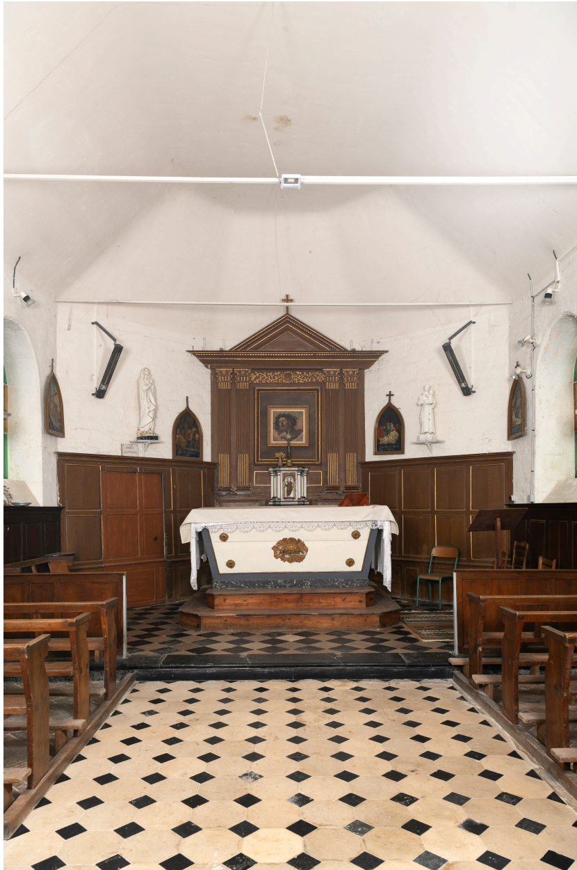
Vue intérieure du chœur.