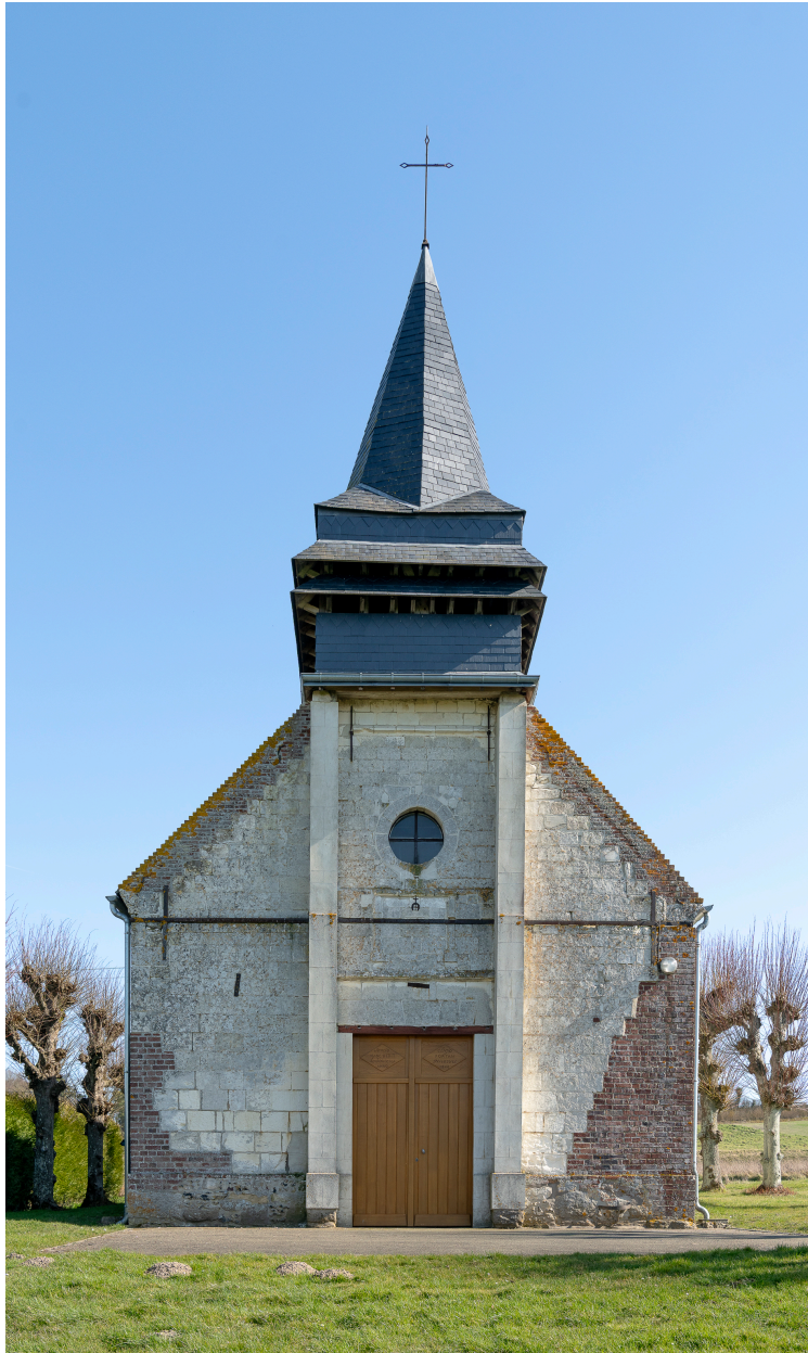
Vue générale de la façade occidentale.