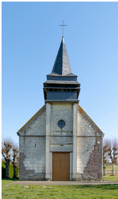
Vue générale de la façade occidentale. IVR32_20256000072NUCA