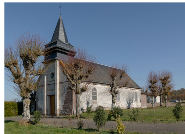
Vue générale de l'église depuis le sud-ouest.