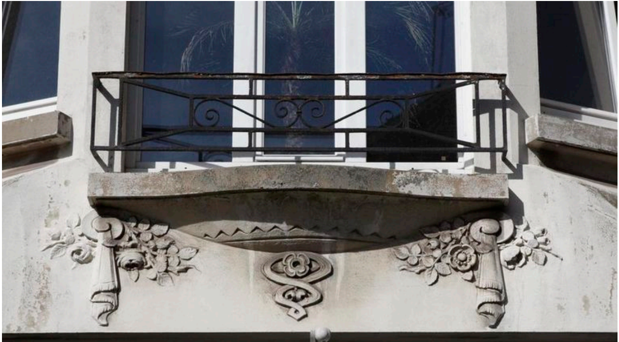
Détail de l'encorbellement de la baie du premier étage orné de rubans, d'un motif zigzagant et de fleurs.