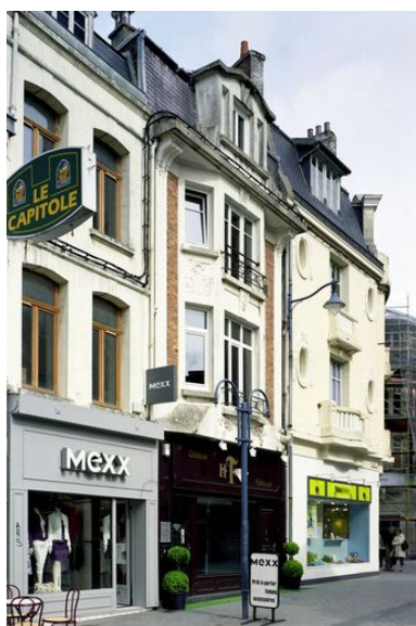
Vue générale. IVR31_20086200227XE