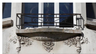
Détail de l'encorbellement de la baie du premier étage orné de rubans, d'un motif zigzagant et de fleurs.