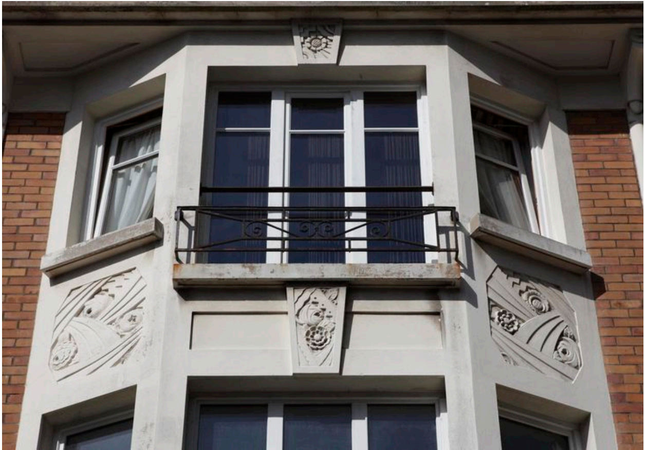
Détail de l'oriel aux cartouches sculptés de formes géométriques et de fleurs stylisées.