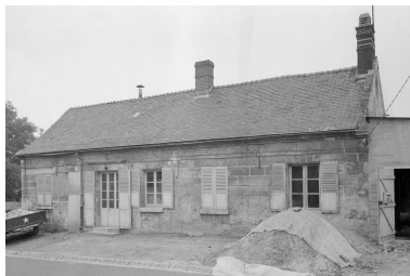
Elévation antérieure. IVR22_19846001003X

Plan de situation. Extrait du plan cadastral de 1982, section B2 286. IVR22_20096000021NUCA