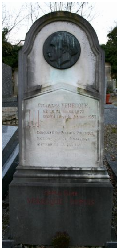
Stèle en forme de chapeau de gendarme.