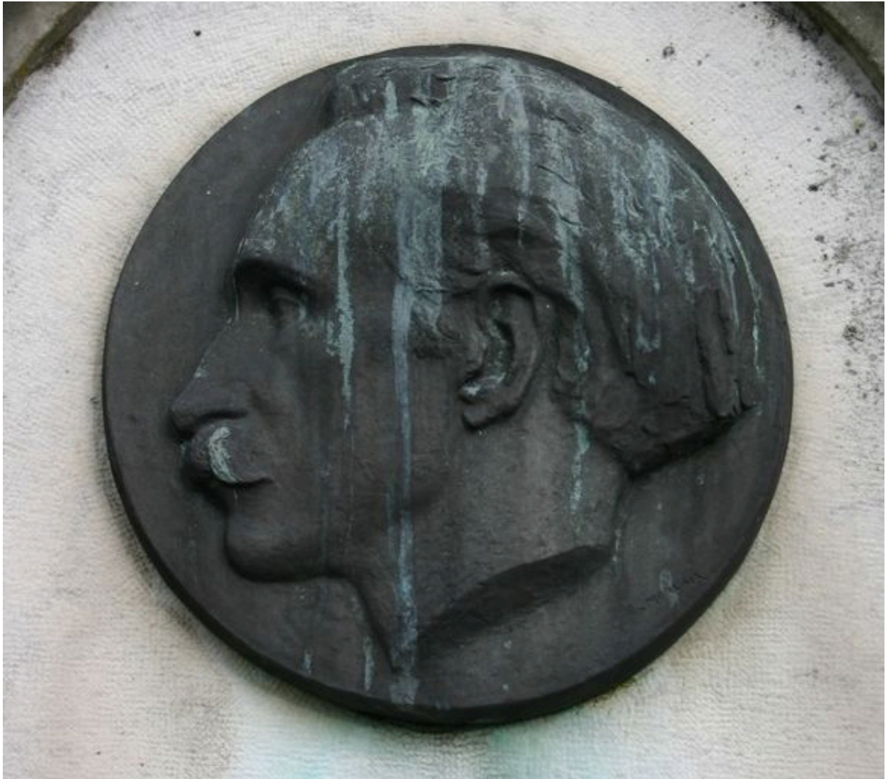
Médaille en bronze représentant Charles Verecque par Emile Morlaix (sculpteur).