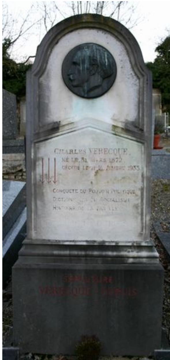
Stèle en forme de chapeau de gendarme.