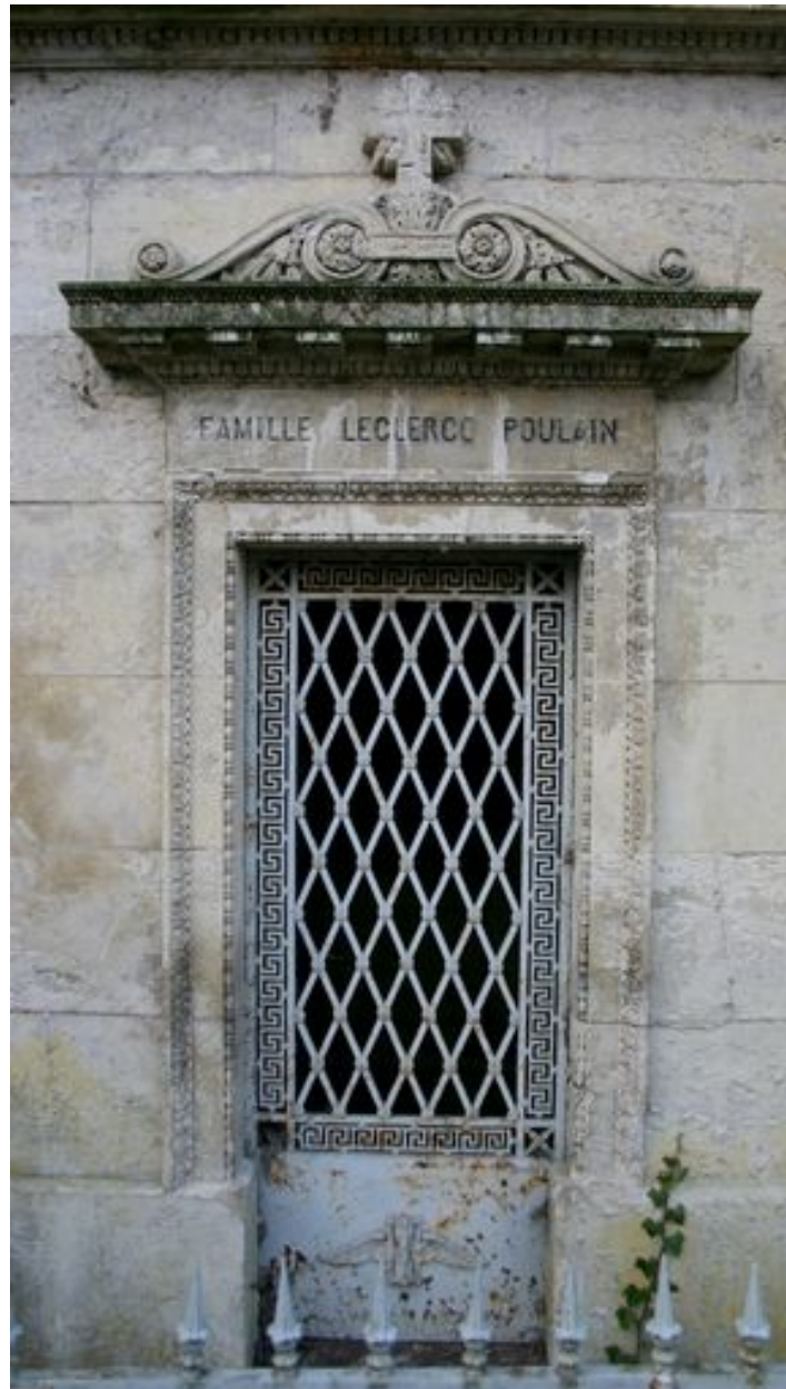
Détail du décor sculpté et de la porte en fonte ouvragée (N49)