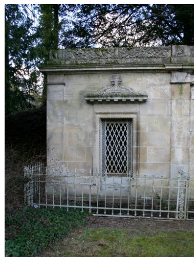
Vue du tombeau Dubois-Quillet (N51).