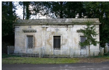
Vue générale. IVR22_20088000315NUCA