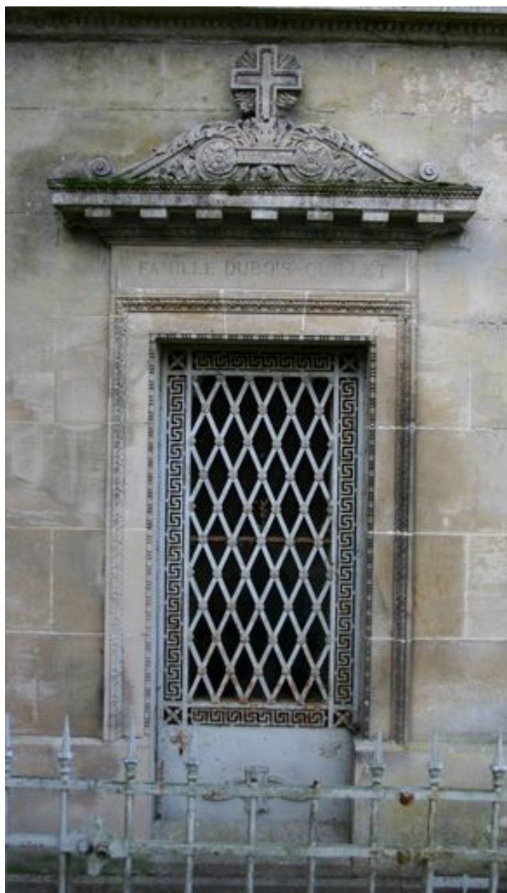
Détail du décor sculpté et de la porte en fonte ouvragée (N51).