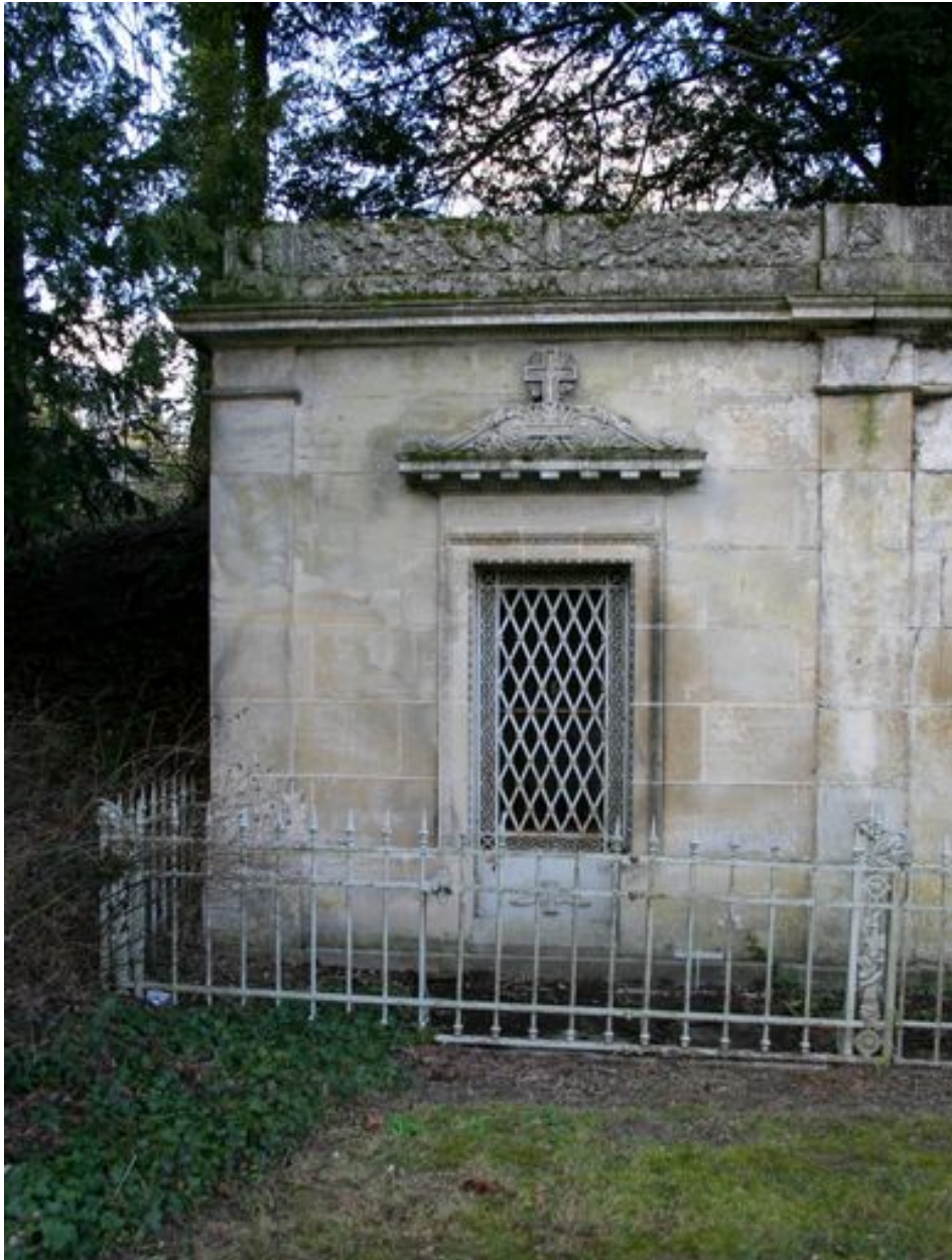
Vue du tombeau Dubois-Quillet (N51).