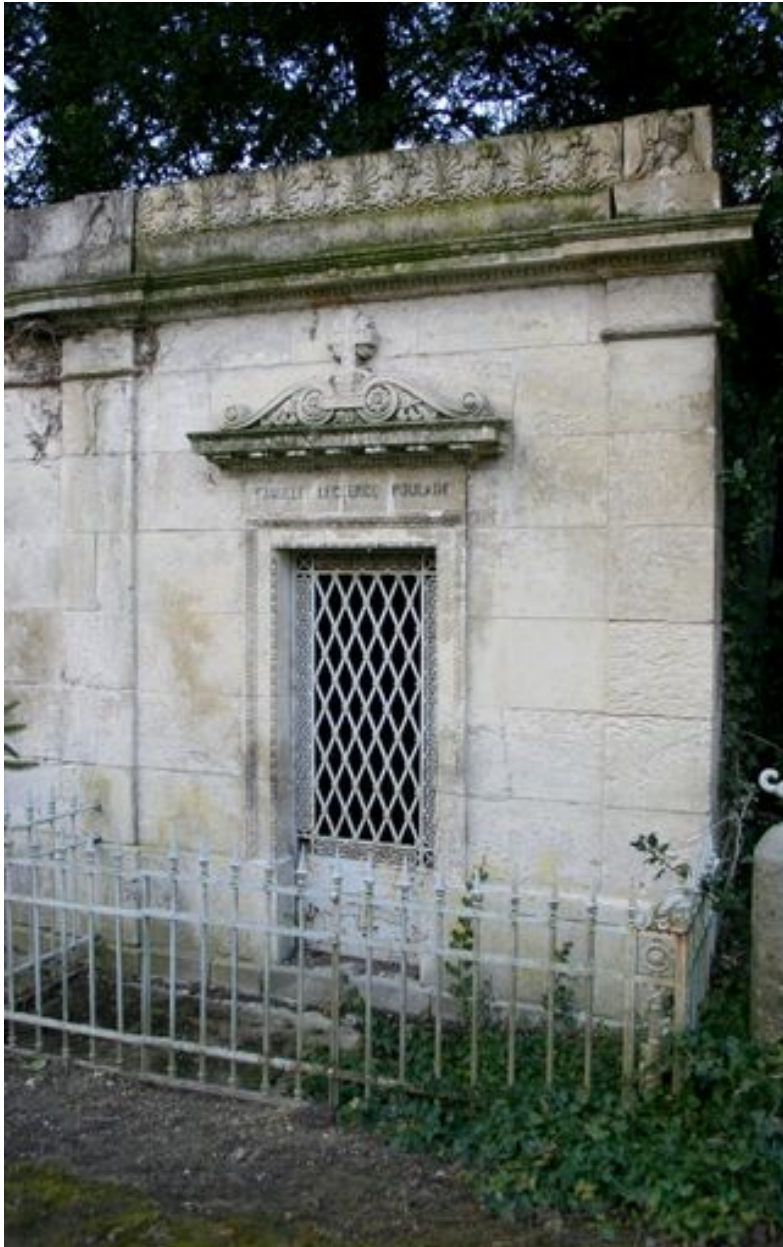
Vue du tombeau Leclercq-Poulain (N49).