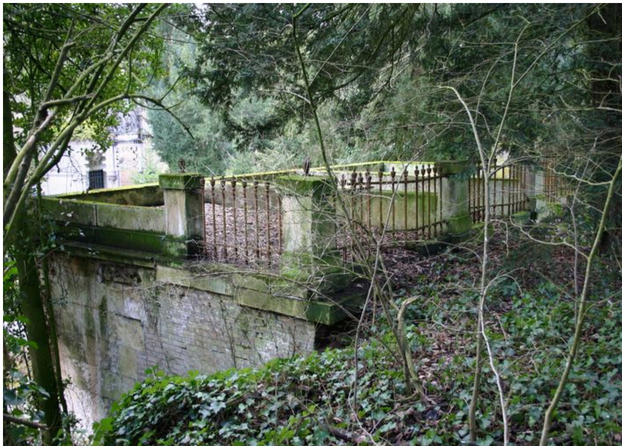
Vue du toit-terrasse.