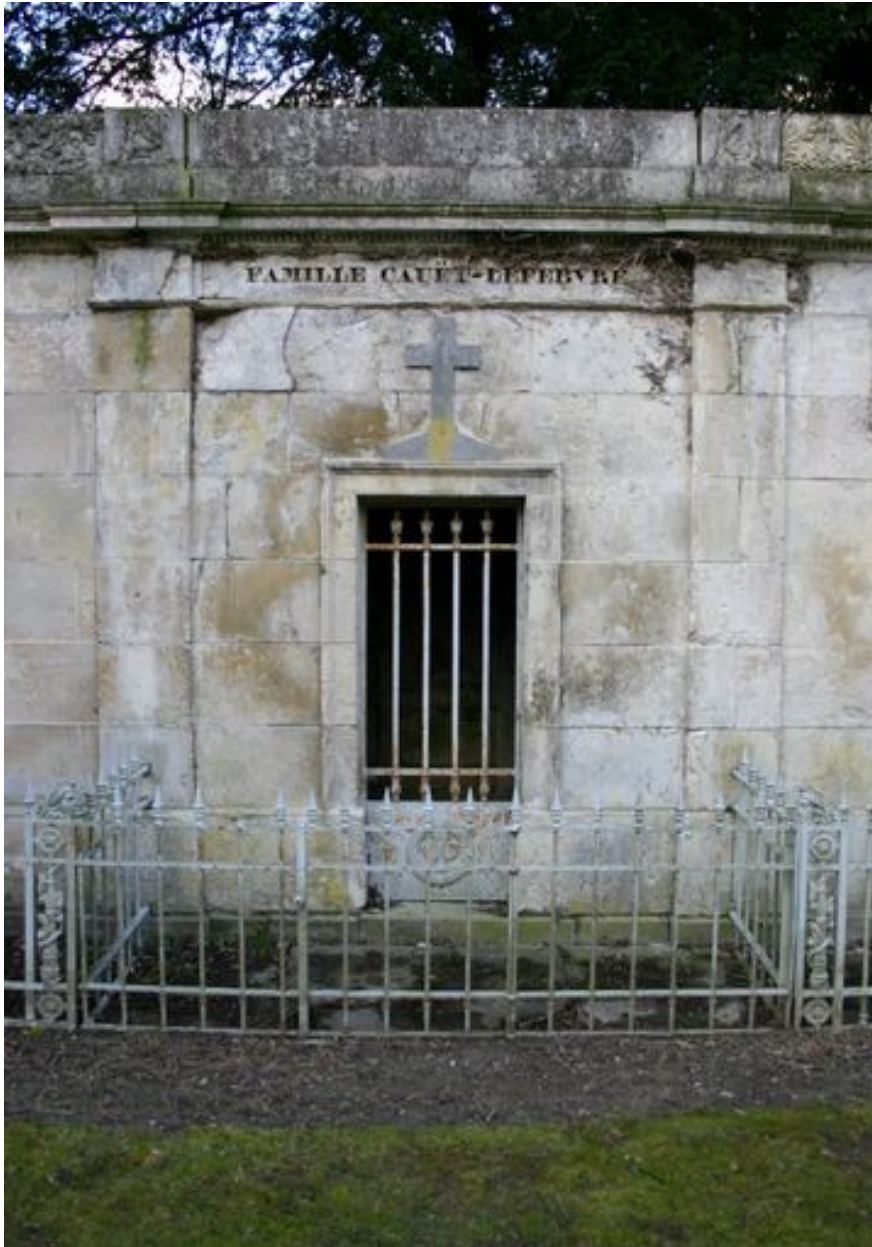
Vue du tombeau Cauët-Lefebvre (N50).