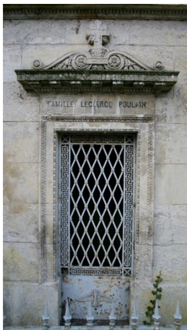
Détail du décor sculpté et de la porte en fonte ouvragée (N49) IVR22_20088000310NUCA