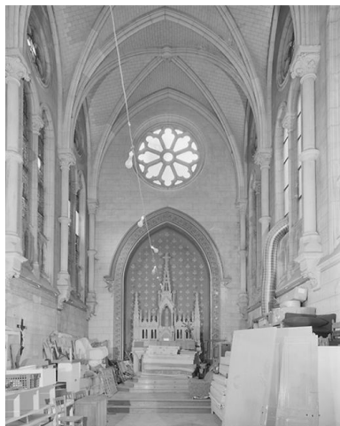
Vue intérieure de la chapelle vers le chœur. IVR22_19968000307V