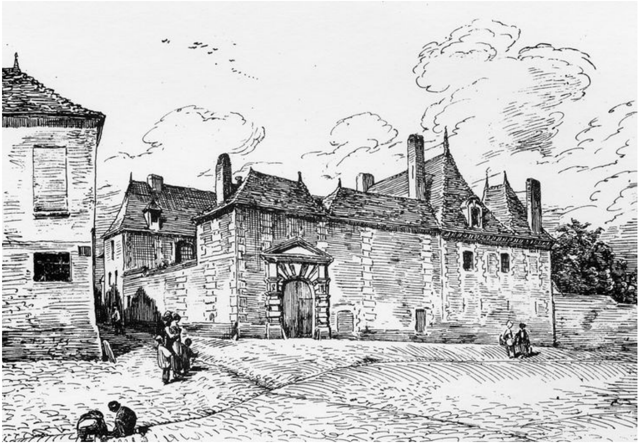
L'hôtel de l'Intendance, dessin par Louis Duthoit (Le Vieil Amiens, 1874).