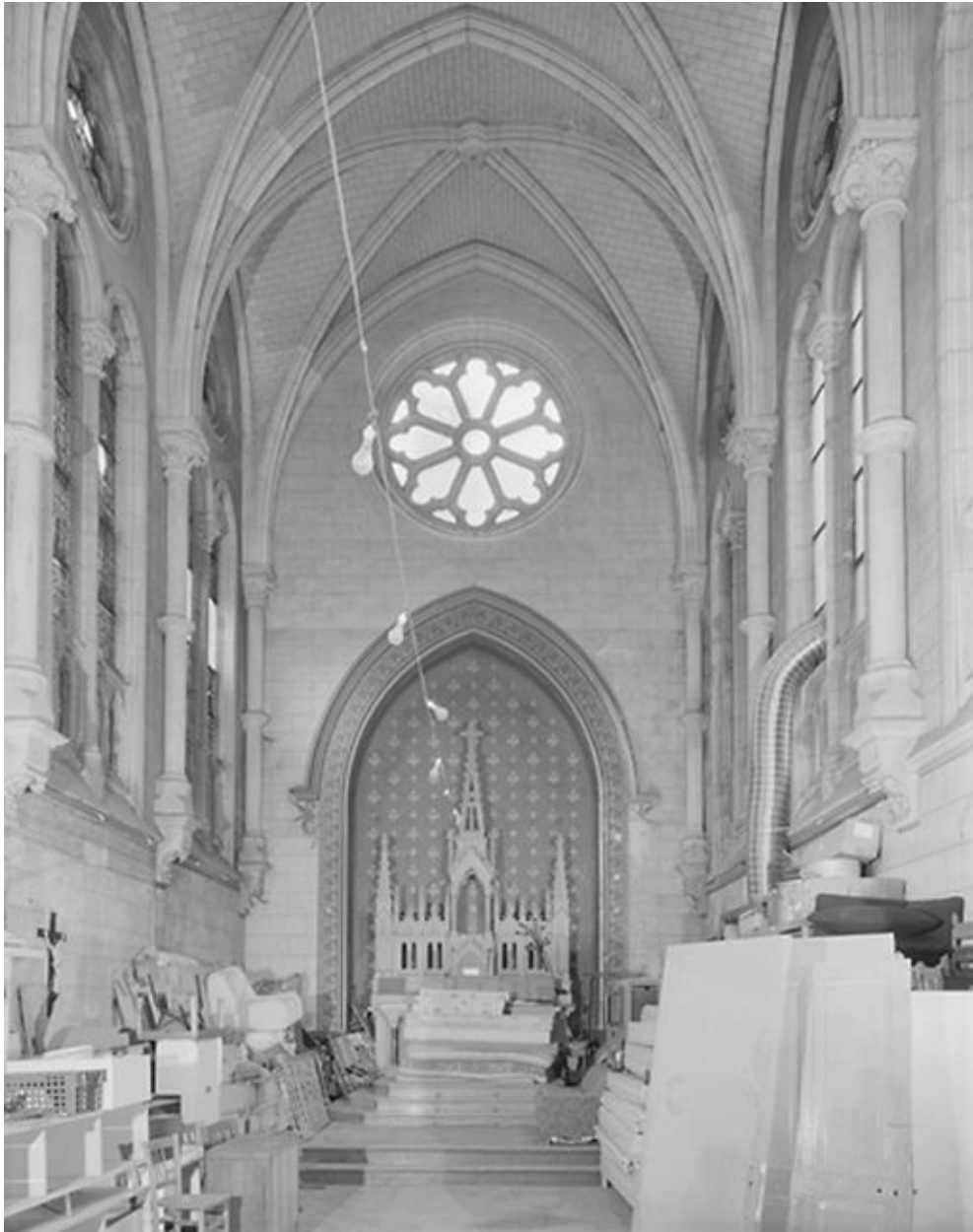
Vue intérieure de la chapelle vers le chœur.