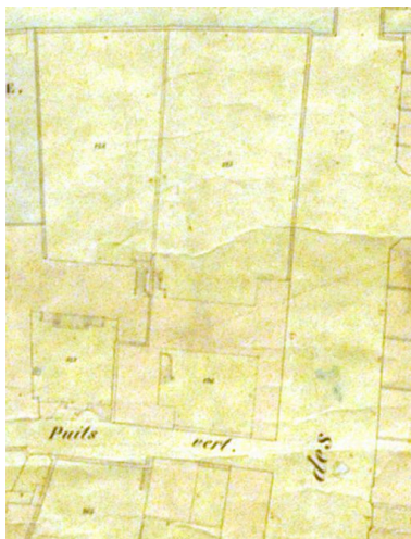
Extrait du cadastre de 1851 (DGI).