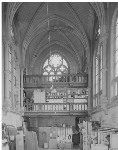
Vue intérieure de la chapelle vers l'est. IVR22_19968000306V