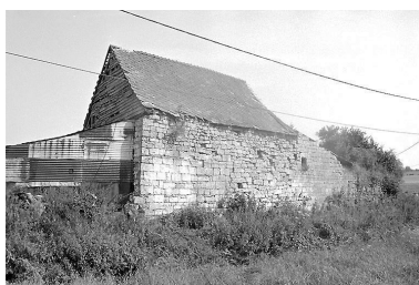
Vestiges du mur d'enceinte.