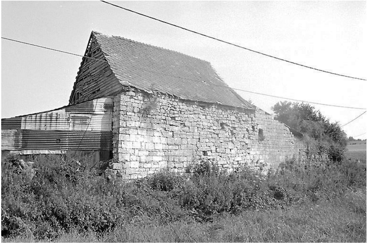
Vestiges du mur d'enceinte.