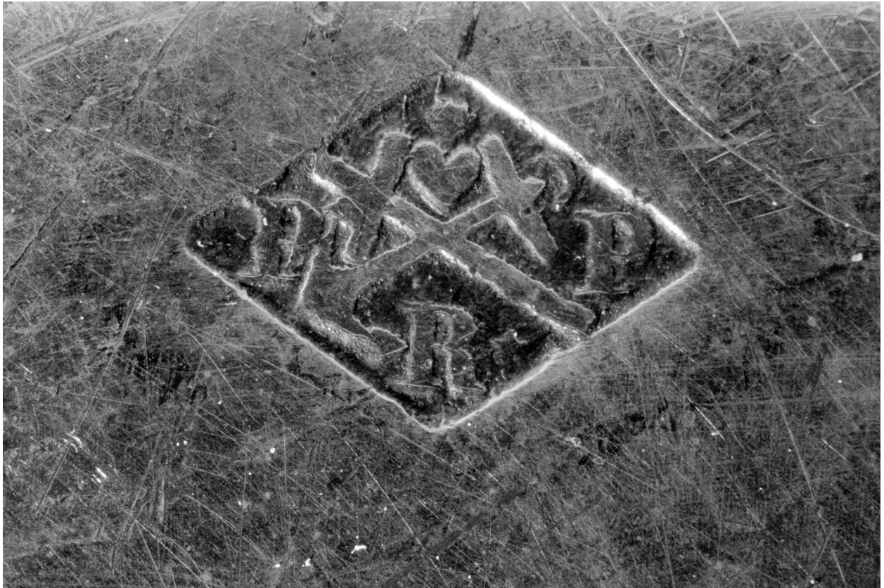
Poinçon de maître.