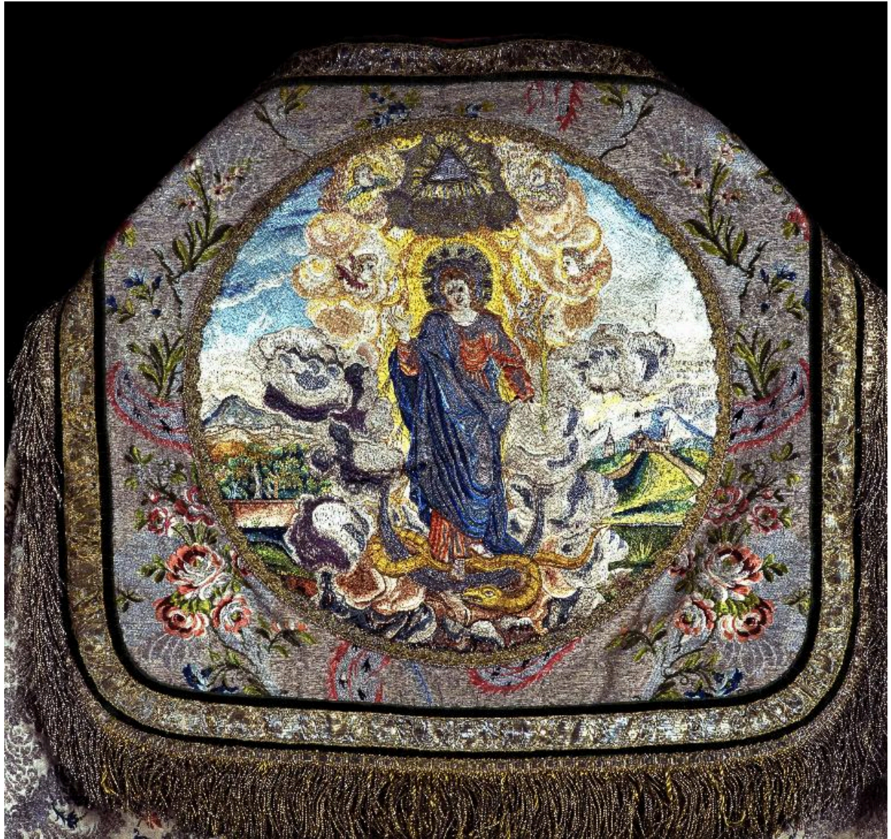
Détail du chaperon : l'Assomption de la Vierge.