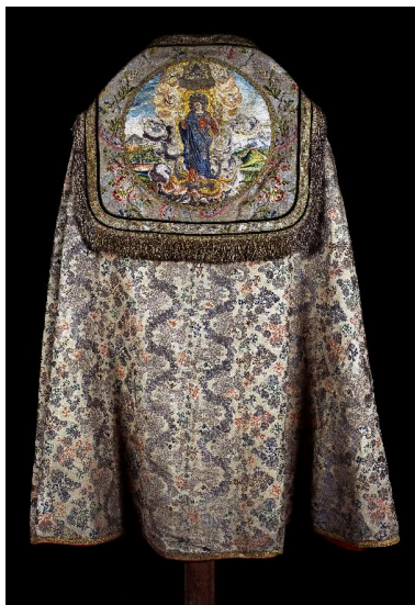
Vue du dos.