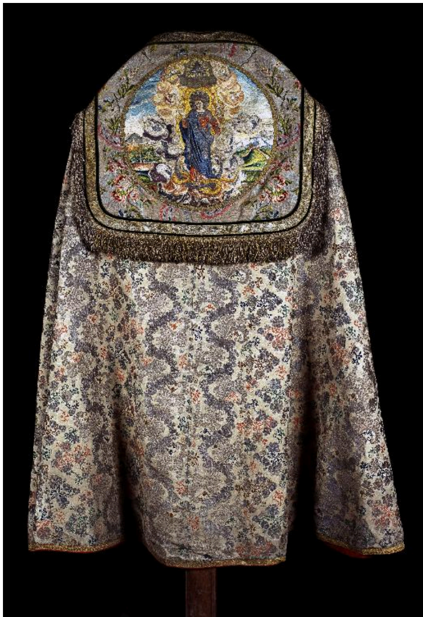
Vue du dos.