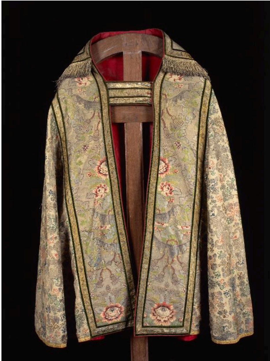
Vue du devant.