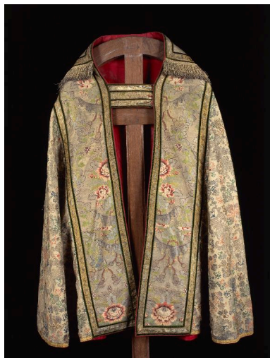
Vue du devant. IVR22_19956000963XA