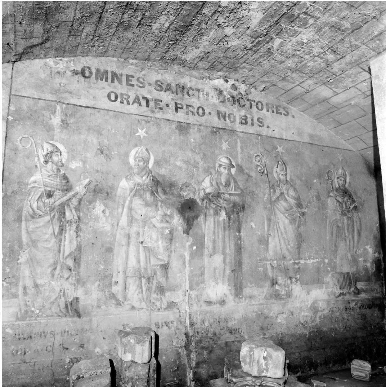
Parmi les figures représentées, de gauche à droite : Saint-Hilaire de Poitiers, Saint Ambroise de Milan, Saint Jérôme, Saint-Augustin d' Hippone, Saint-Pierre Chrysologue, vue d' ensemble.