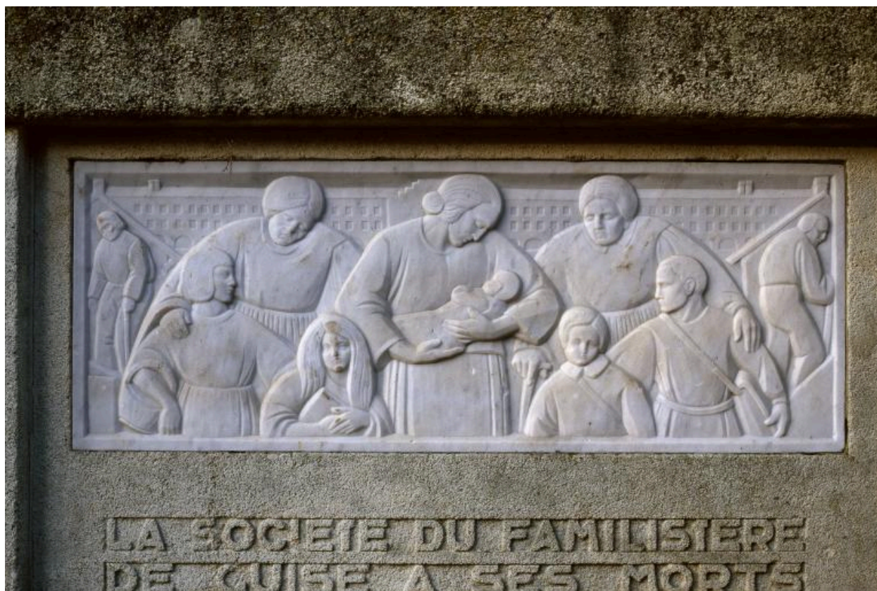
Vue du relief orant la partie supérieure gauche du monument : la Famille.