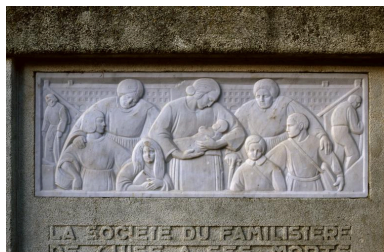
Vue du relief orant la partie supérieure gauche du monument : la Famille. IVR22_20000202909XA