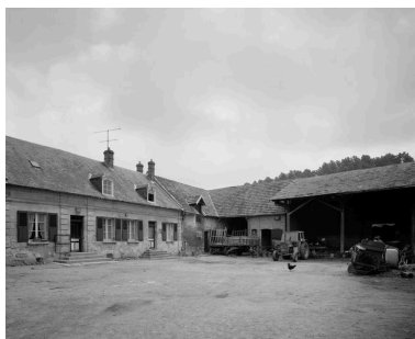
Bâtiments sur cour. IVR22_19856000812V