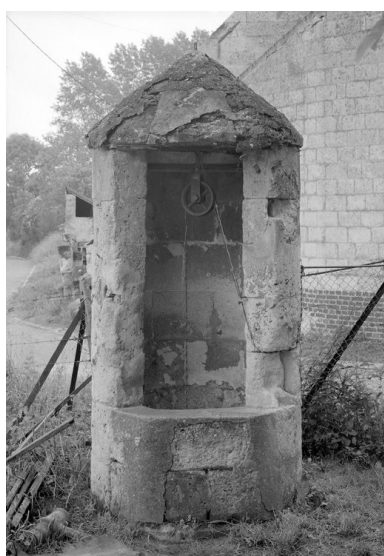
Puits.