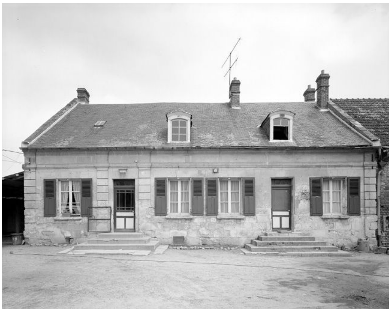
Logis. Elévation antérieure.