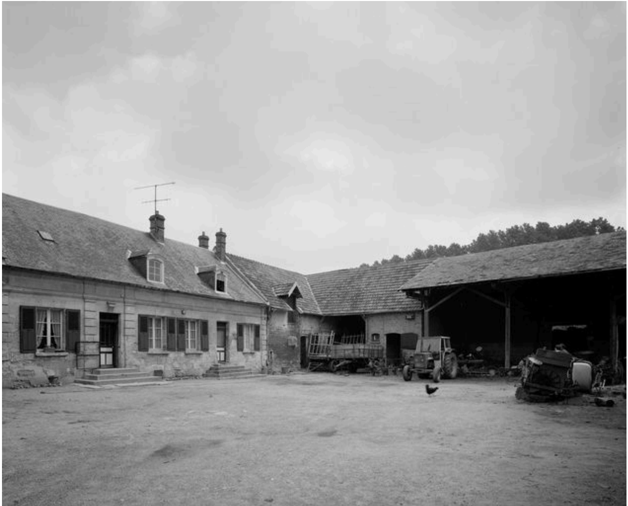
Bâtiments sur cour.