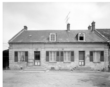
Logis. Elévation antérieure. IVR22_19856000810V