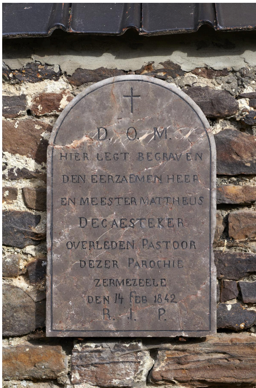
Plaque funéraire, en flamand, du pasteur de la paroisse DECAESTEKER (1842). Accolée au mur sud de l'église.