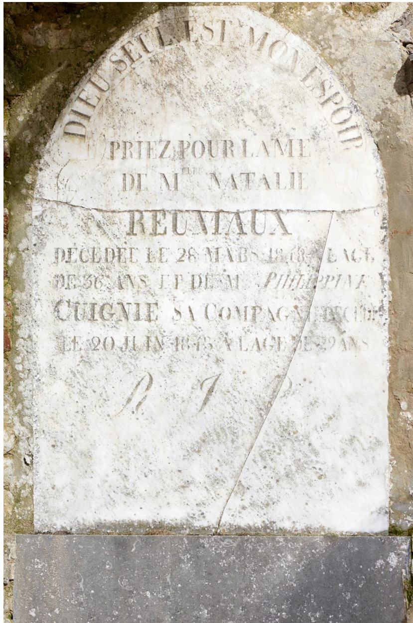
Plaque funéraire en marbre blanc REUMAUX CUIGNIE (1848). Accolée au mur sud de l'église.