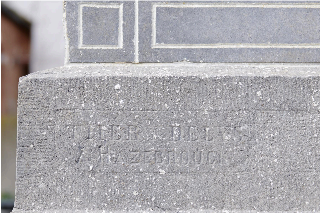
Signature du marbrier "THERY-DELYS A HAZEBROUCK" sur la tombe familiale DESCHODT (Fin XIXe / début XXe s.).