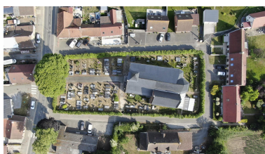
Vue zénithale du cimetière.