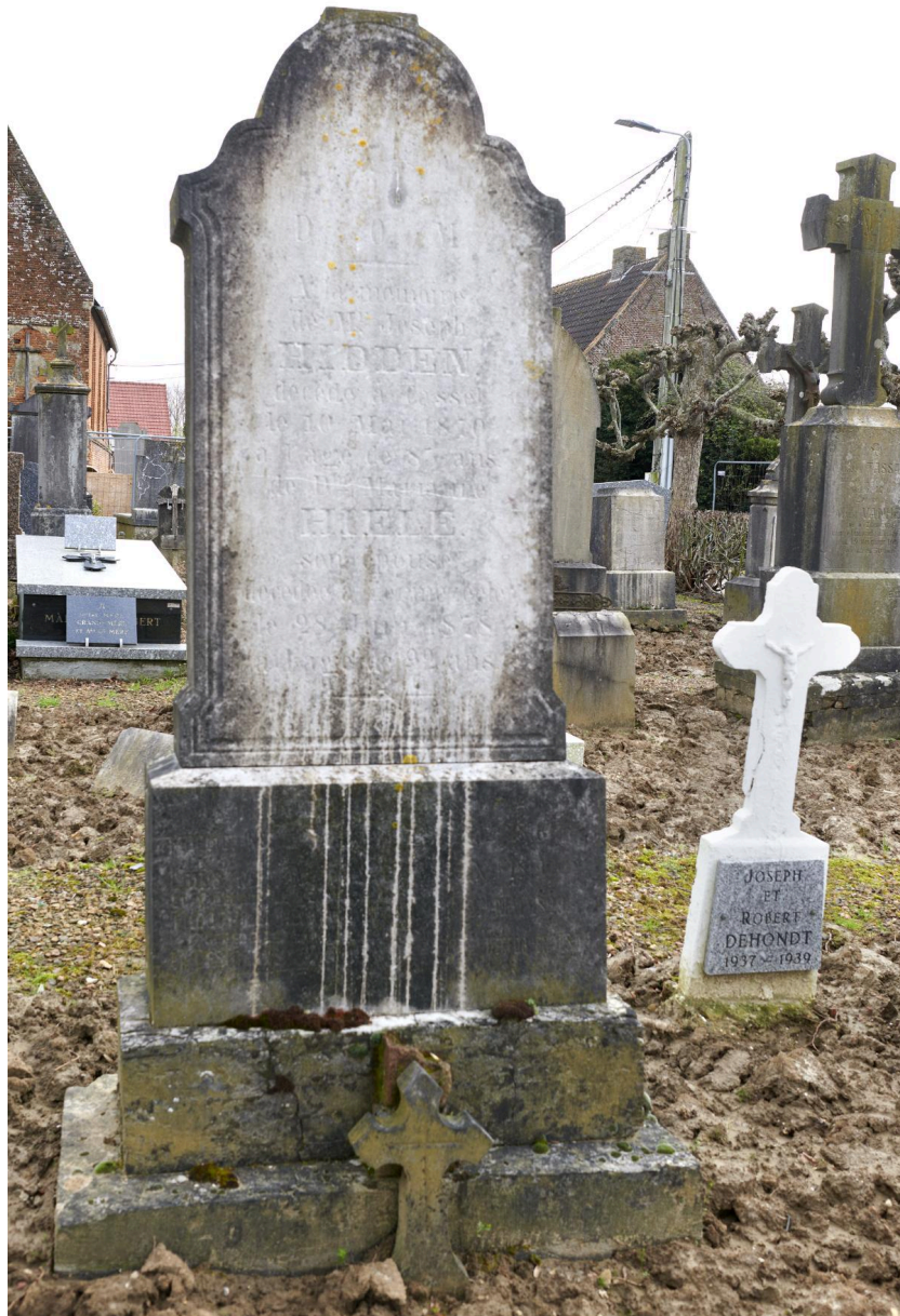
Tombeau des époux Hidden (1870 et 1878).