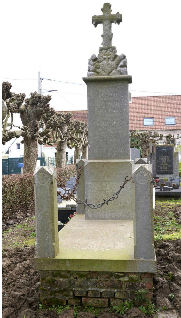
Tombeau des époux LEBLEU (1920/1932).