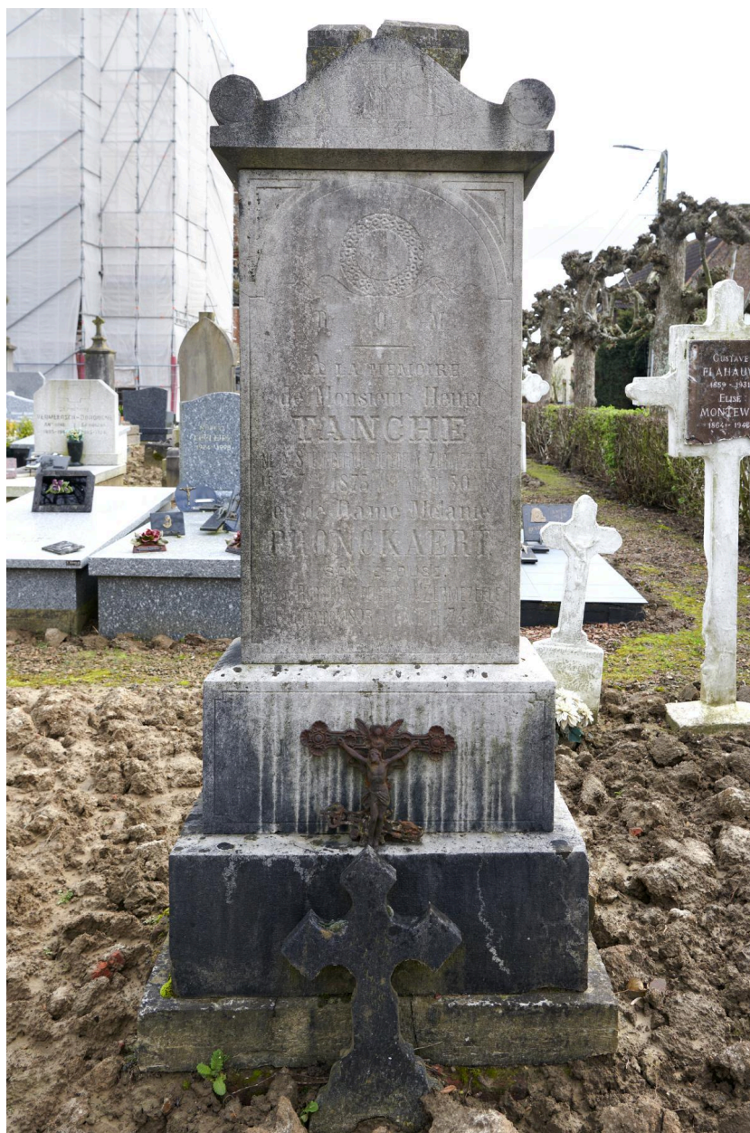
Tombeau des époux Tanche (1875 et 1895).