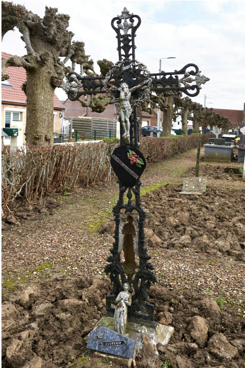
Tombeau de la famille Barrey-Desmouot et sa croix en fer forgé (XIXe s. ?).