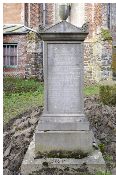
Tombeau de la famille DEHAENE (1855 et 1913). IVR32_20245901119NUCA