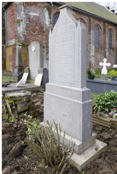
Tombe familiale DESCHODT (1880, 1887, 1891, 1906).