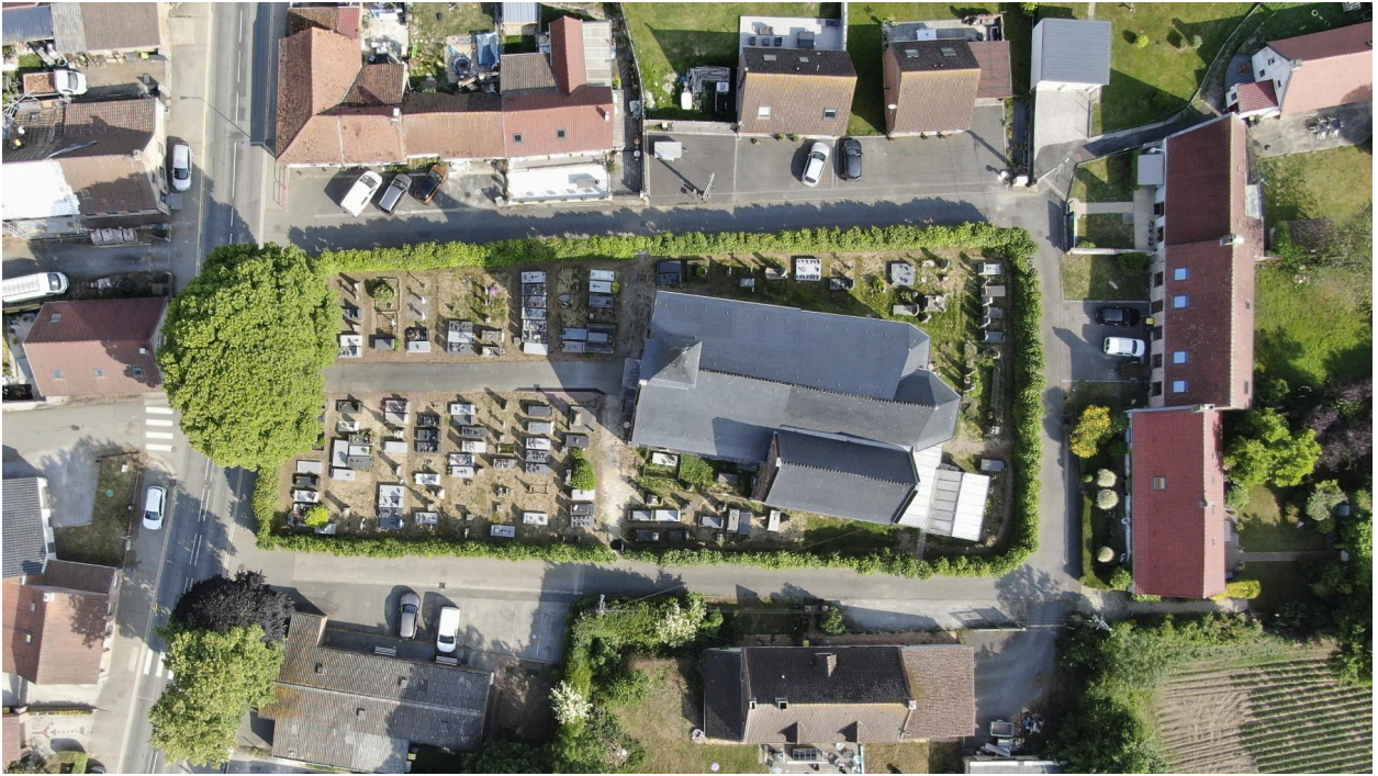
Vue zénithale du cimetière.