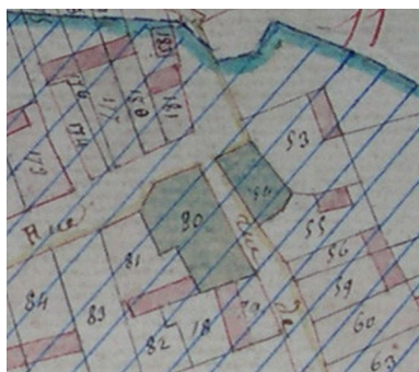
Extrait du cadastre napoléonien (DGI). IVR22_20038010915NUCA