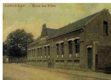
L'ancienne école de fille de Longueau. Carte postale, début 20e siècle (coll. part.). IVR22_20058005010NUCA