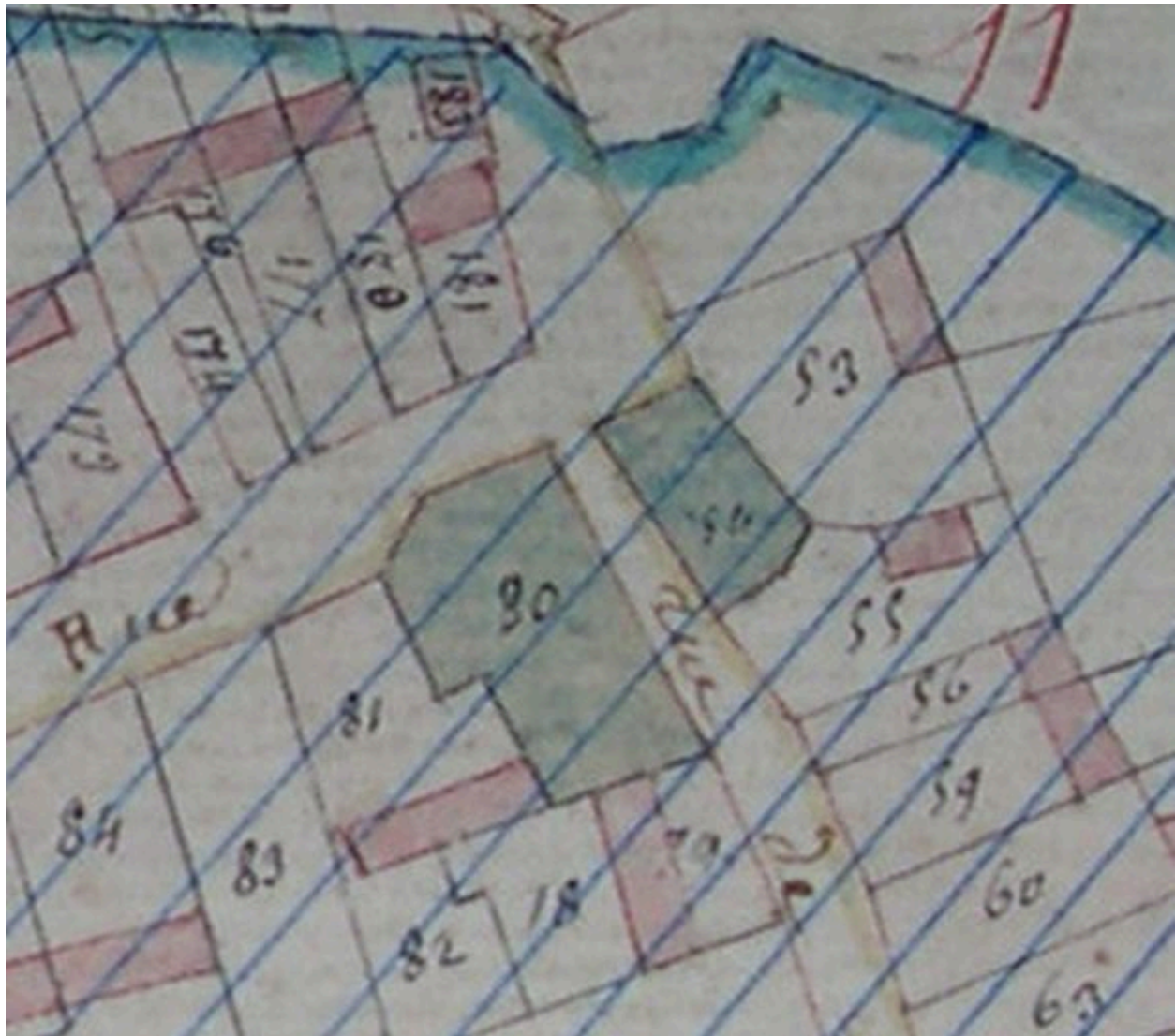
Extrait du cadastre napoléonien (DGI).