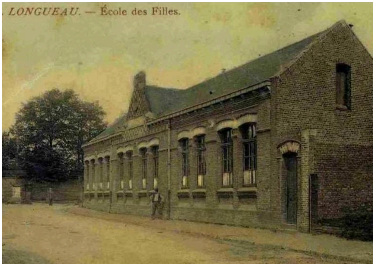
L'ancienne école de fille de Longueau. Carte postale, début 20e siècle.