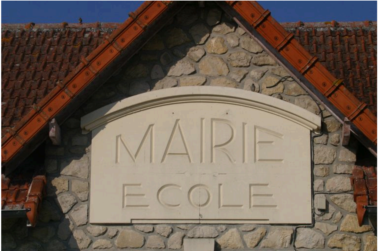
Vue de l'enseigne.