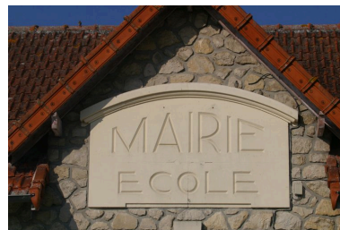
Vue de l'enseigne. IVR22_20030203145NUCA