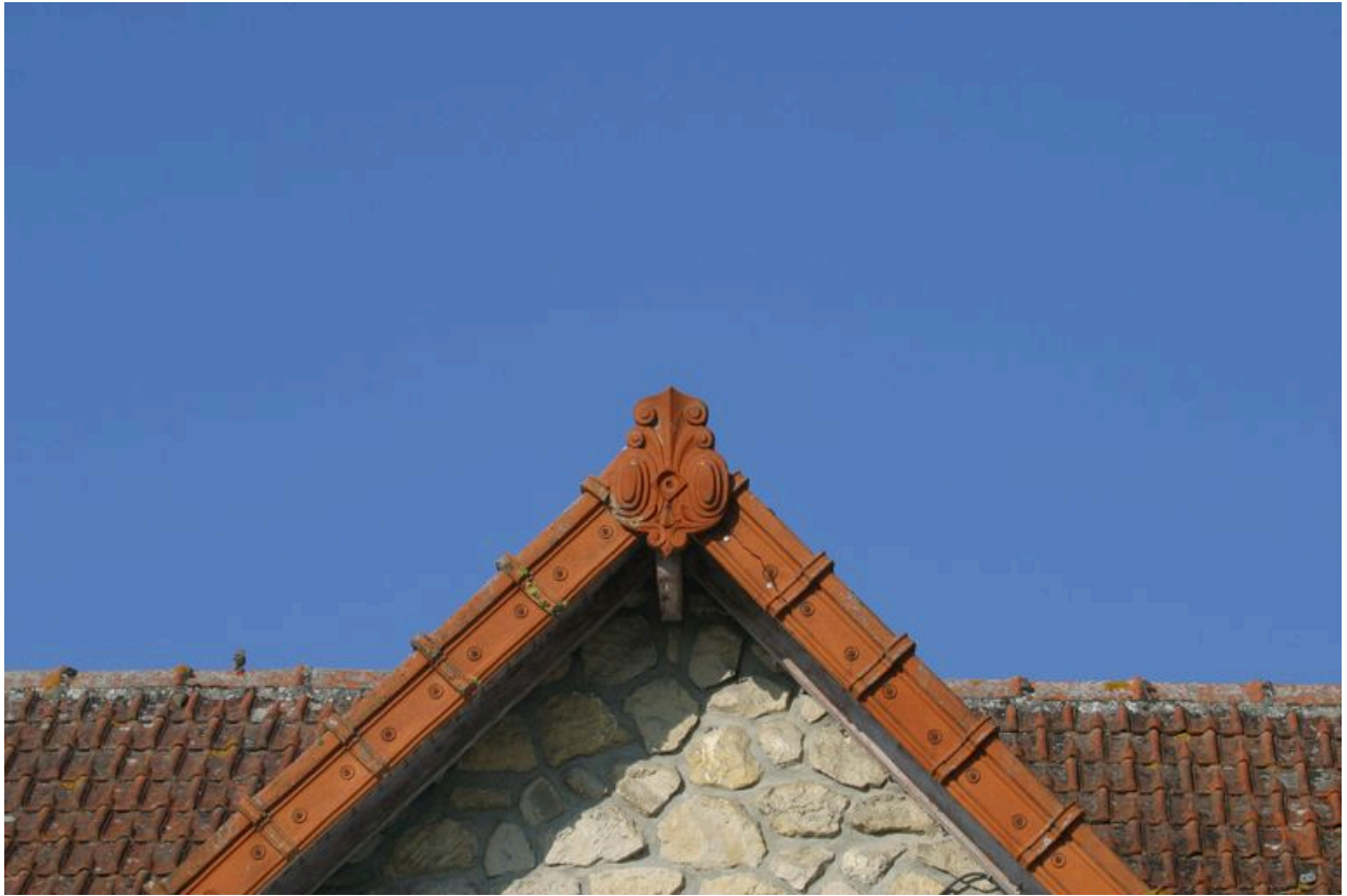
Détail d'un acrotère.