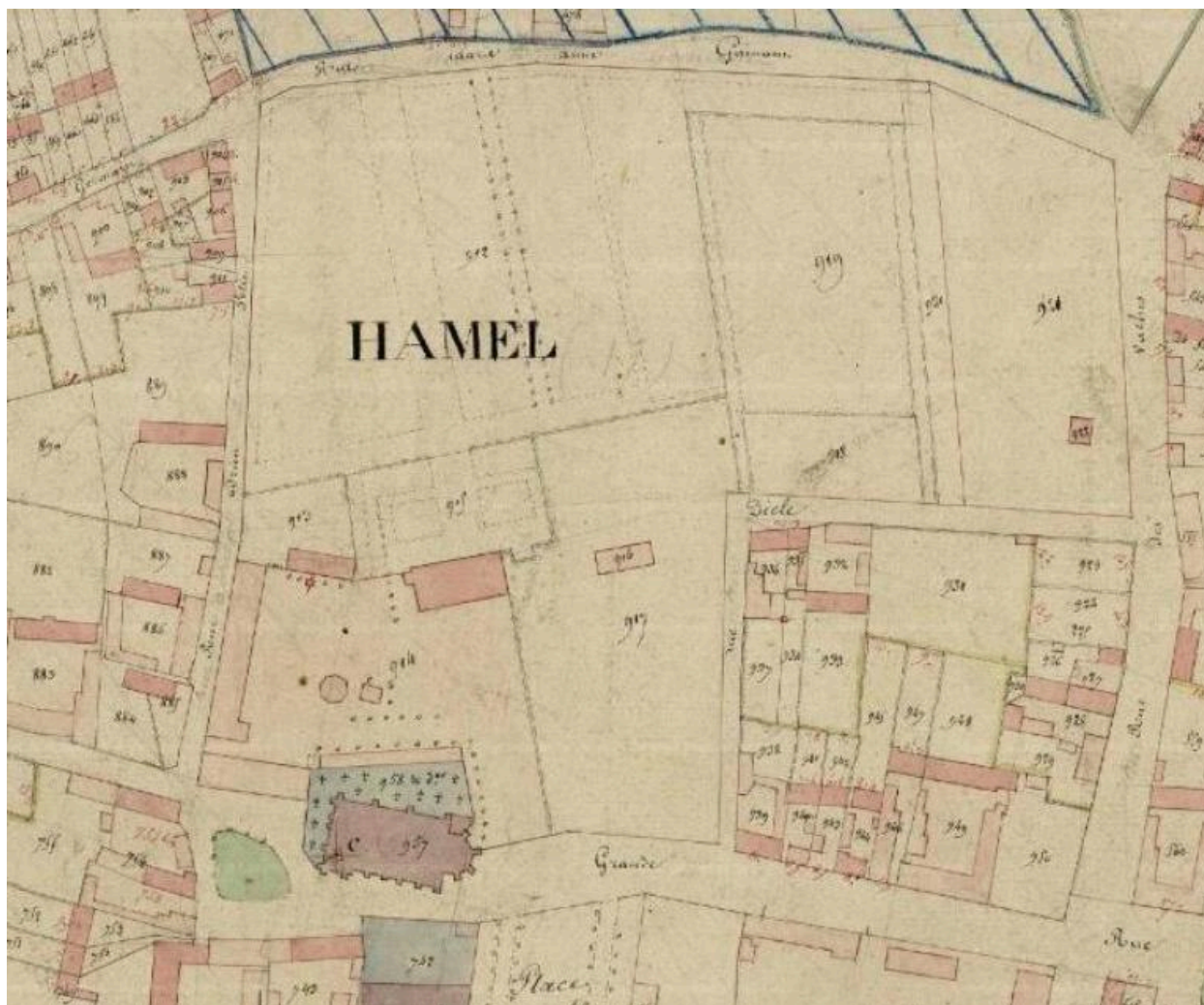
L'église et le château du Hamel. Plan cadastral, section D, dite du chef-lieu, avant 1827 (AD Somme ; 3P 1652/6).