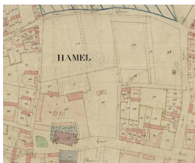
L'église et le château du Hamel. Plan cadastral, section D, dite du chef-lieu, avant 1827 (AD Somme ; 3P 1652/6).

IVR32_20168005617NUCA