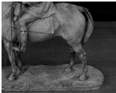
Détail : signature et date sur la terrasse.