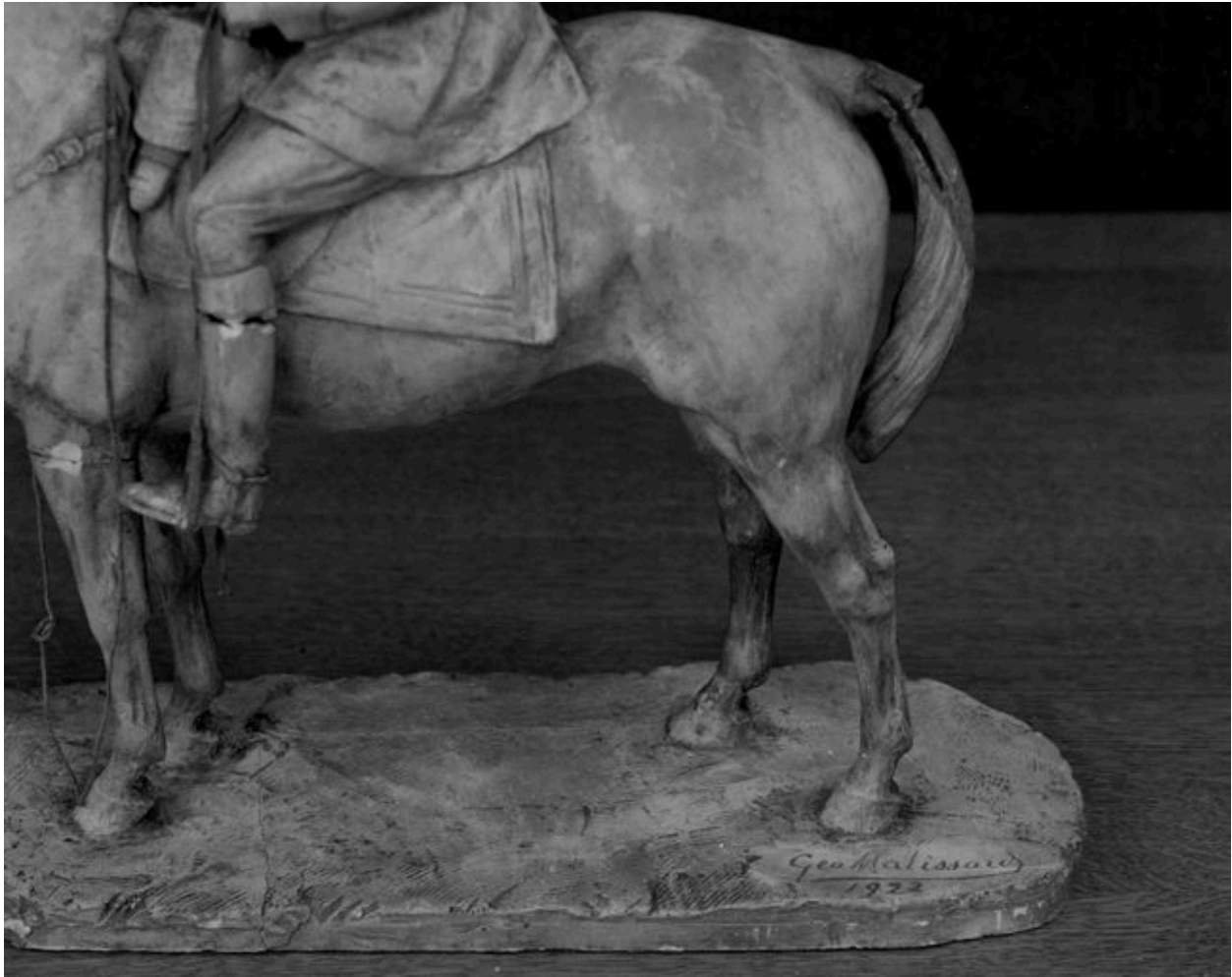
Détail : signature et date sur la terrasse.