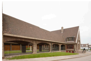
Vue des galeries et de la chapelle de semaine. IVR31_20106200728NUCA