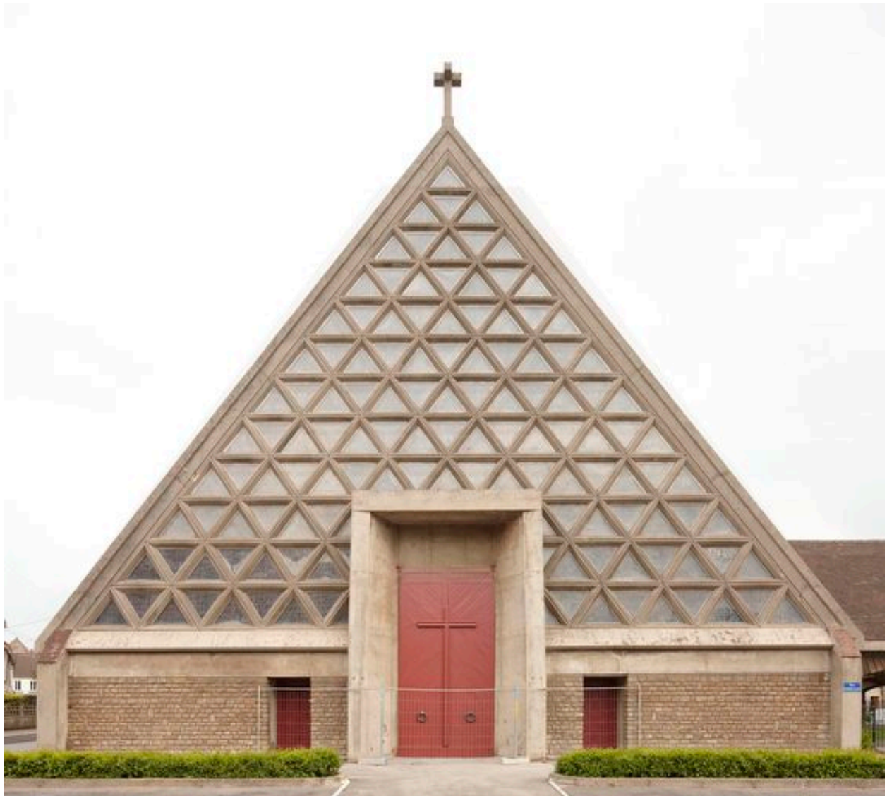
Vue de la façade.