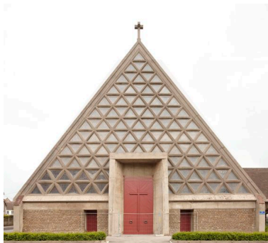
Vue de la façade.