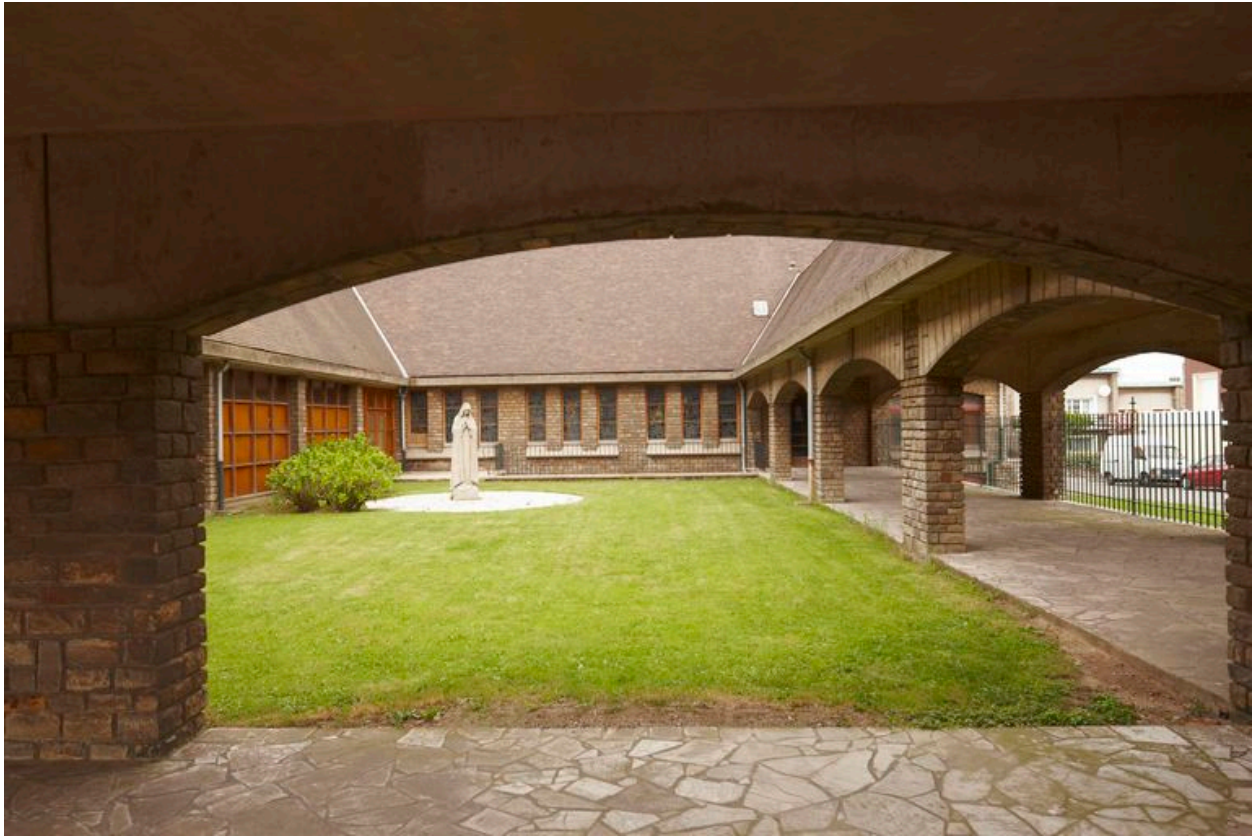
Vue des galeries.