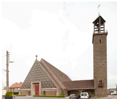
Vue générale. IVR31_20106200727NUCA