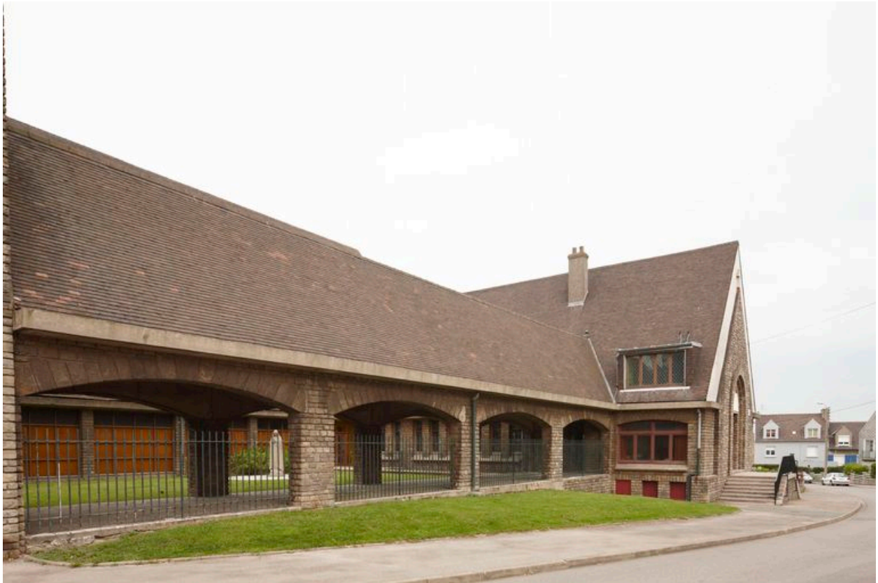
Vue des galeries et de la chapelle de semaine.