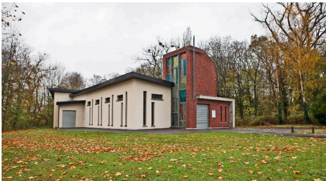
Vue générale de l'église reconstruite en 2007.