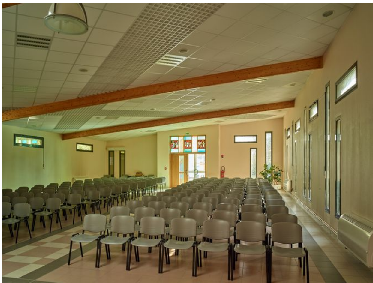
Vue de la nef depuis le chœur.