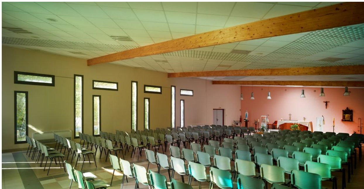
Vue du choeur depuis l'entrée de l'église.