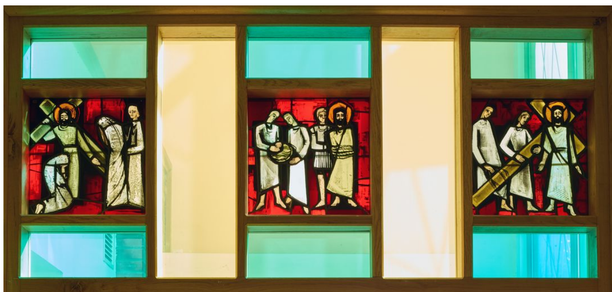
Vue des verrières au dessus de la porte d'entrée.