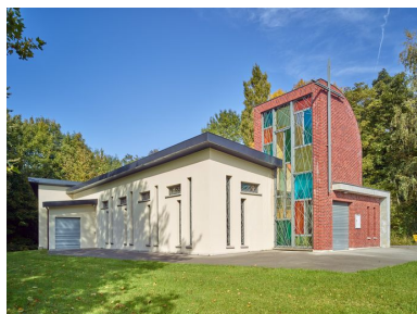
Vue de trois quart de l'élévation antérieure et du côté gauche. IVR31_20156200268NUCA