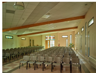
Vue de la nef depuis le chœur.