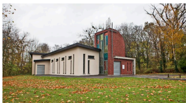
Vue générale de l'église reconstruite en 2007.