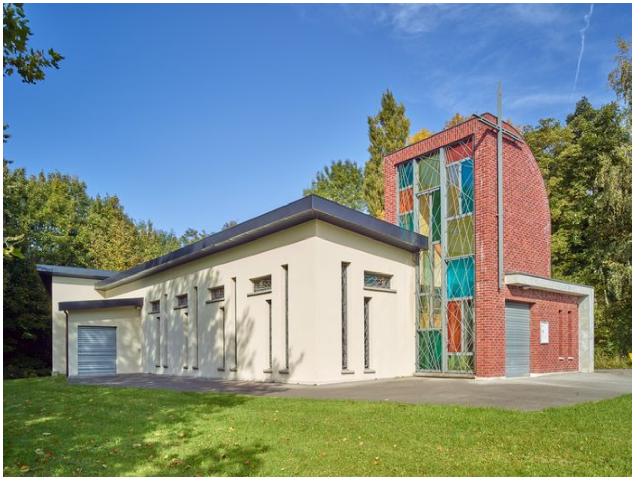
Vue de trois quart de l'élévation antérieure et du côté gauche.