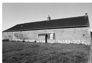
Vue générale. IVR22_19980202658Z