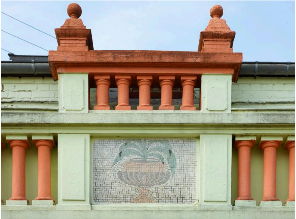
Détail du décor de la façade.