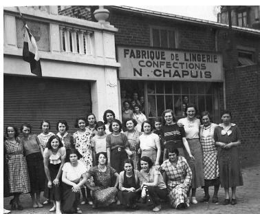
Vue de situation avec les ateliers de confection Chapuis à l'arrière plan. Photographie vers 1950. IVR32_20196200964NUC1A