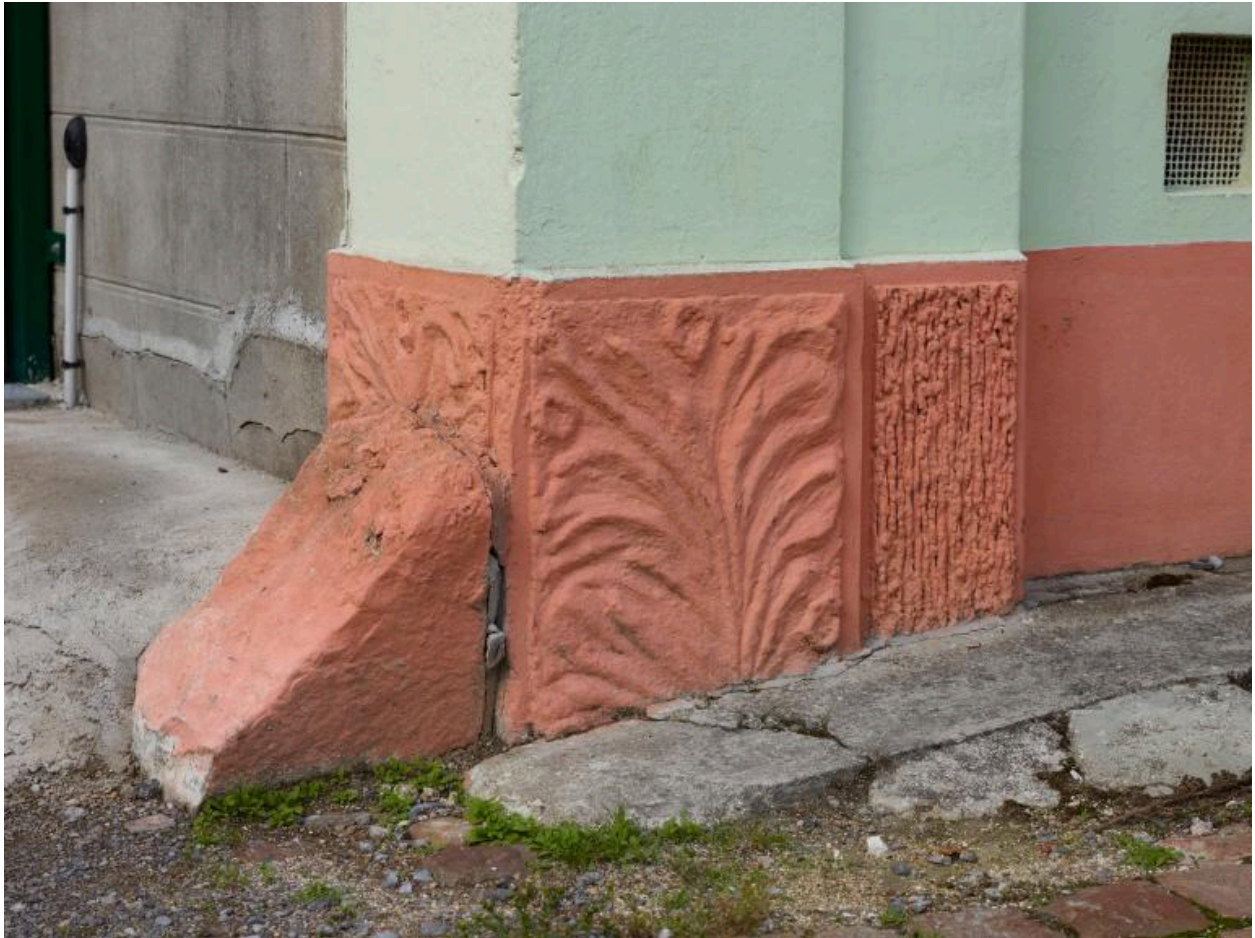
Détail du décor du bas du pilastre.