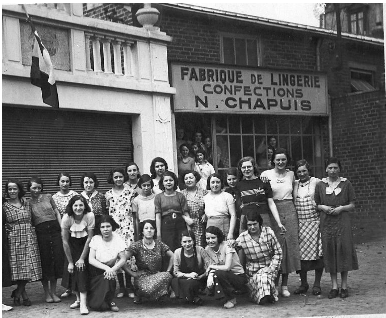
Vue de situation avec les ateliers de confection Chapuis à l'arrière plan. Photographie vers 1950.