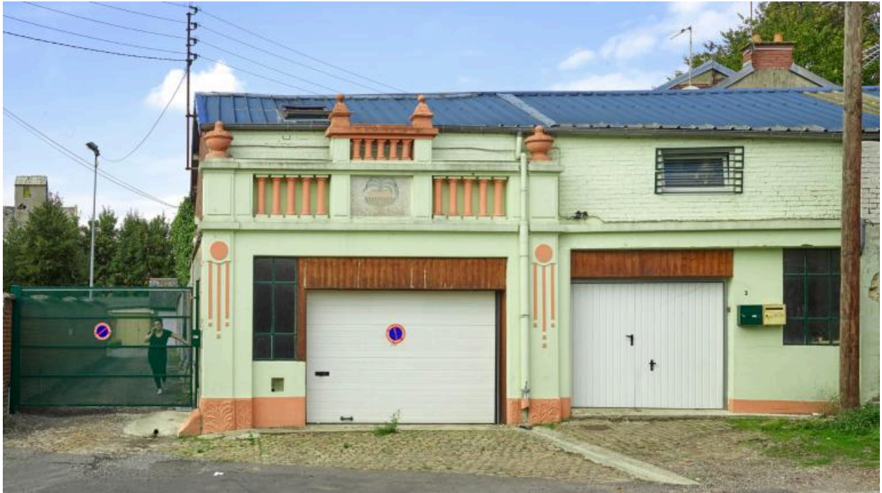
Vue de la façade.