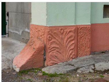
Détail du décor du bas du pilastre.