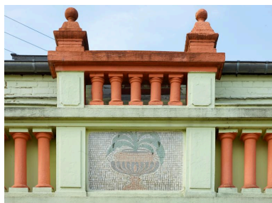
Détail du décor de la façade. IVR32_20196200522NUC4A