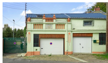
Vue de la façade. IVR32_20196200520NUC4A