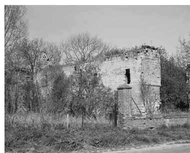
Elévation sud.