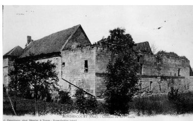
Le château, avant 1914.