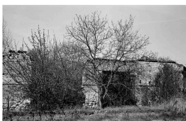
Elévation est.