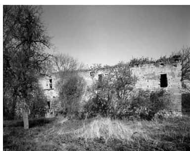
Elévation sud. IVR22_19856000585V