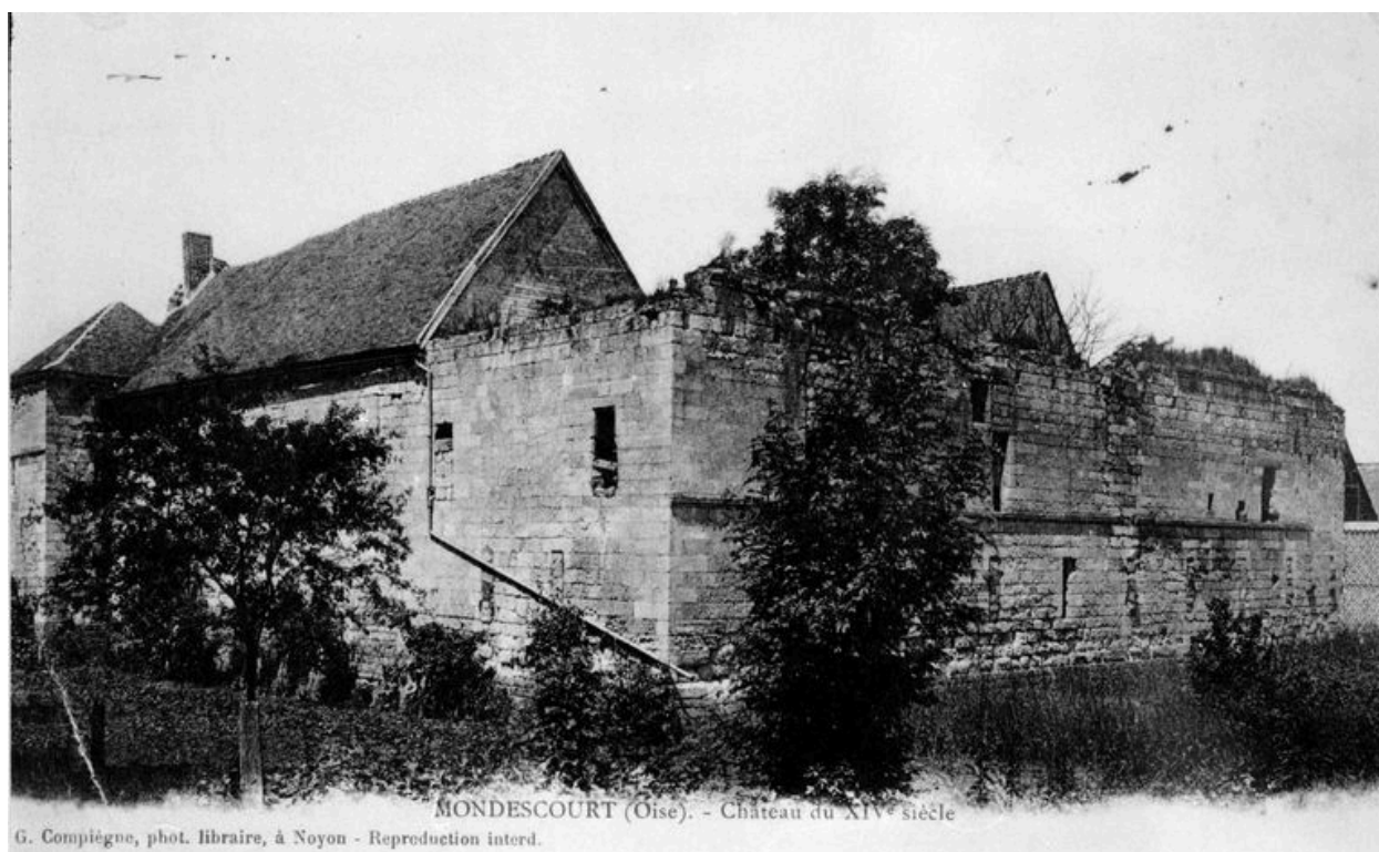
Le château, avant 1914 (AP).