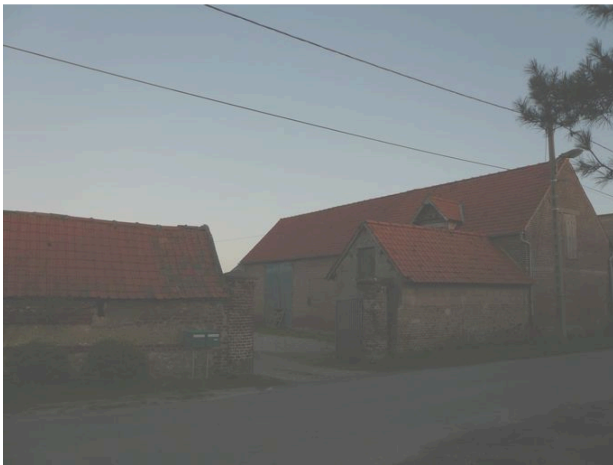
Entrée de la propriété.