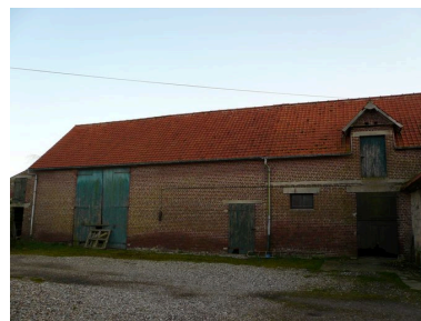
Vue de la grange. IVR22_20058006396NUCA