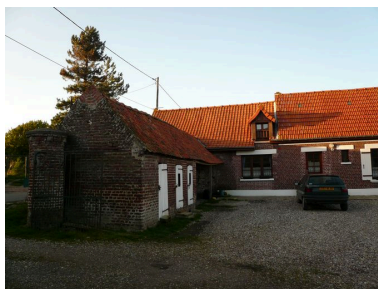
Vue des étables à cochons depuis la cour.