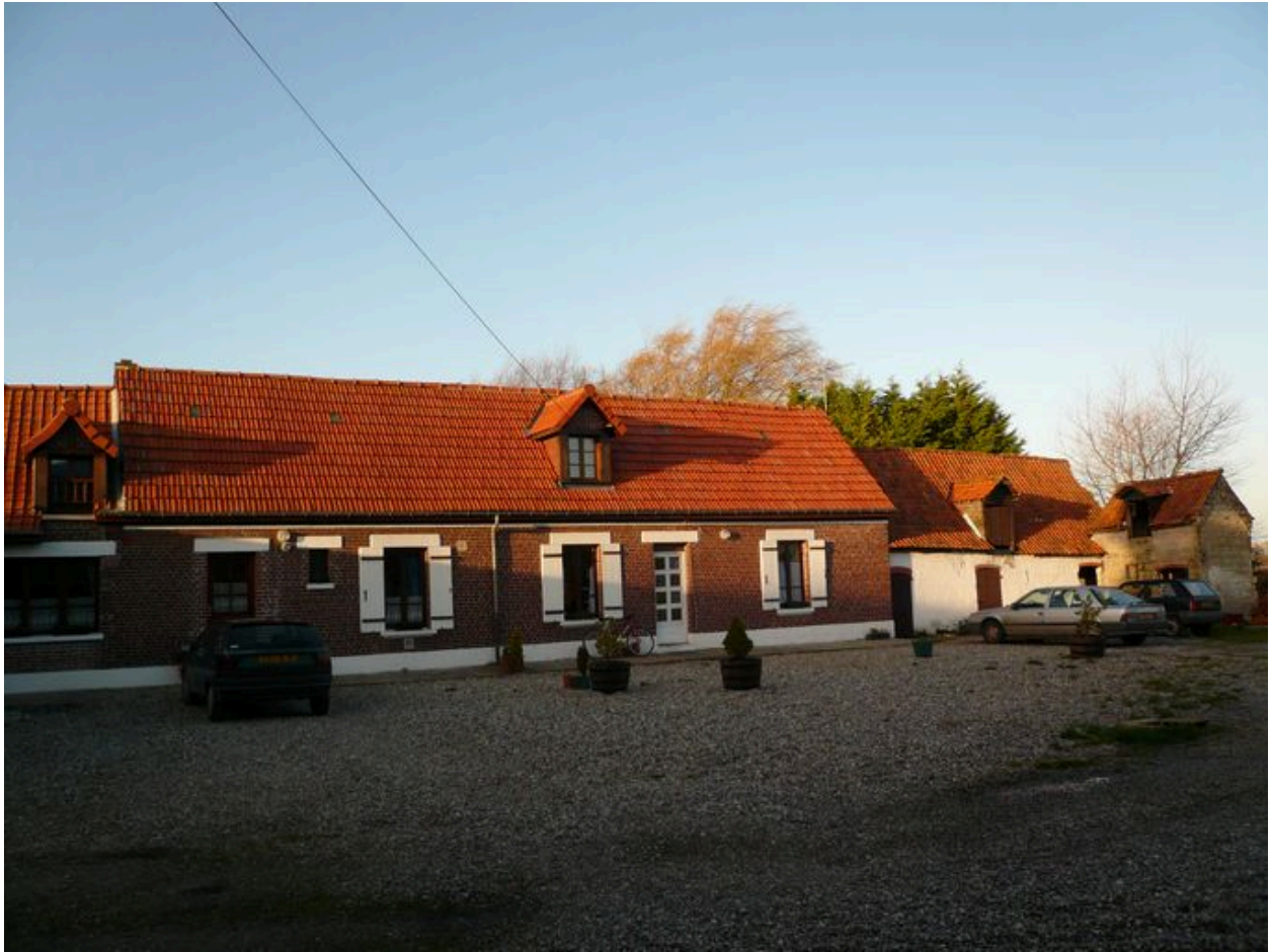
Vue du logis depuis la cour.