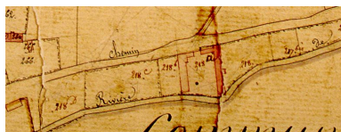
Extrait du cadastre napoléonien présentant le plan de la ferme en 1828.

IVR22_20078005447XAB