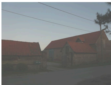
Entrée de la propriété. IVR22_20058006392NUCA

IVR22_20078005447XAB