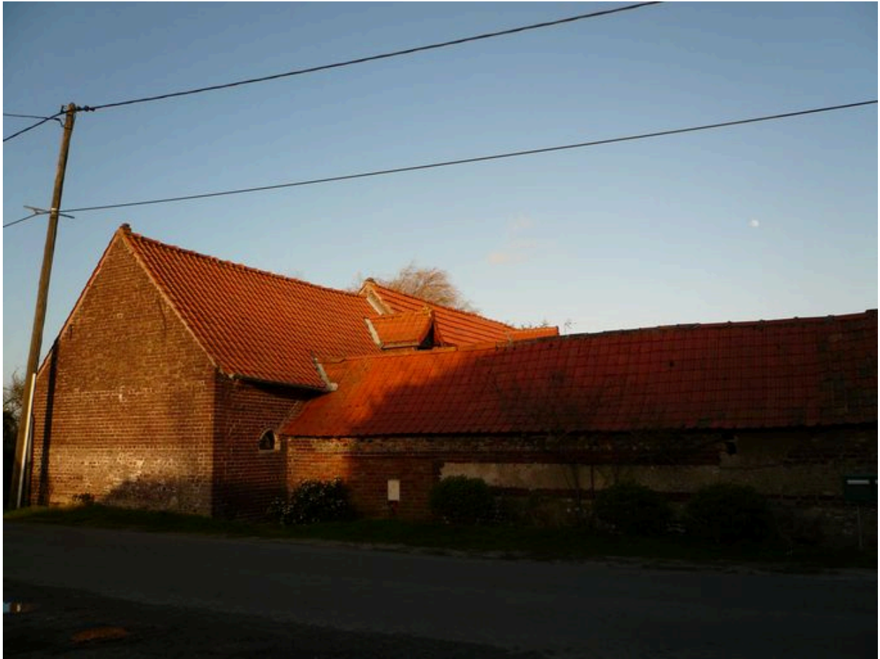
Vue du logis depuis la rue.