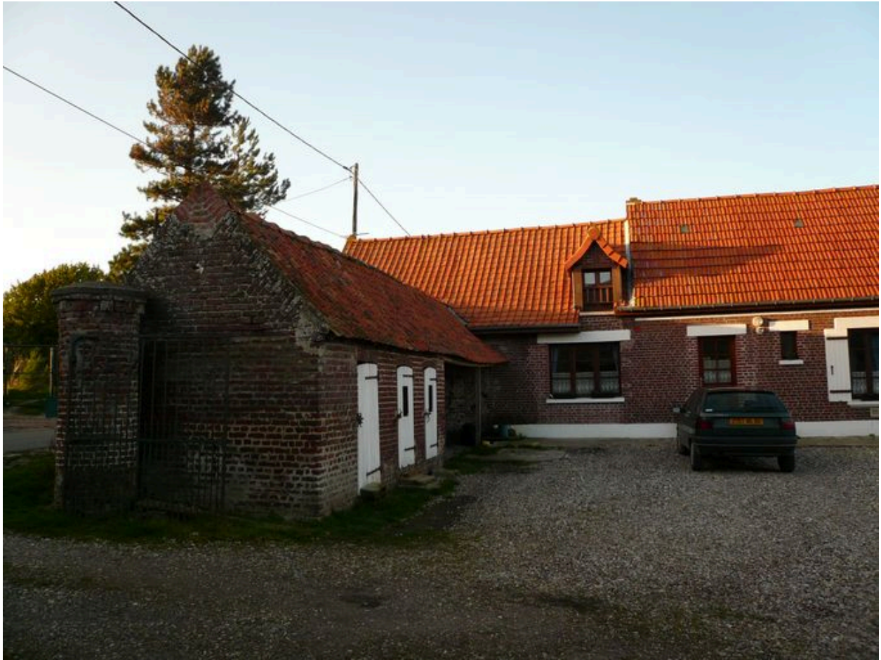
Vue des étables à cochons depuis la cour.