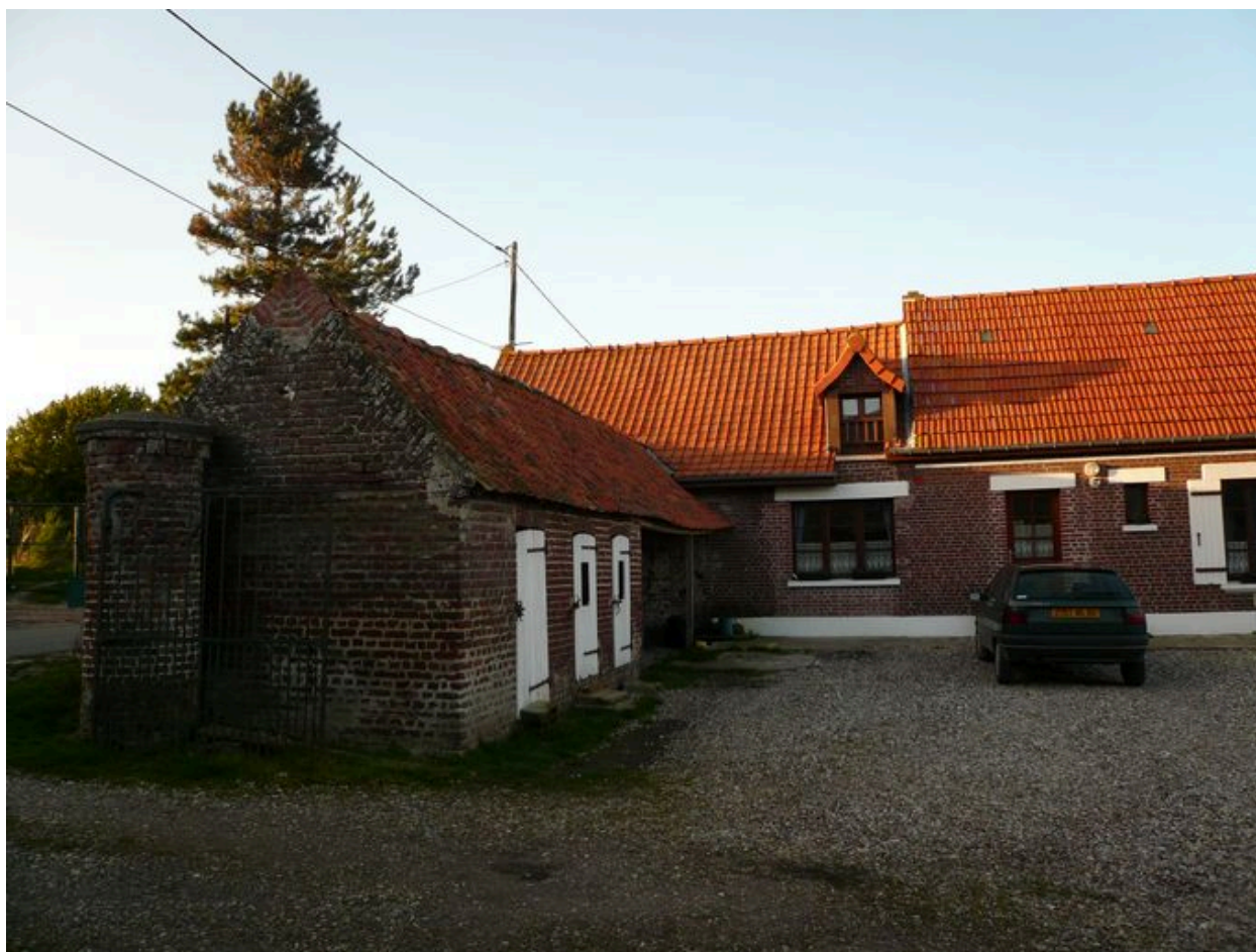
Vue des étables à cochons depuis la cour.