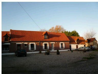
Vue du logis depuis la cour.