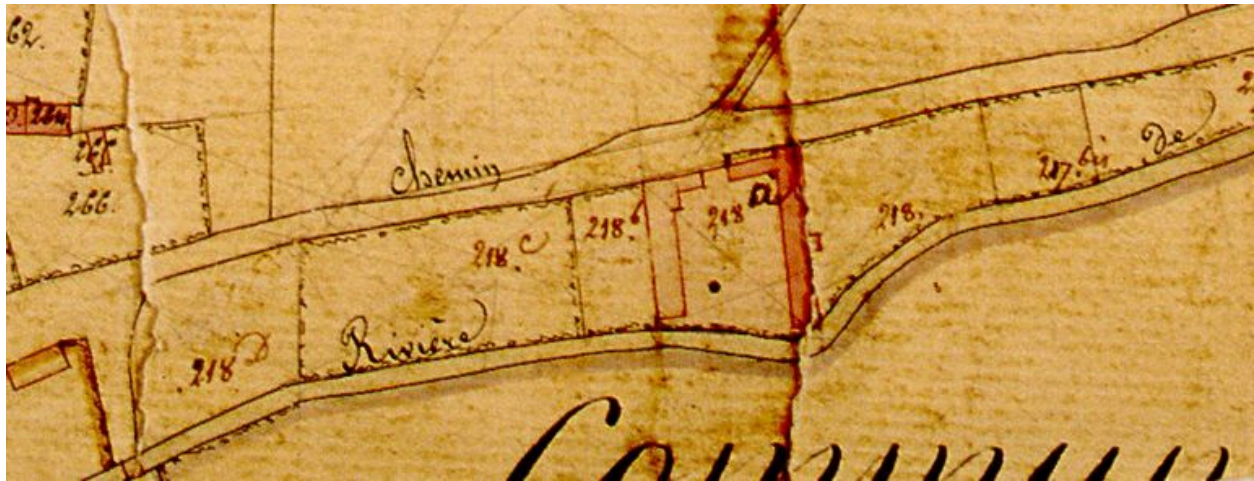
Extrait du cadastre napoléonien présentant le plan de la ferme en 1828.