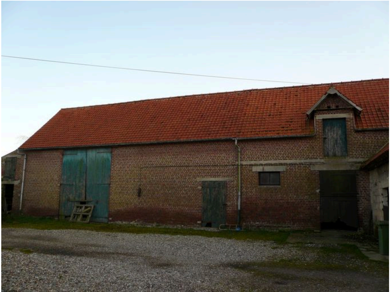
Vue de la grange.