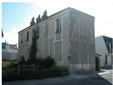
Vue d'ensemble. IVR22_20058003798NUCA