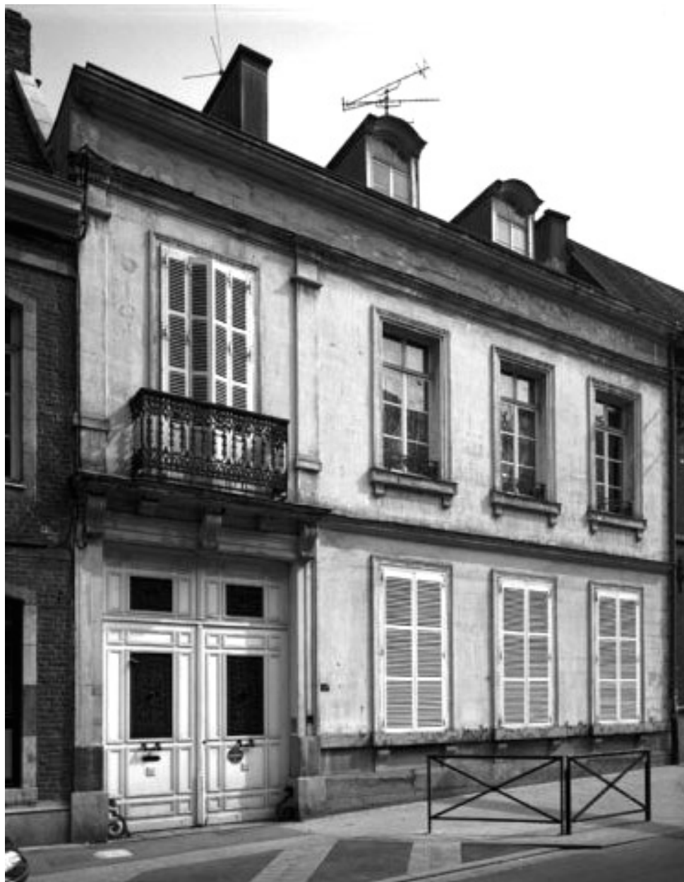
Vue générale (état en 2001).