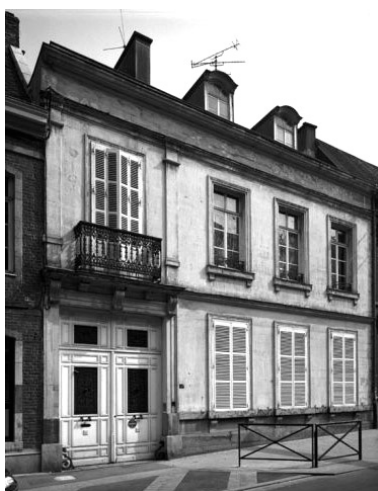
Vue générale (état en 2001). IVR31_20015901128V

IVR31_20085900340XE