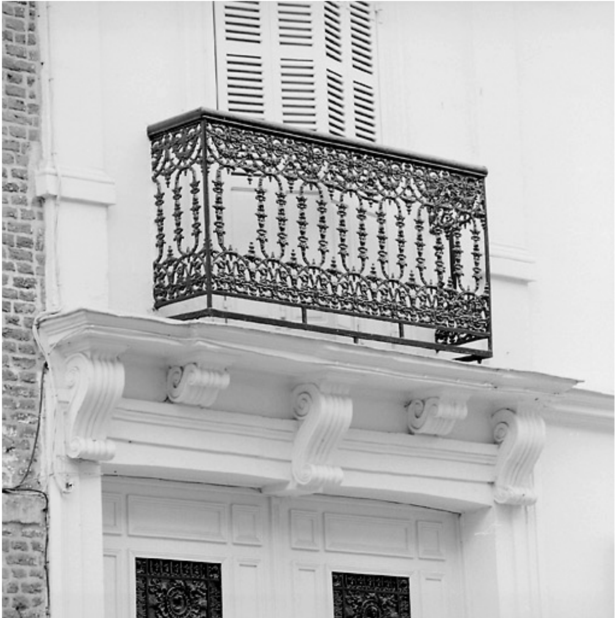
Détail : balcon.