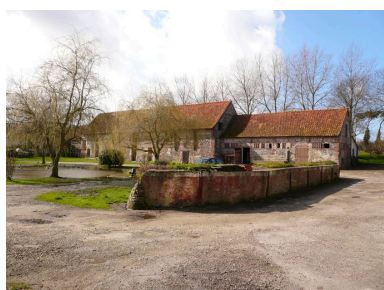
L'ancienne cosseterie de la ferme de Mayoc.