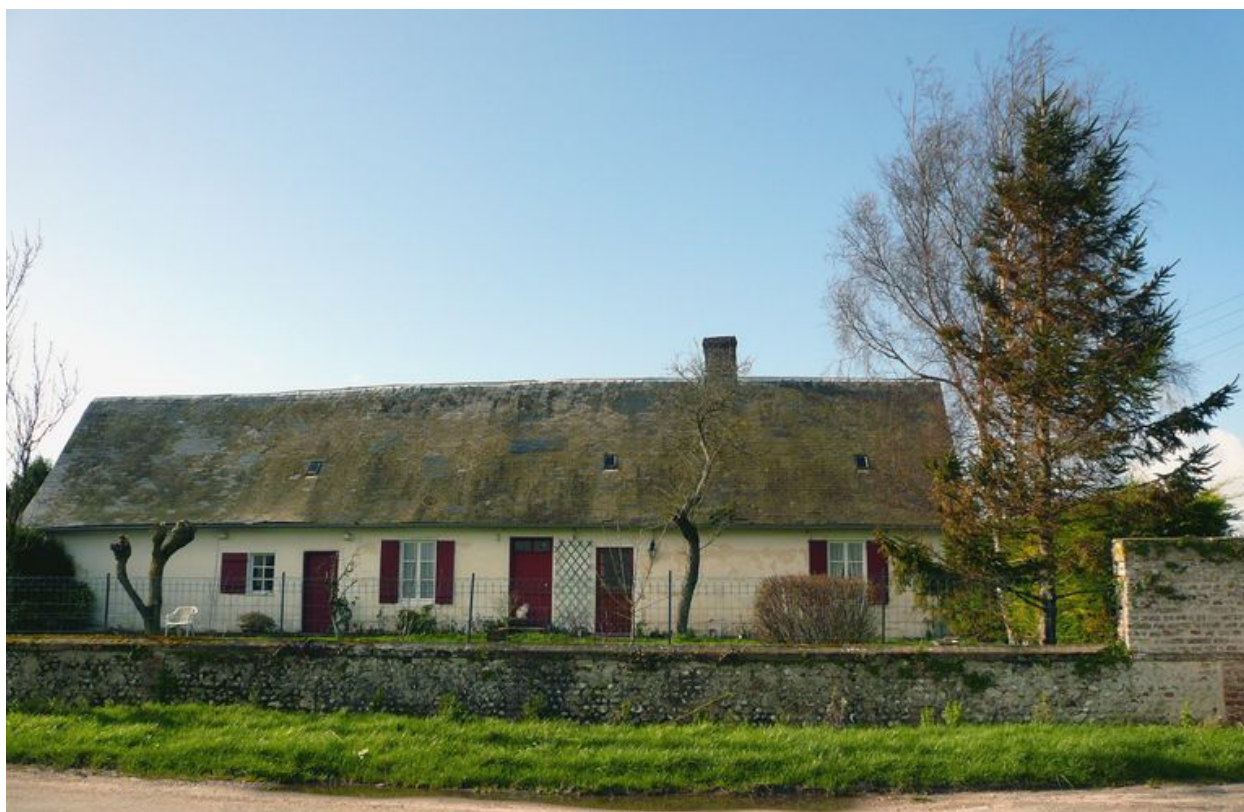
Ferme et ancien café Turbet.