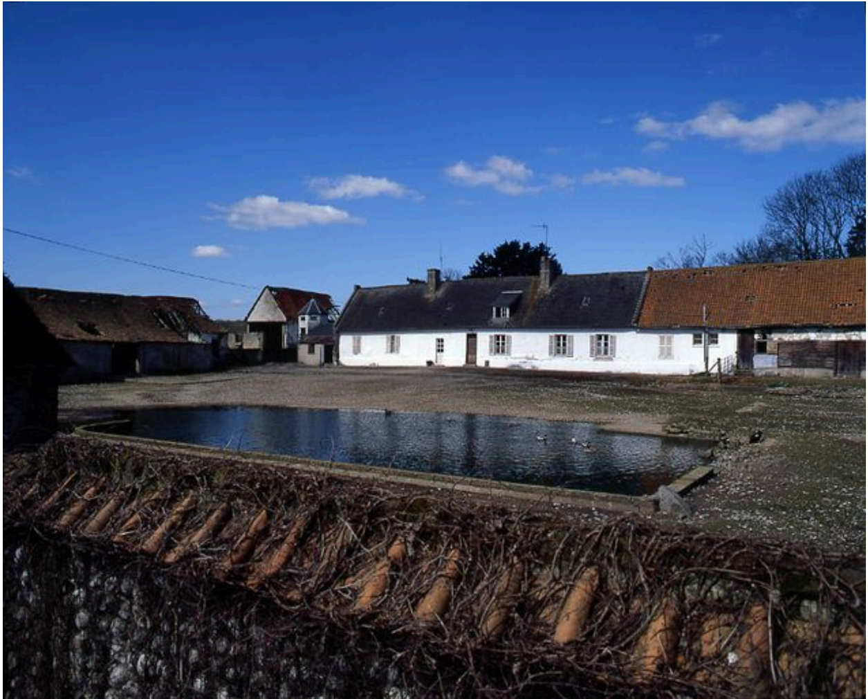
Ancienne ferme Guinée.