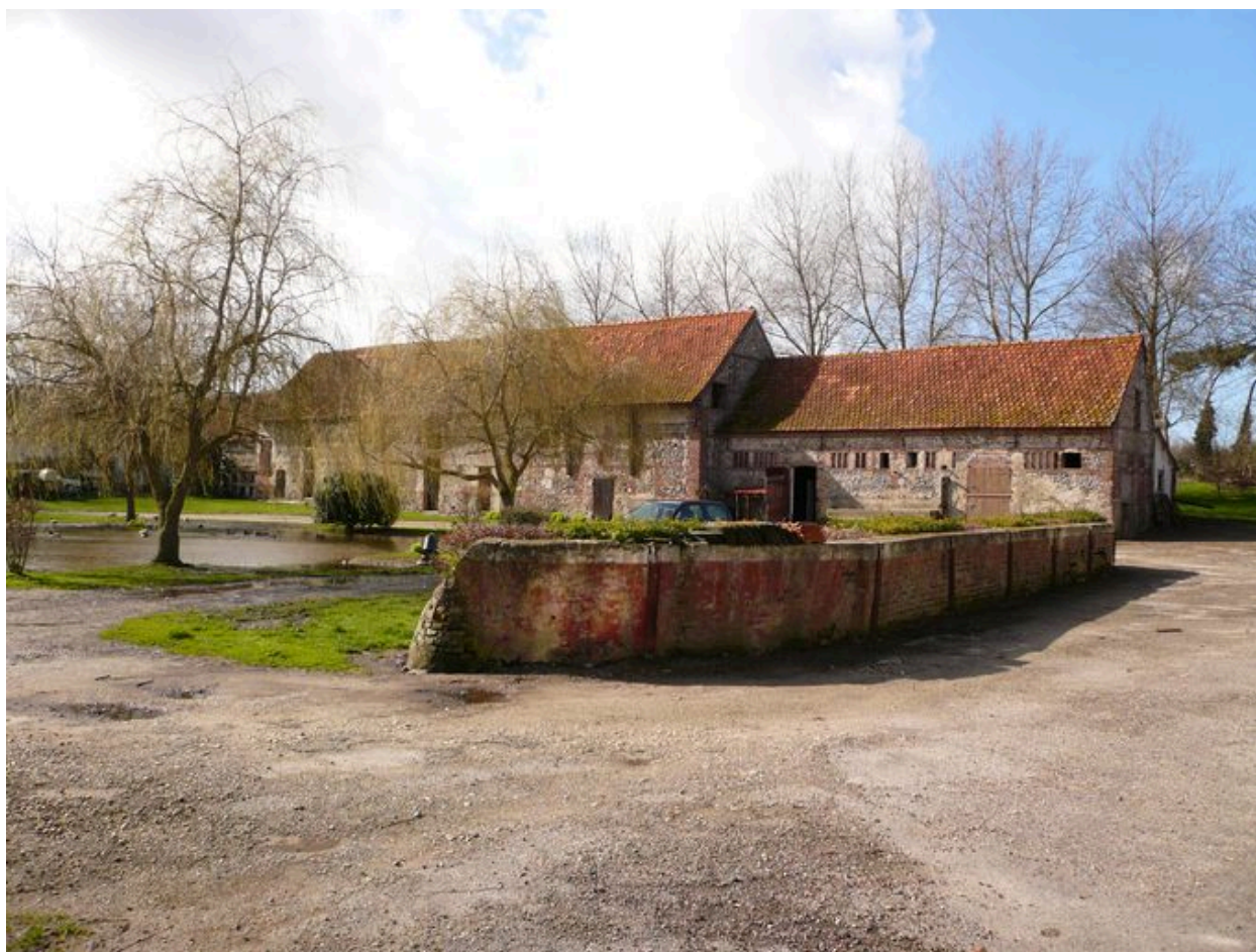
L'ancienne cosseterie de la ferme de Mayoc.