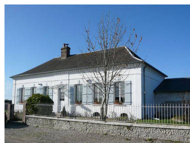
Ancienne ferme. IVR22_20058001443NUCA