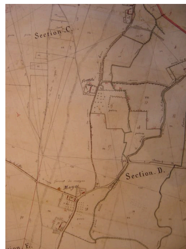
Extrait du cadastre par masse de culture présentant le plan du hameau en 1805.

IVR22_20078005360NUCAB