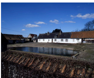
Ancienne ferme Gruinée.