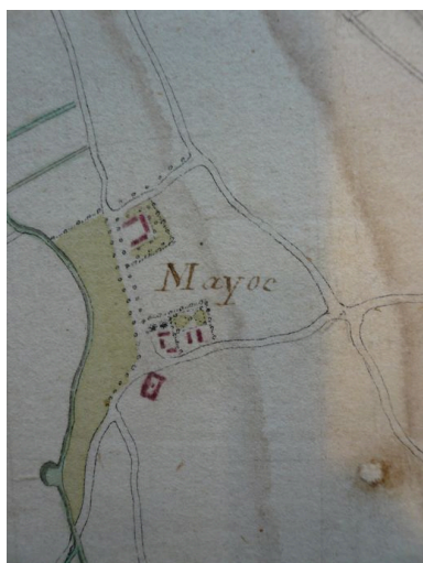
Plan du hameau de Mayoc au 18e siècle.