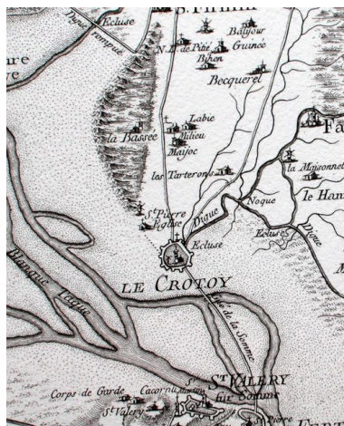
Extrait de la carte de Cassini présentant le territoire du Crotoy et le hameau de Mayoc vers 1756.

IVR22_20078005359NUCAB