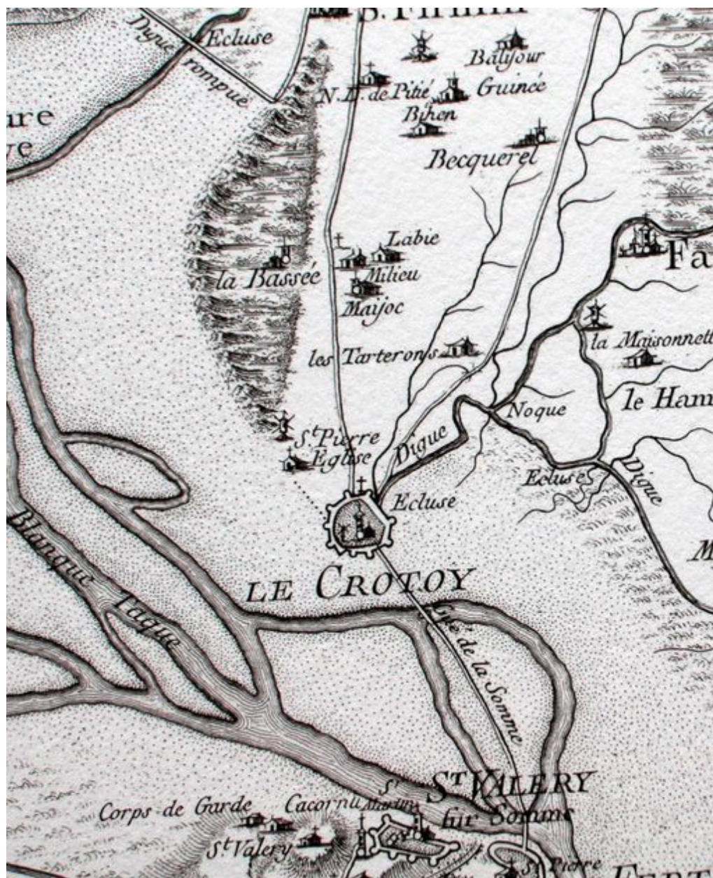
Extrait de la carte de Cassini présentant le territoire du Crotoy et le hameau de Mayoc vers 1756.