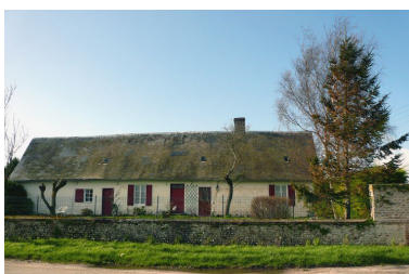
Ferme et ancien café Turbet.