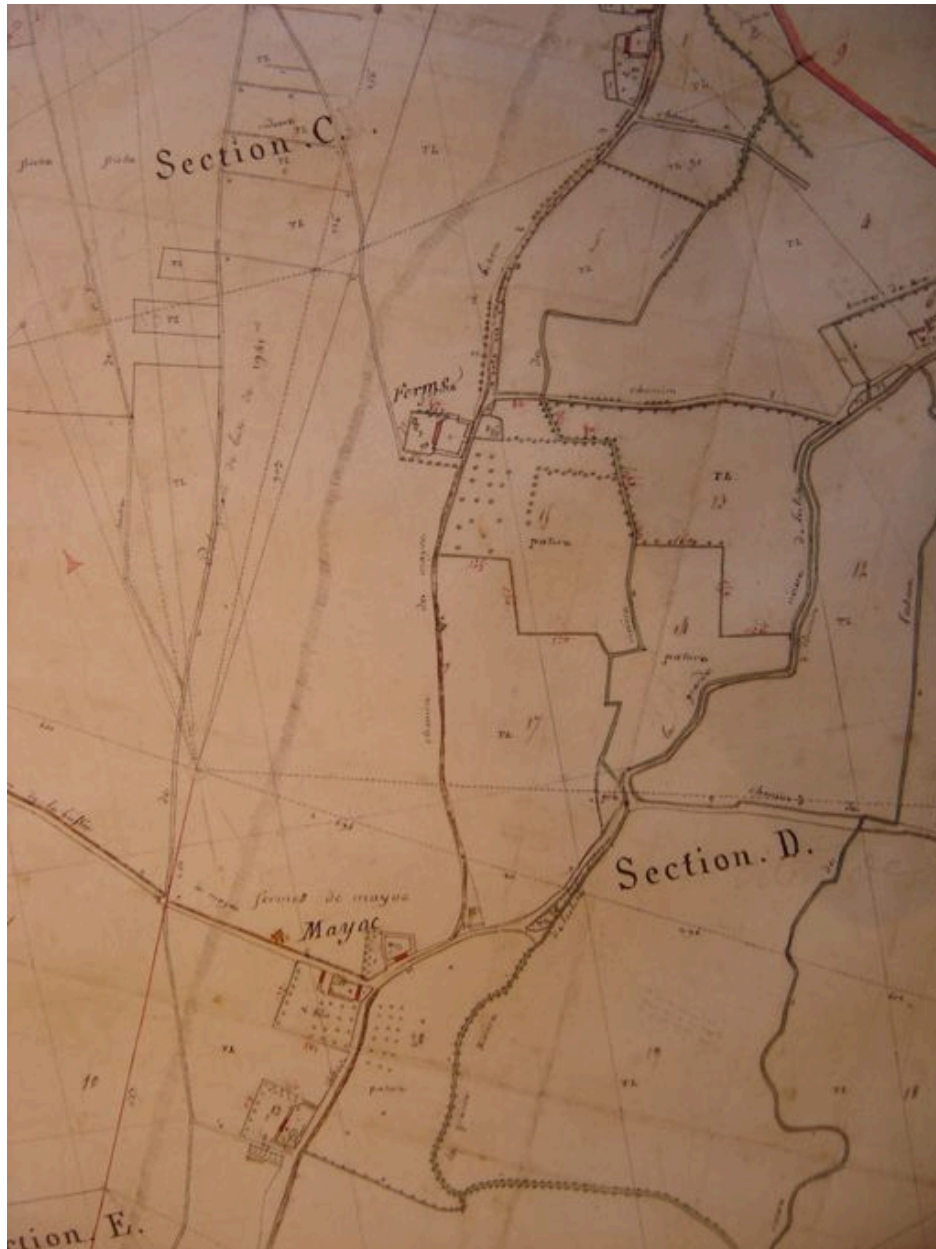
Extrait du cadastre par masse de culture présentant le plan du hameau en 1805.